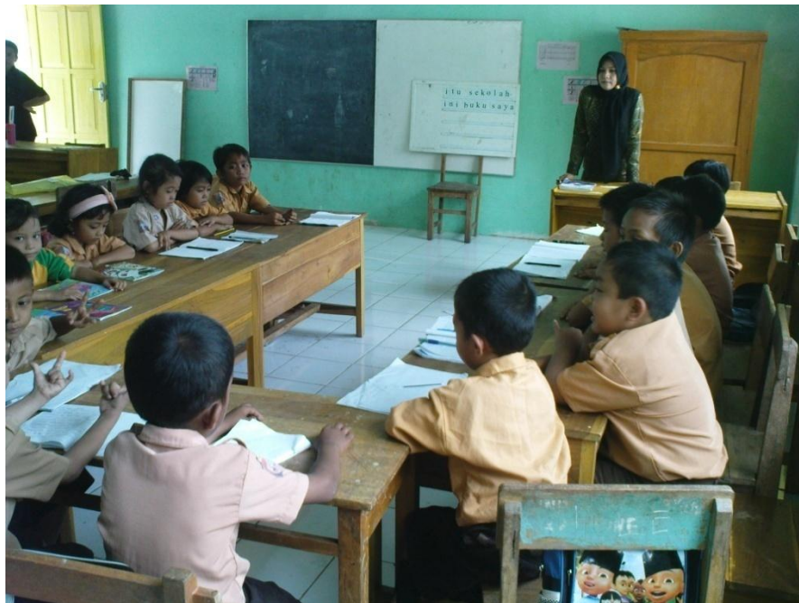
Foto 6 : Guru mengajar dengan menggunakan kartu huruf dan siswa memperhatikan