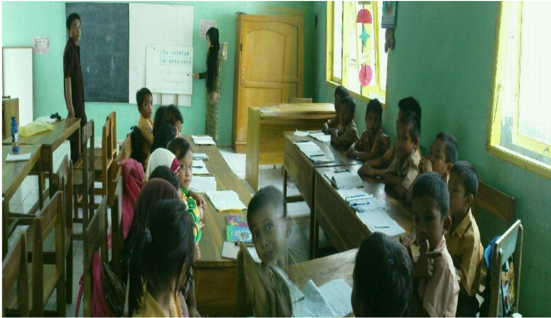
Foto 3 : Kepala Sekolah mengamati proses belajar pembelajaran kartu huruf.