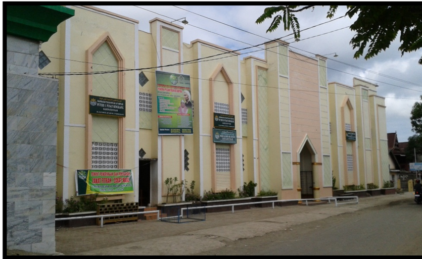
(Gambar 6: Foto Masjid Jami' Sengkang. Masjid pertama mendirikan M.A.I. dan pengajian kitab kuning)