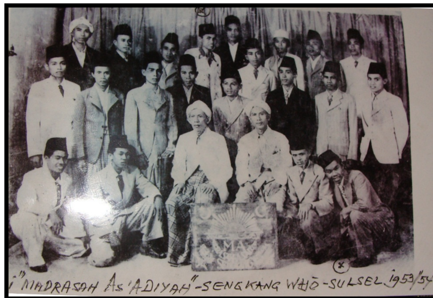
(Gambar 4: Foto bareng guru dan murid As'adiyah Sengkang tahun 1953)