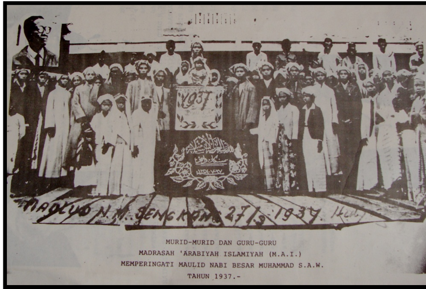
(Gambar 3: Foto bareng murid dan guru M.A.I. se usai memperingati Maulid Nabi Muhammad Saw. Tahun 1937 M)