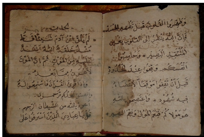
(Gambar 7: Buku catatan kecil Khutbah AG.H. Muhammad As'ad dalam bahasa Arab)