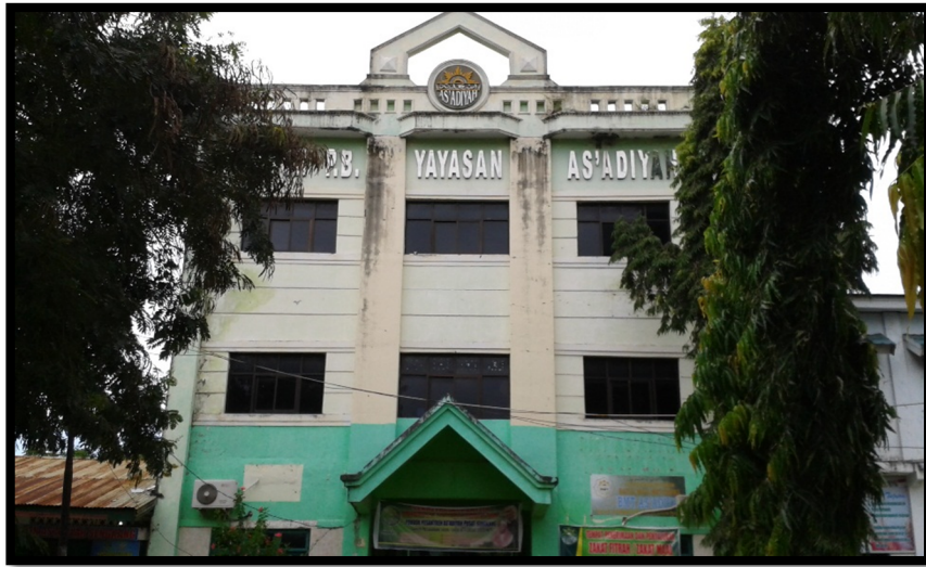
(Gambar 5: Kantor Pusat Pengurus Besar As'adiyah di Jl. Vetran No. 46 Sengkang)