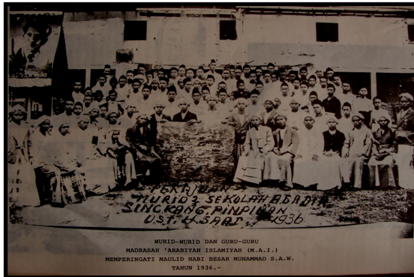
(Gambar 2: Foto bareng murid dan guru M.A.I seusai memperingati Maulid Nabi Muhammad Saw. Tahun 1936 M)