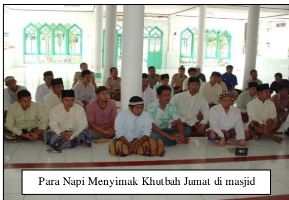
Para Napi Menyimak Khutbah Jumat di masjid