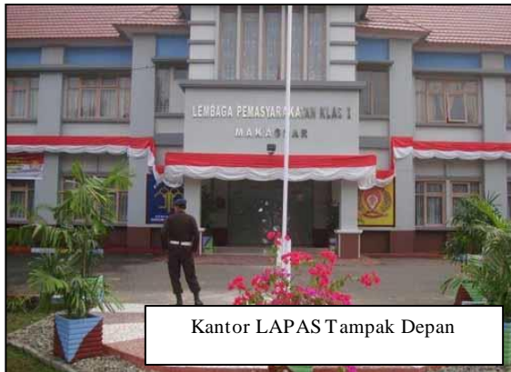
Kantor LAPAS Tampak Depan