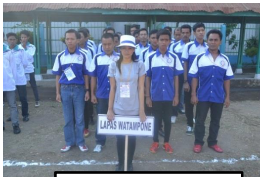
Peserta TIM Lapas Watampone