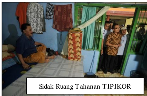
Sidak Ruang Tahanan TIPIKOR