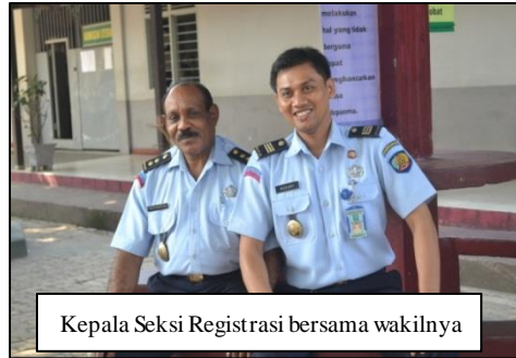
Kepala Seksi Registrasi bersama wakilnya