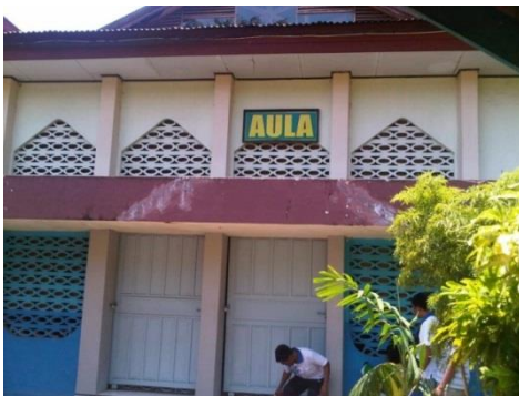
Tampak Depan AULA Lapas