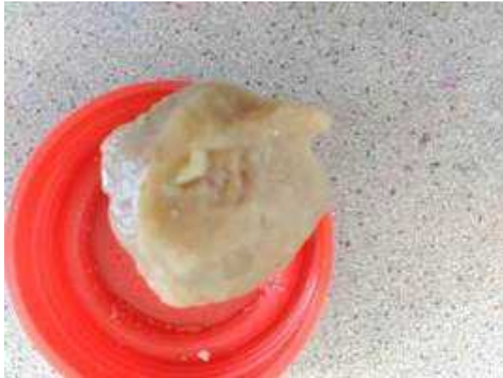
Bakso dengan perendaman BAL