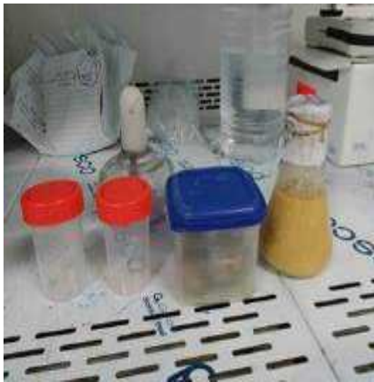
Alat dan bahan yang digunakan