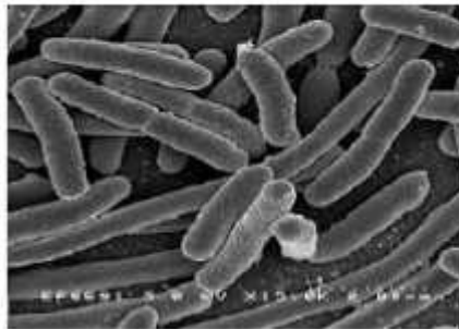
Gambar 2.2 Bentuk Escherichia coli