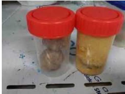
Perendaman bakso pada kultur kerja