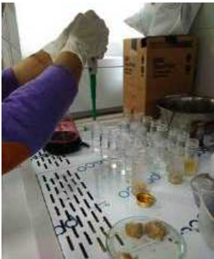
Pemipetan larutan NaCl fisiologis