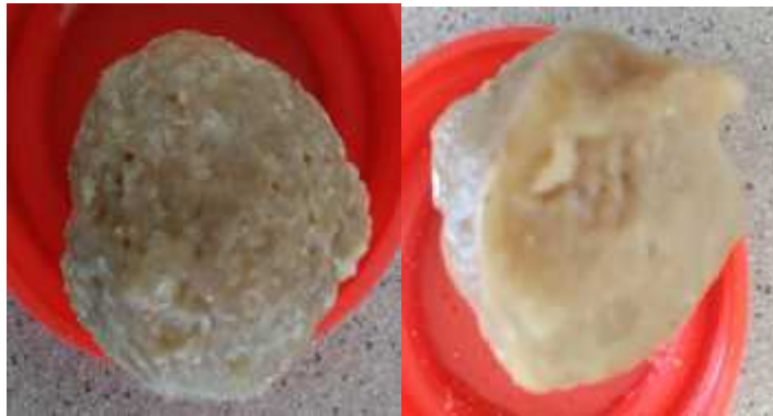
Gambar 4.2. Struktur bakso setelah penyimpanan 2 (48 jam) hari pada suhu ruang