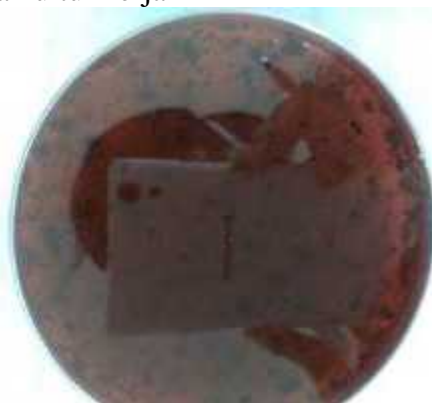
Cawan analisa total E. coli