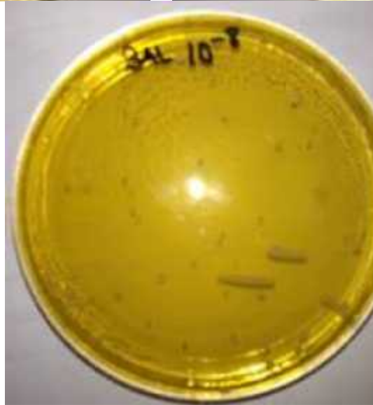
Cawan analisa total BAL pada kultur kerja