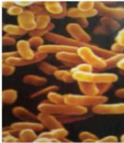
Gambar 2.1 Escherichia coli

indikator sanitasi. Bakteri ini tidak selalu patogen, akan tetapi dapat menjadi penyebab dari infeksi saluran urin, serta beberapa strain memproduksi enterotoksin yang menyebabkan penyakit diare dan juga penyakit keracunan makanan serius lainnya.