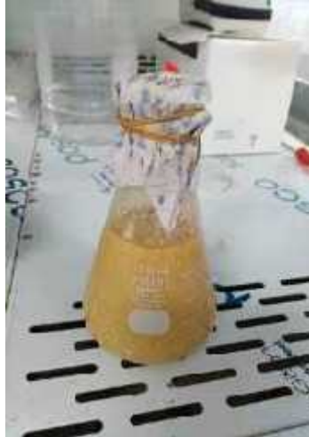
Kultur Kerja BAL