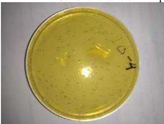
Cawan analisa total mikroba