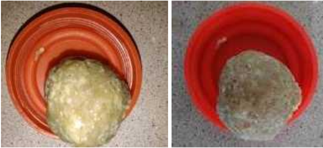
Bakso tanpa perendaman (kontrol)