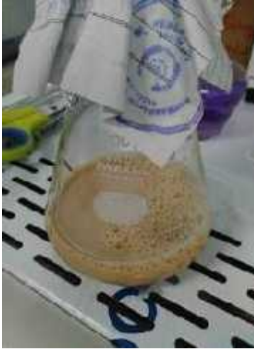
Media susu skim