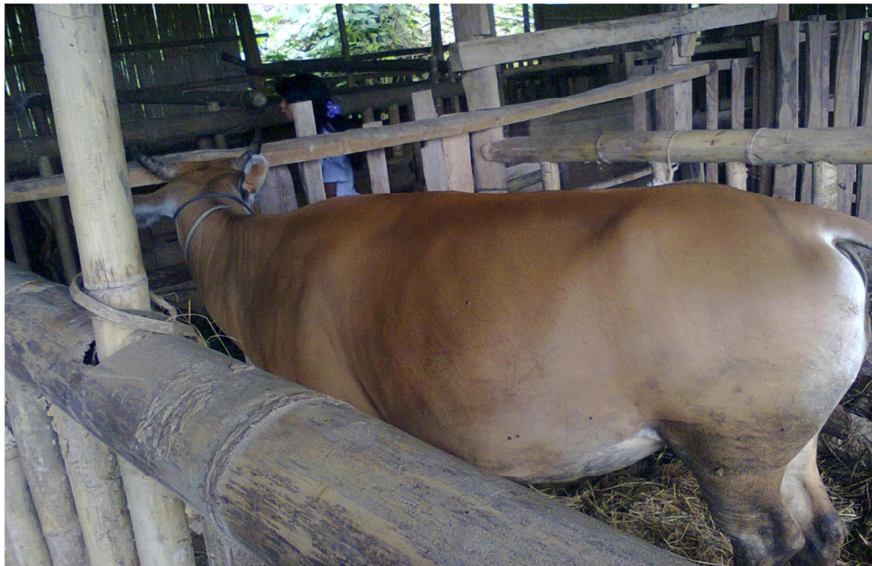
Gambar 2. Sapi betina produktif