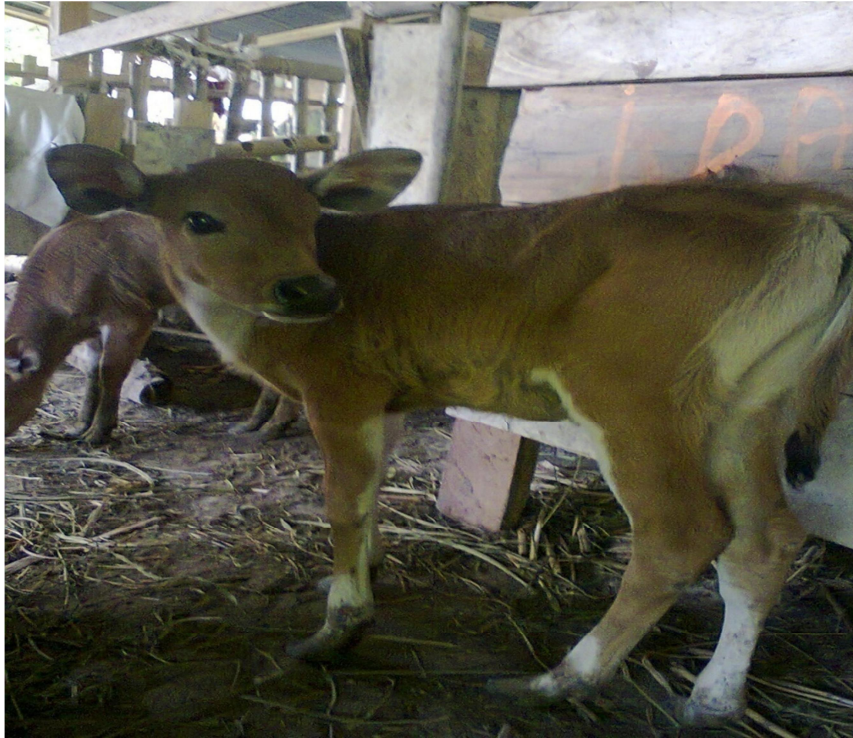
Gambar 3. Anak sapi hasil budidaya