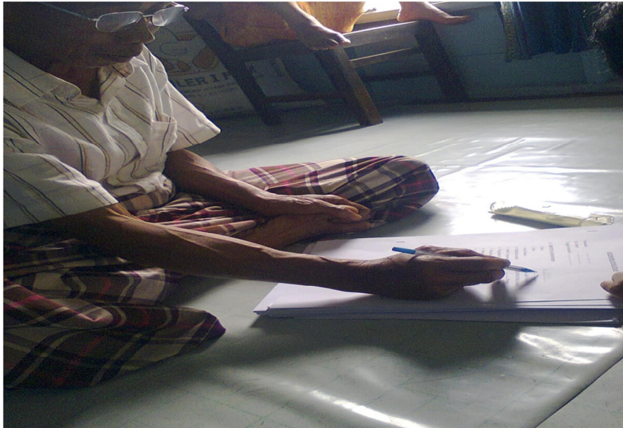
Gambar 5. Pengisian Lembar Kuesioner oleh Responden