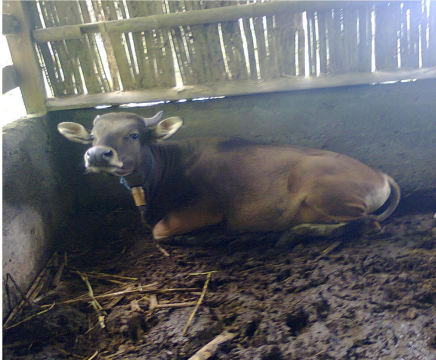
Gambar 1. Sapi Pejantan Produktif