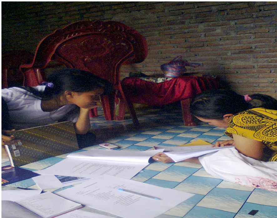
Gambar 4. Pengisian lembar Kuesioner oleh Responden