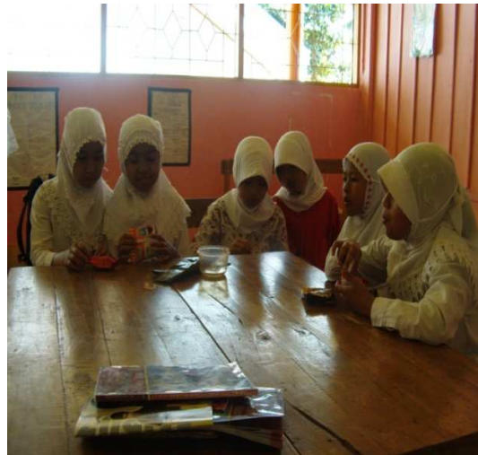
Jajan pada jam istirahat