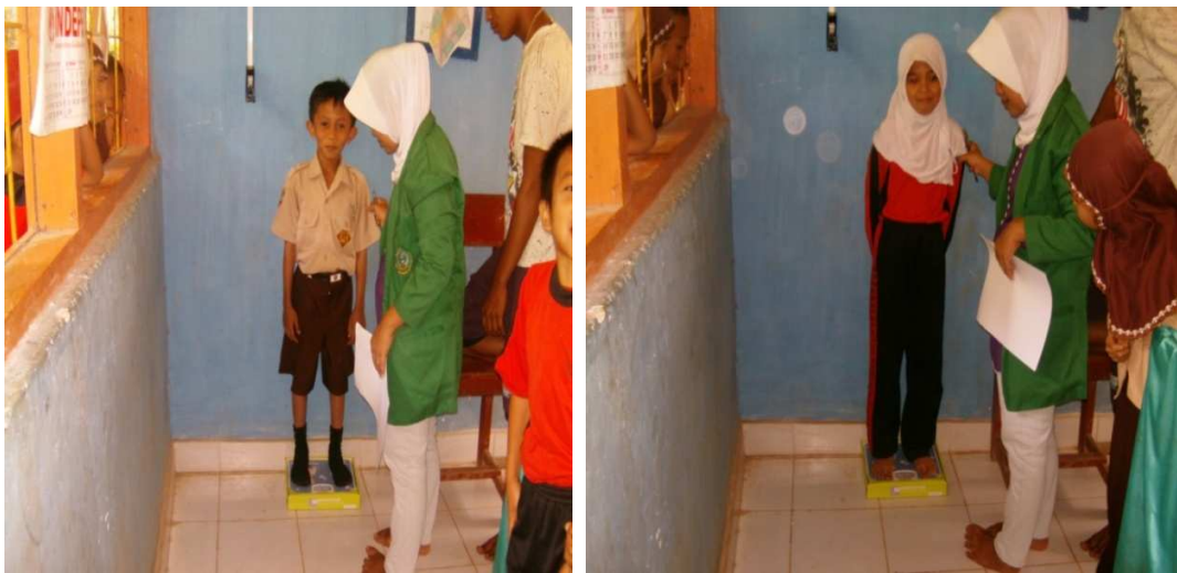
Pengukuran berat badan