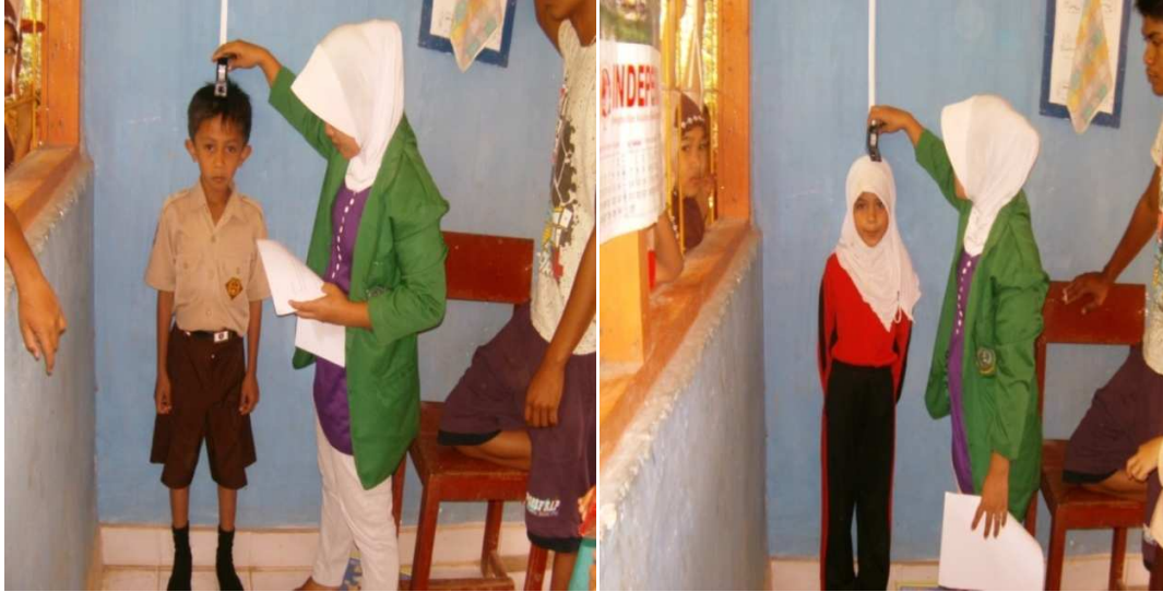
Pengukuran tinggi badan