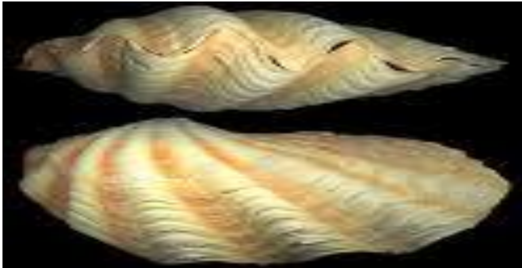
Gambar.5. Kerang kima Tridacna crocea 48