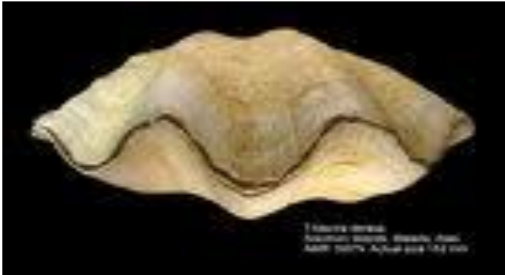
Gambar.3. kerang kima Tridacna derasa