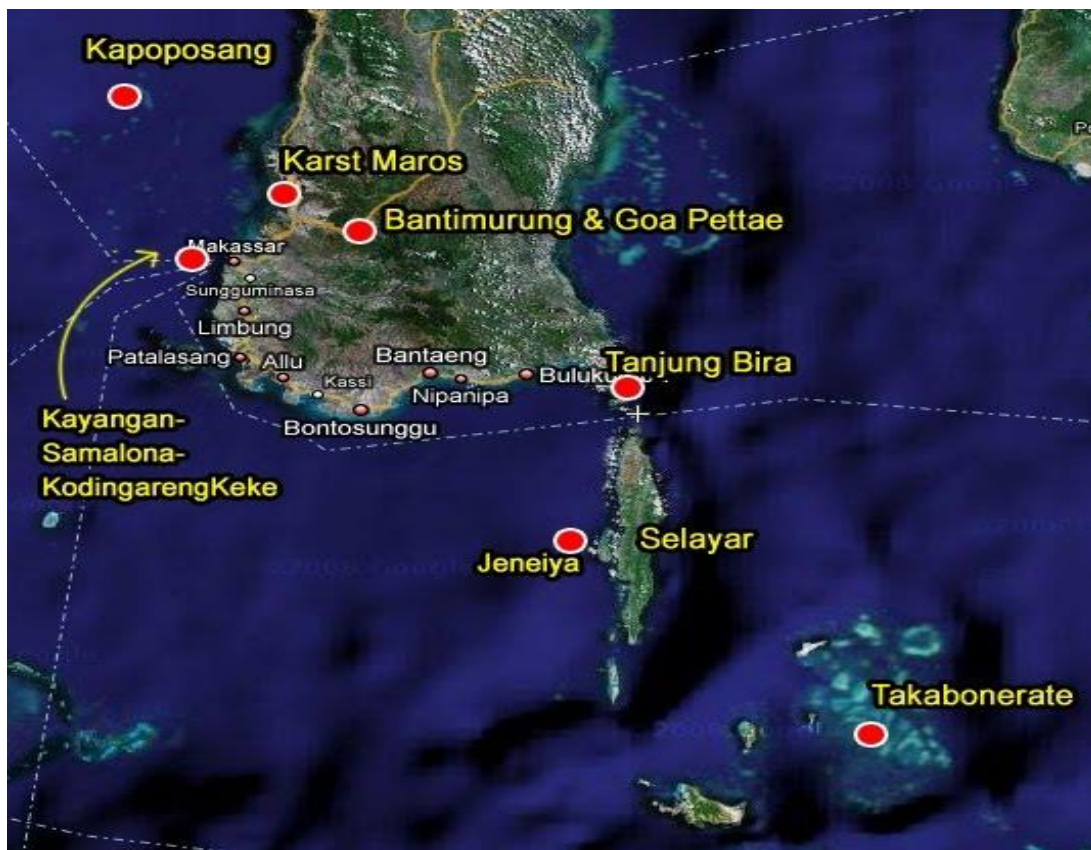
Peta lokasi Pelabuhan Feri Bira Kabupaten Bulukumba