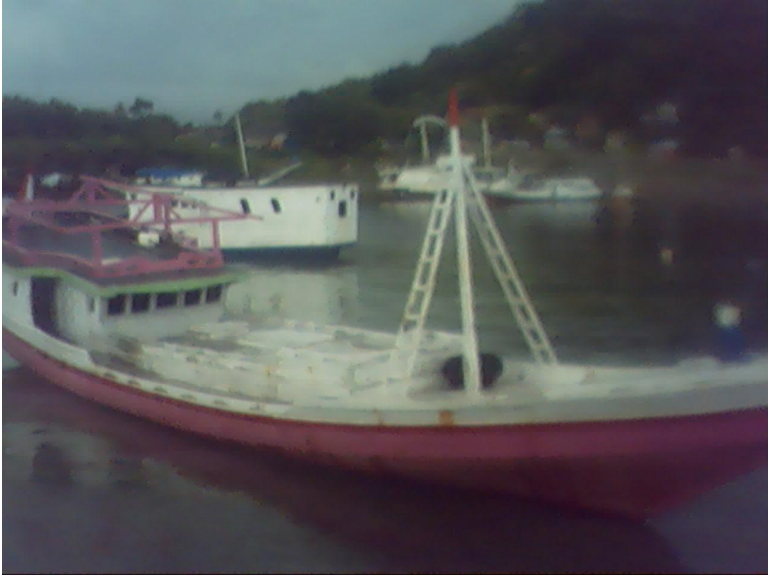
Gambar.2. Gambar sekitar pelabuhan feri Bira.