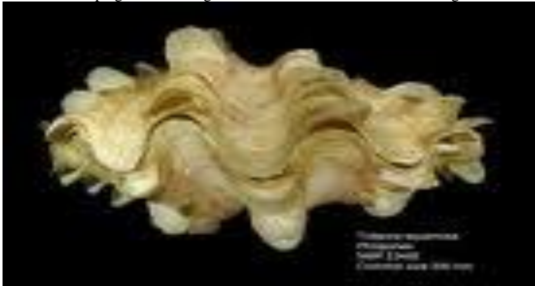
Gambar.1. Kerang kima Tridacna squamosa

Beberapa gambar kerang kima familia Tridacnidae aalah sebagai berikut: