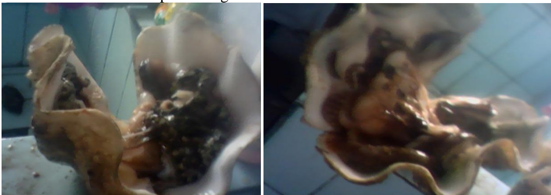
Gambar.4. Gambar sampel kerang familia Tridacnidae