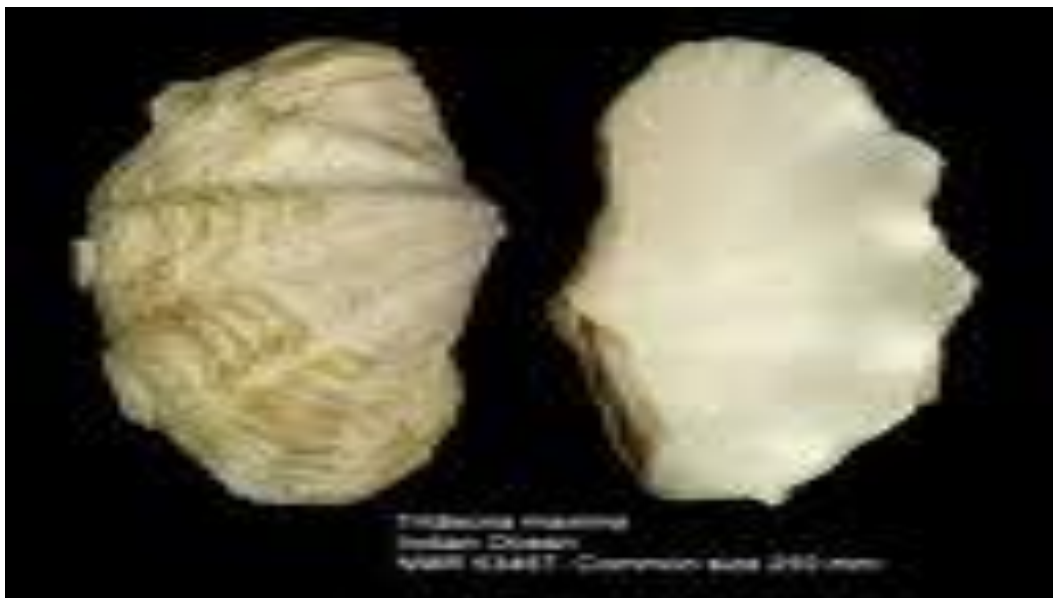
Gambar.4. Kerang kima Tridacna maxima