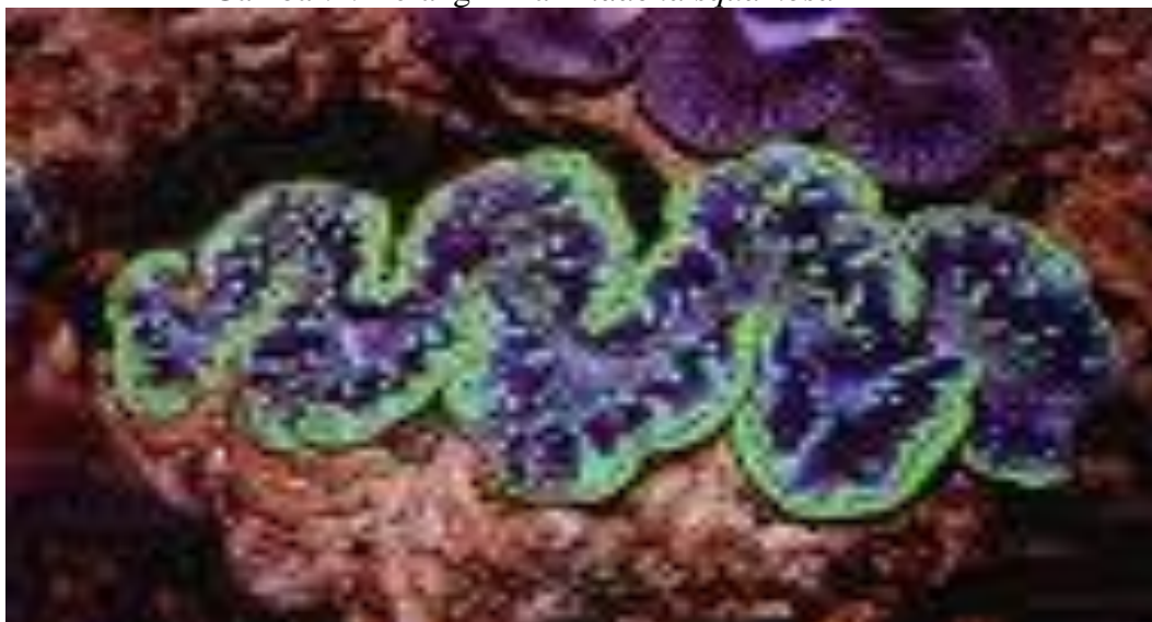
Gambar.2. Kerang kima Tridacna gigas