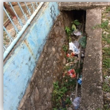
Gambar 4. Jaringan Drainase Kel. Manggala