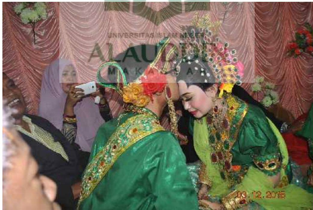
Gambar 6. Prosesi Appabattu Nikka