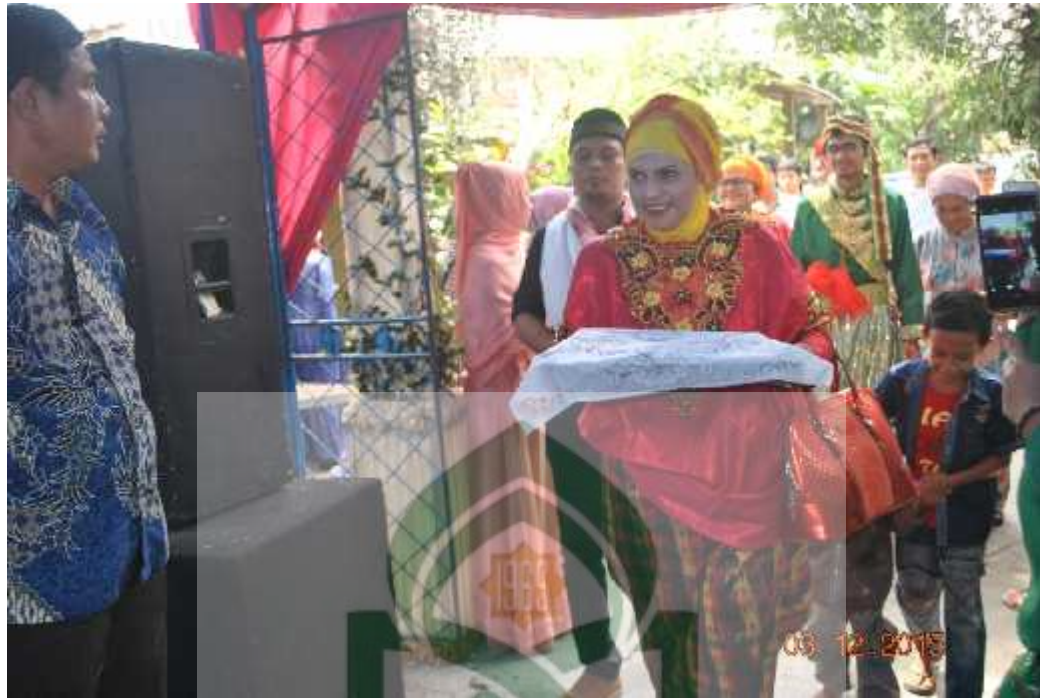
Gambar 5. Prosesi Naikkalenna