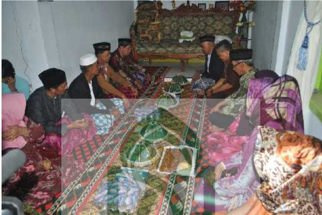
Gambar 1. Prosesi Assuro , Appa'nassa dan Passikko Tau