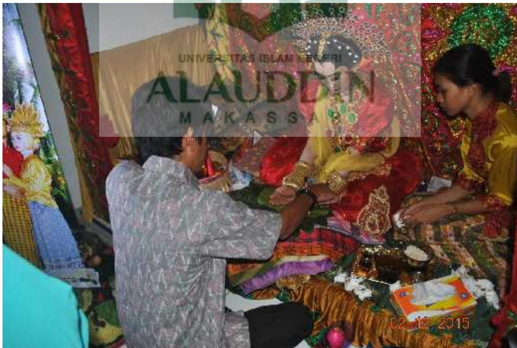
Gambar 4. Prosesi Akkorontigi