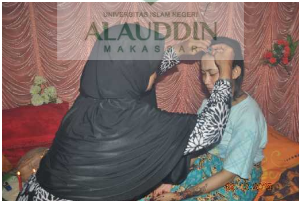
Gambar 2. Prosesi A'bu'bu