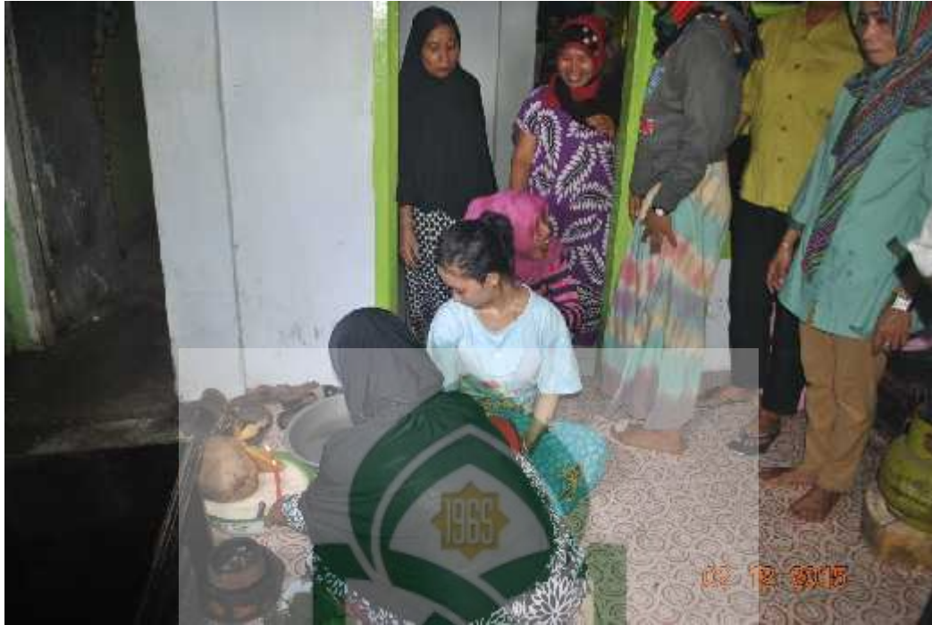
Gambar 3. Prosesi Appassili Bunting