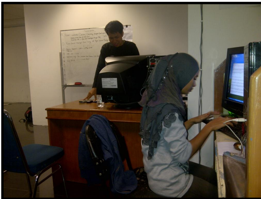
Gambar 4 : Ruang Redaksi Fajar TV