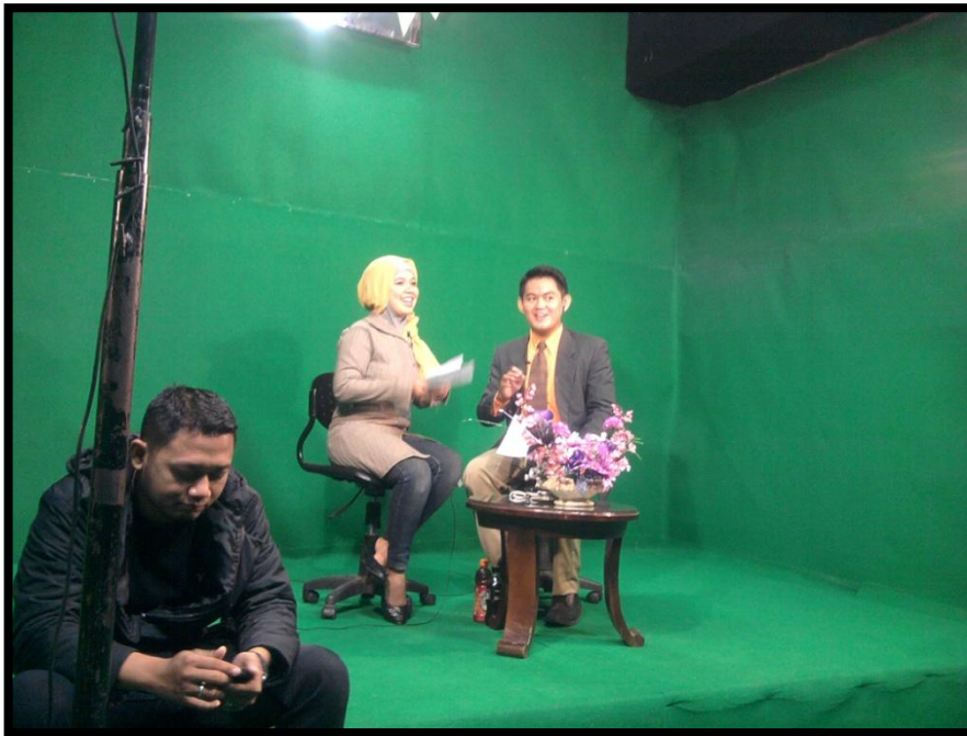
Gambar 5 : Studio produksi Fajar TV