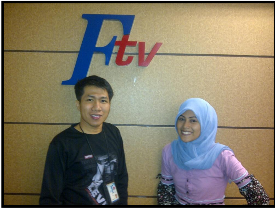
Gambar 1 : foto bersama wartawan fajar