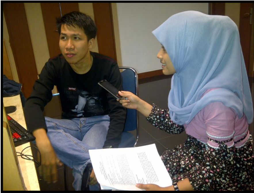
Gambar 3 : foto wawancara narasumber