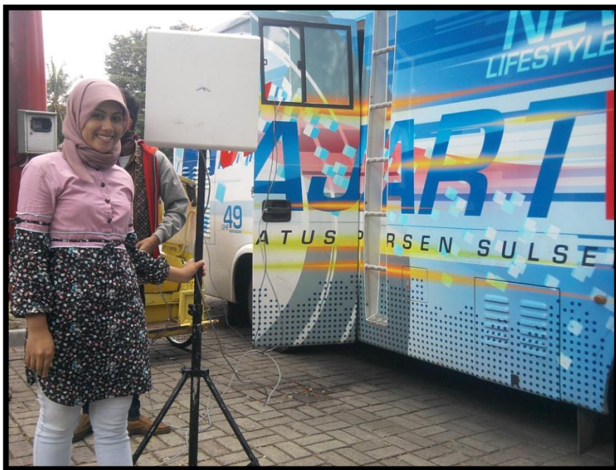
Gambar 2 : Foto pada saat dilapangan peliputan live