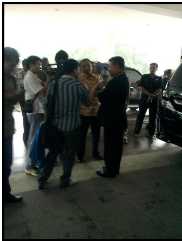
Gambar 6 : kinerja wartawan fajar TV dilapangan