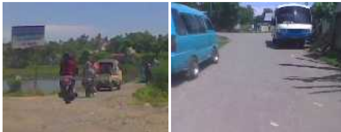
Gambar 10 : prasarana jalan menuju lokasi wisata