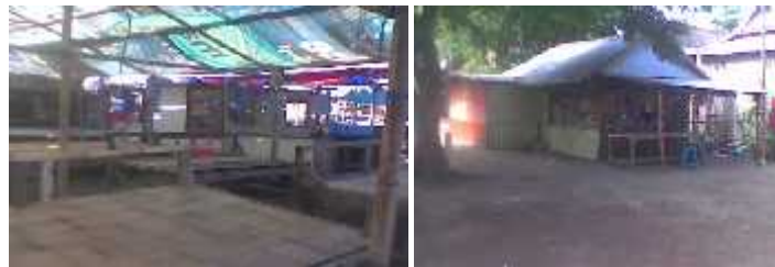
Gambar 8 : sarana penginapan