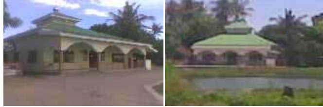
Gambar 6 : sarana pos informasi