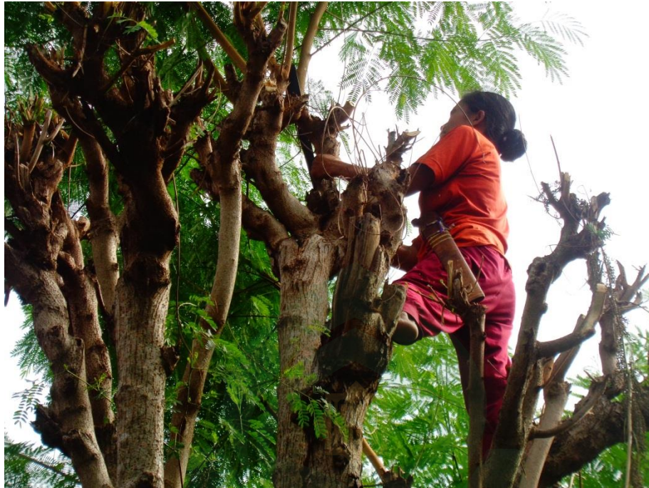
Bentuk sibaliparriq isteri mengambil peran suaminya mengurus ternak