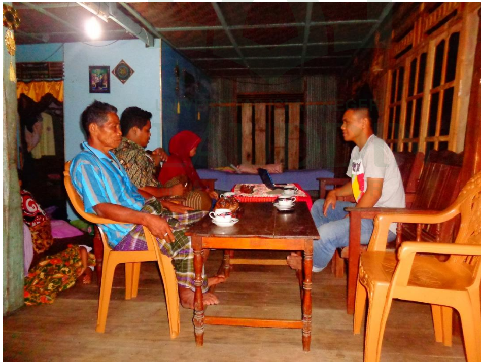
Wawancara dengan masyarakat