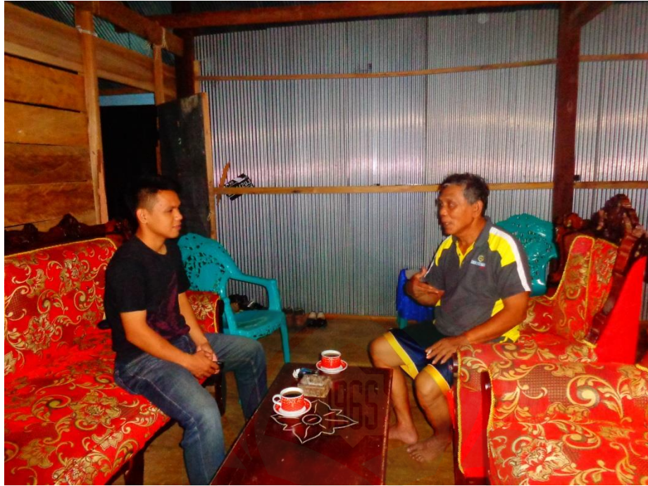
Wawancara dengan masyarakat