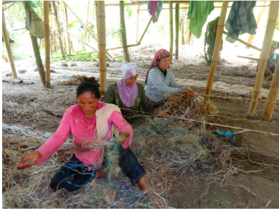
Bentuk sibaliparriq isteri membantu suaminya mencari nafkah dengan bekerja di pemitalan tali