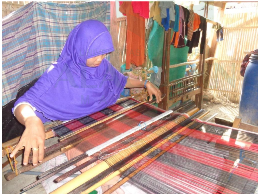
Bentuk sibaliparriq isteri membantu suaminya mencari nafkah dengan menenun kain sutera