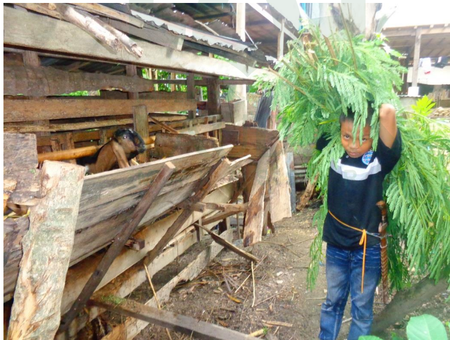
Bentuk sibaliparriq anak membantu orang tuanya mengurus ternak