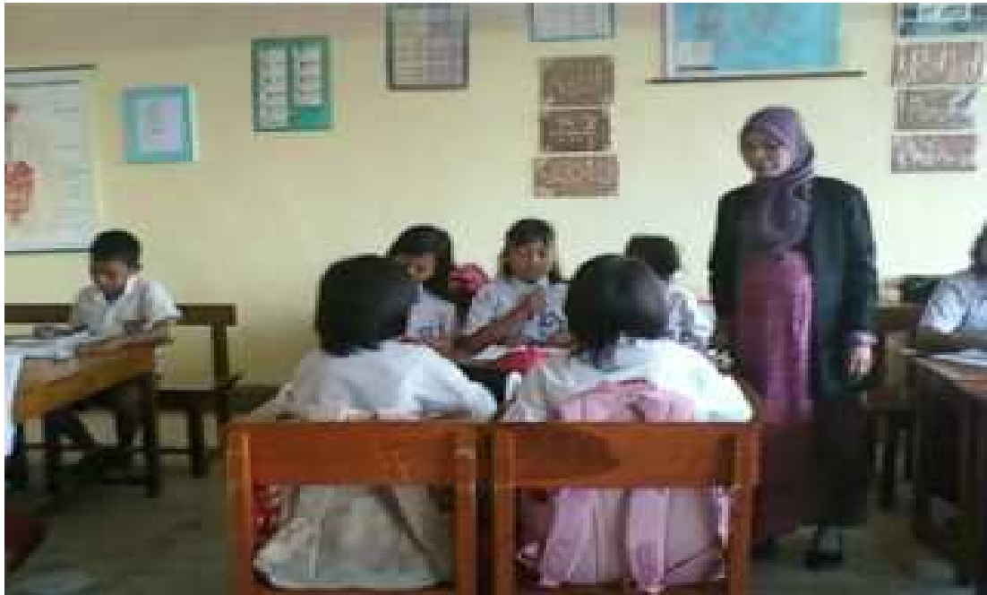
Gambar suasana bentuk kerjasama kelompok-kelompok kecil