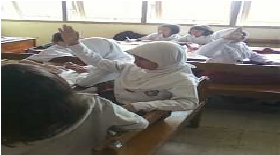
Siswa-siswi sedang mengajukan pertanyaan dan tanggapan