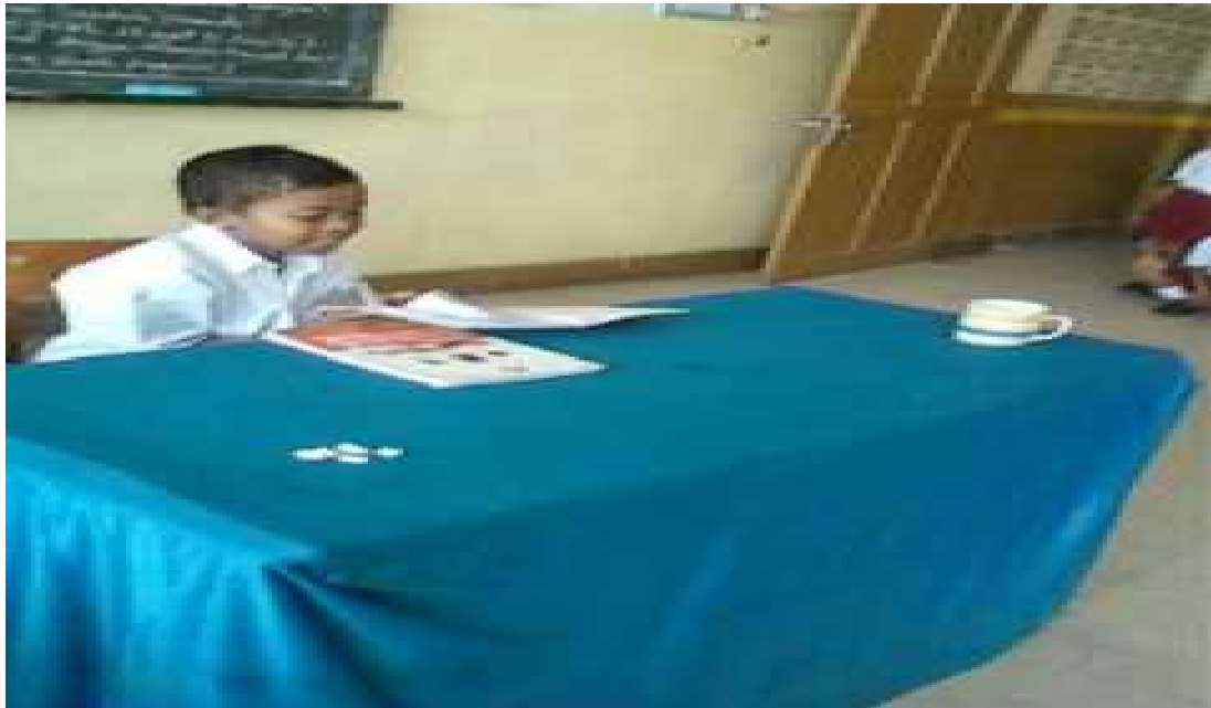
Gambar siswa yang sedang melaporkan hasil kerja sama kelompoknya