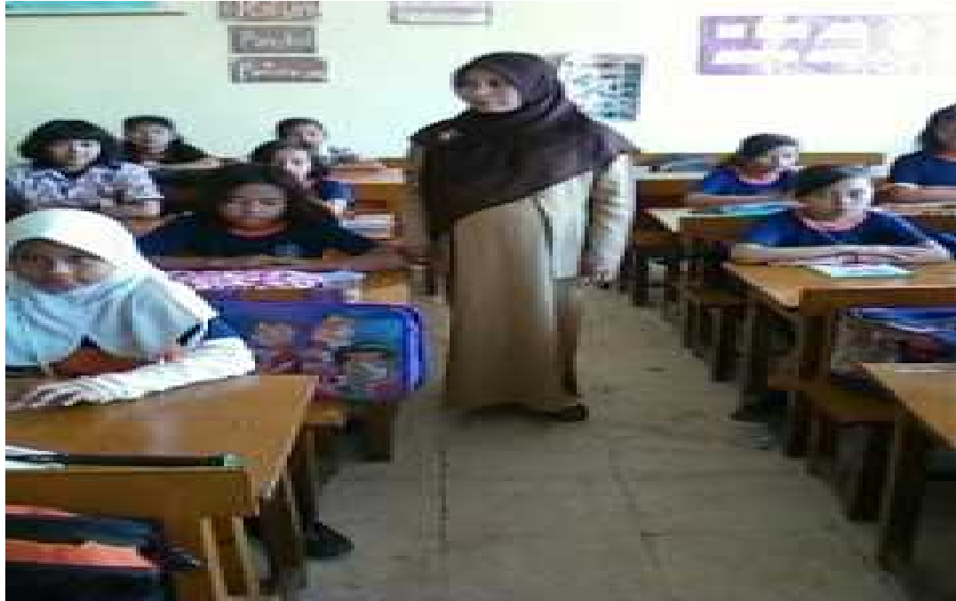
Gambar suasana evaluasi test hasil belajar