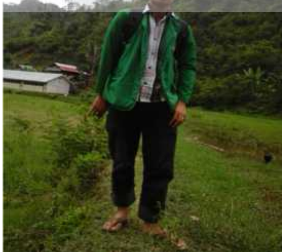
FOTO KETIKA MELANGSUNGKAN PERJALANAN DALAM RANGKA MELAKUKAN PENELITIAN DI DESA SALUMAKA