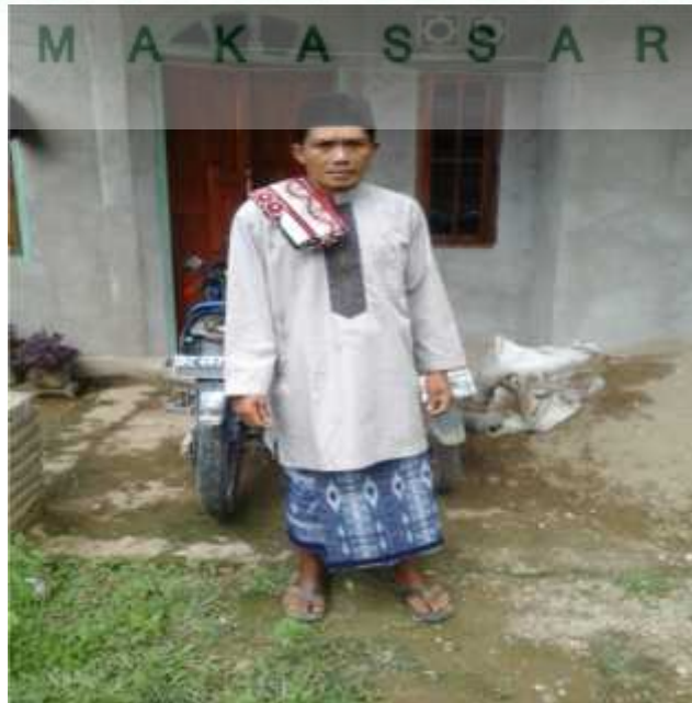
FOTO KEPALA DUSUN BULO DESA SALUMAKA NAHOR