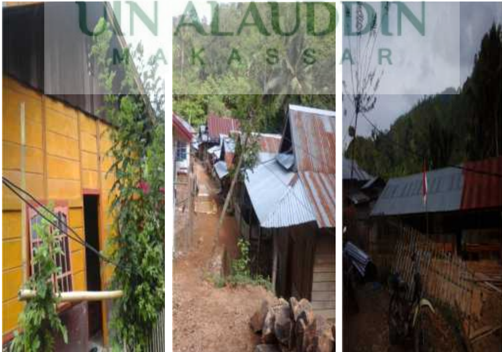
BEBERAPA RUMAH PENDUDUK DI DESA SALUMAKA