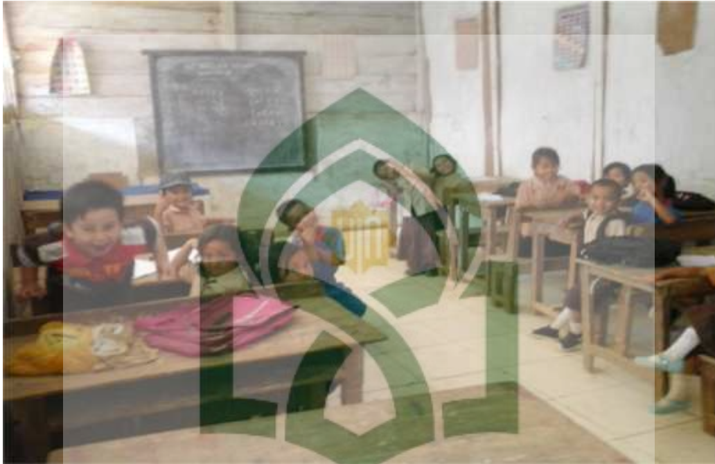
SISWA MADRASAH AL ARIF SALUMAKA SEDANG BELAJAR