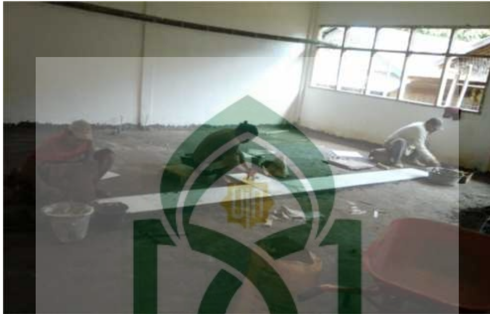
FOTO KEPALA DUSUN GALUNG DI DESA SALUMAKA ATAS NAMA : SALATI SEMENTARA KERJA PERBAIKAN SEKOLAH