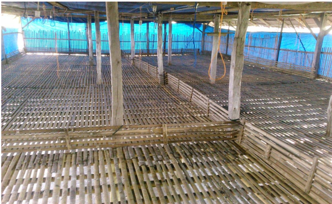
Gambar 12. Setelah Pembersihan Kandang Ayam Broiler