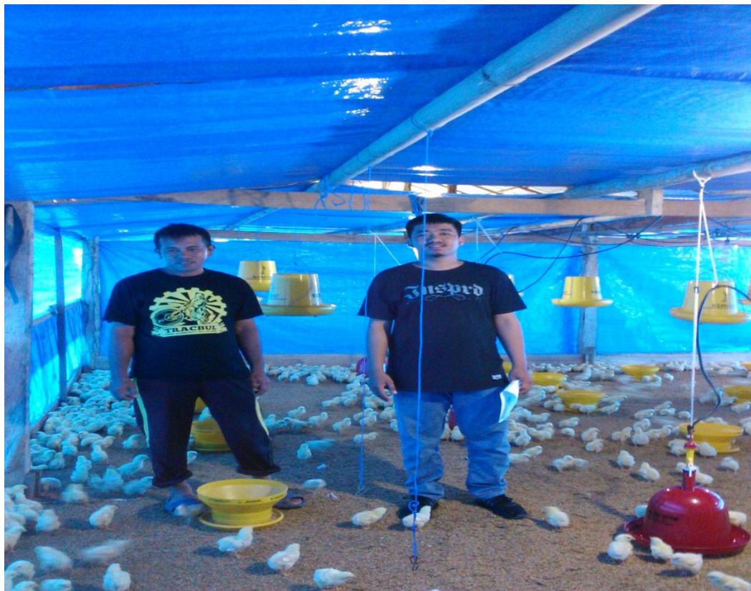
Gambar 7. Foto Bersama Peternak Plasma