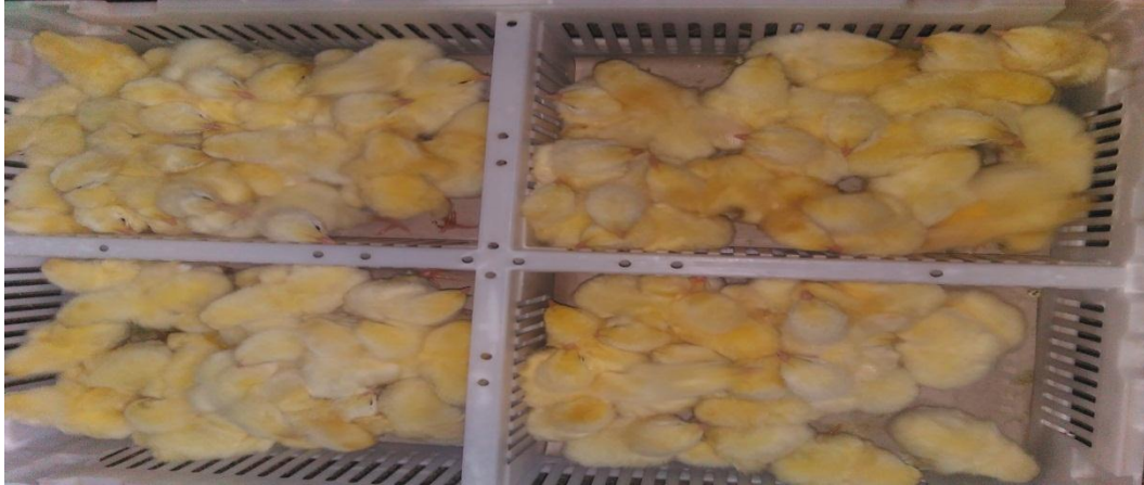
Gambar 1. DOC