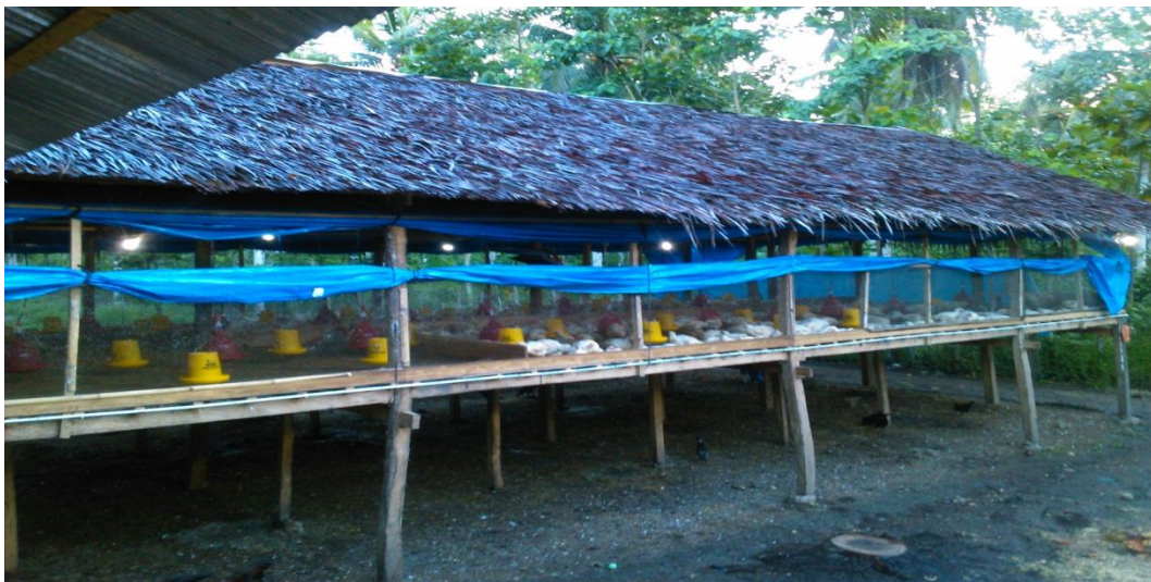
Gambar 9. Model Kandang Populasi 3000