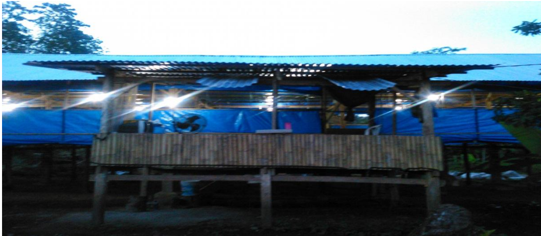
Gambar 8. Model Kandang Populasi 2000