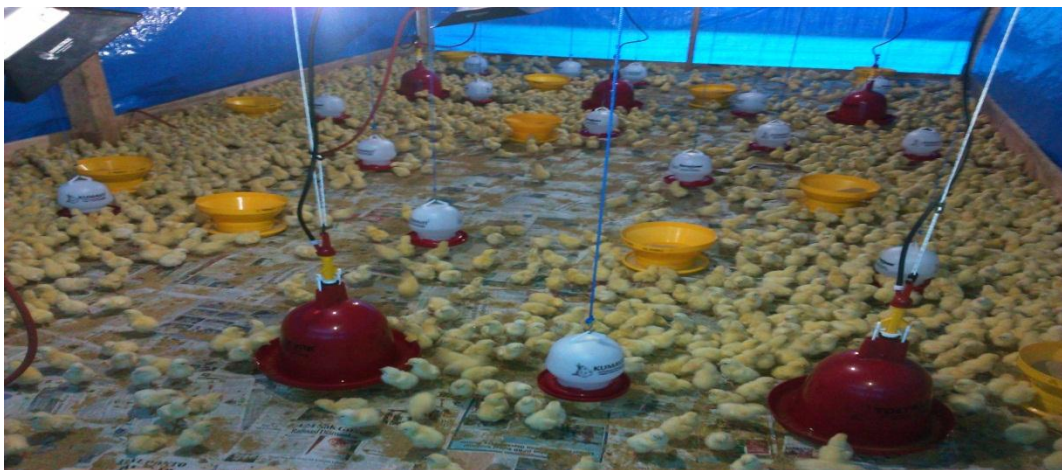
Gambar 2. DOC Umur 4 Hari