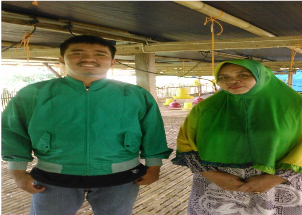
Gambar 4. Foto Bersama Peternak Plasma