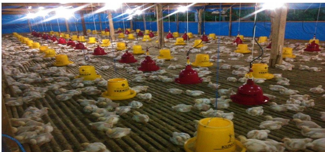
Gambar 3. Ayam Broiler