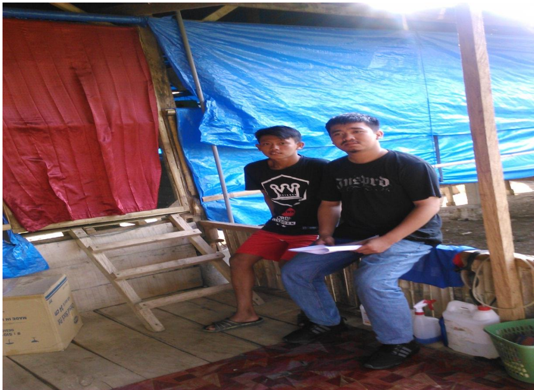
Gambar 6. Foto Bersama Anak Kandang