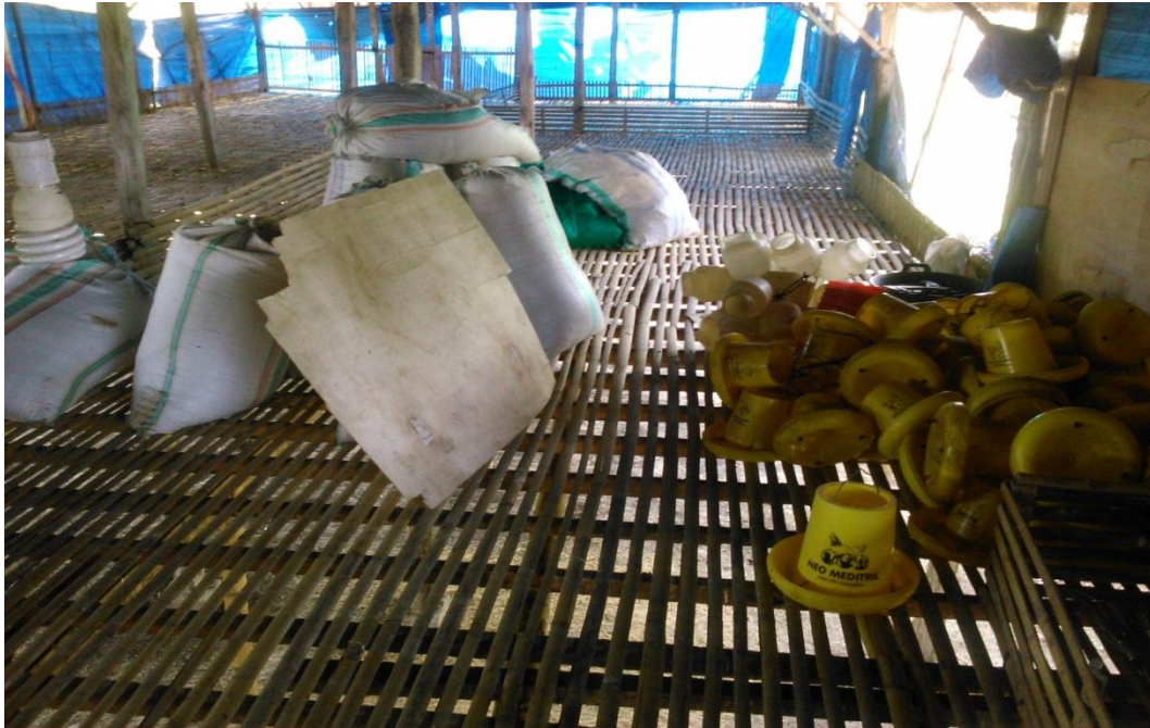
Gambar 11. Pasca Panen Ayam Broiler