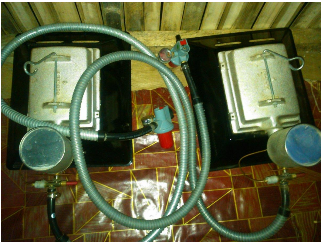
Gambar 14. Pemanas Untuk DOC