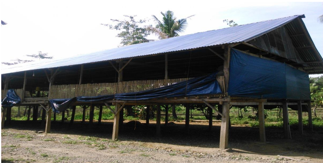
Gambar 10. Model Kandang Populasi 4000