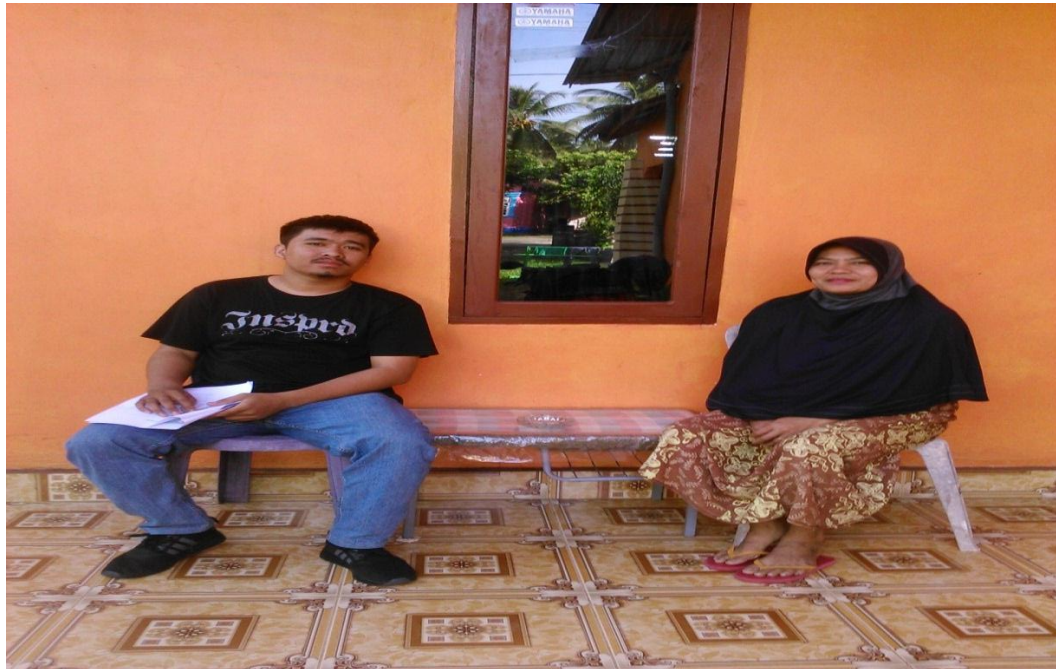
Gambar 5. Foto Bersama Peternak Plasma