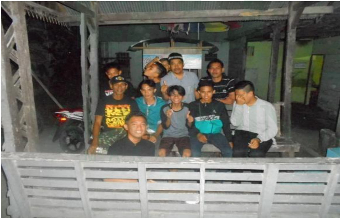
Gambar 4: saat selesainya wawancara Pengambilan photo bersama dengan informan, dan di dampingi beberapa orang tua.