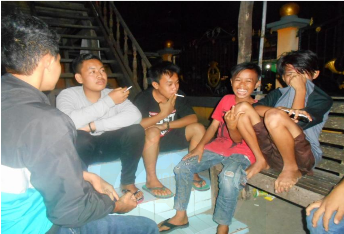
Gambar 5: Berkomunikasi dengan pengguna untuk menggali informasi tentang penyalahgunaan lem fox dari remaja