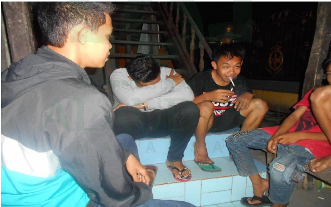
Gambar 2: Proses disaat berkomunikasi salah satu informan sekaligus pemakai narkoba dan lem fox.