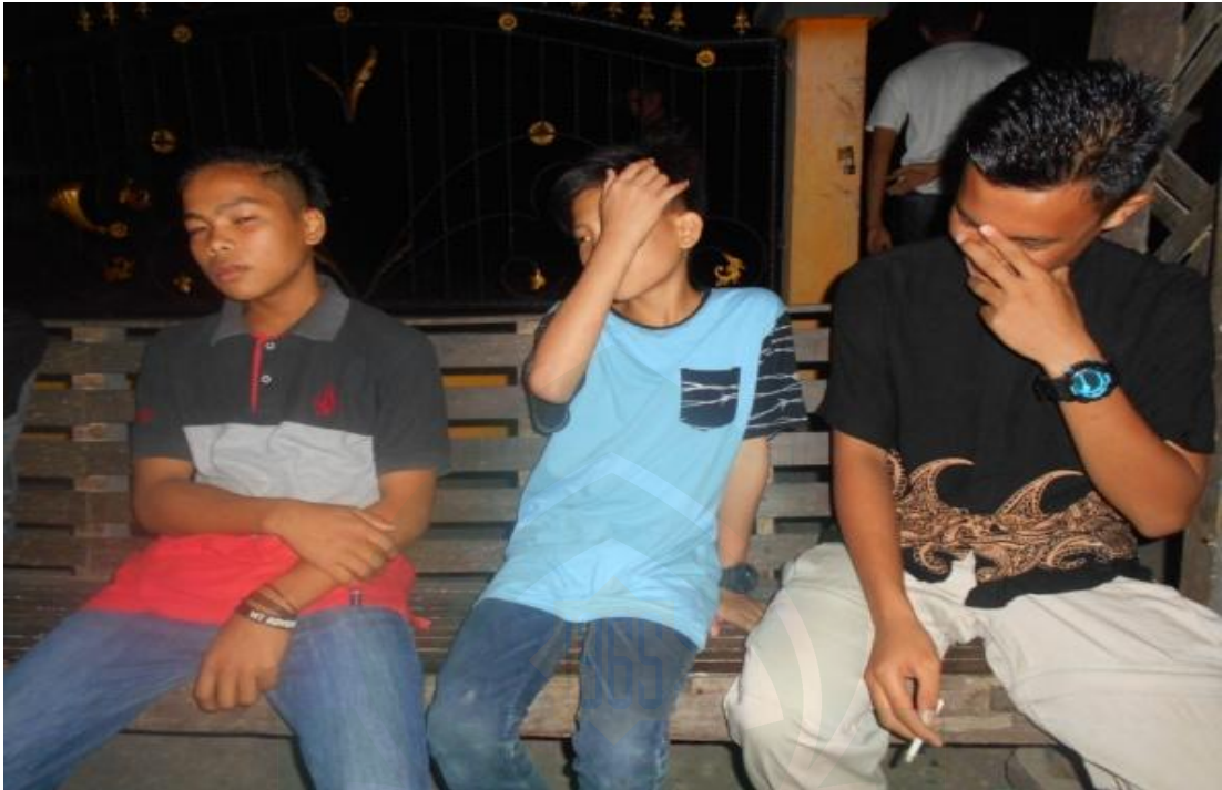
Gambar 3: photo ketiga-tiganya adalah pengguna Lem Fox yang masih duduk di bangku sekolah SMP.