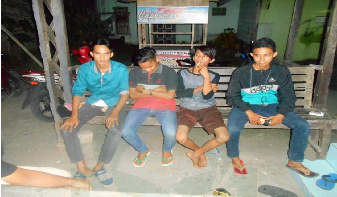
Gambar 1. Proses berlangsungnya wawancara dengan remaja pengguna