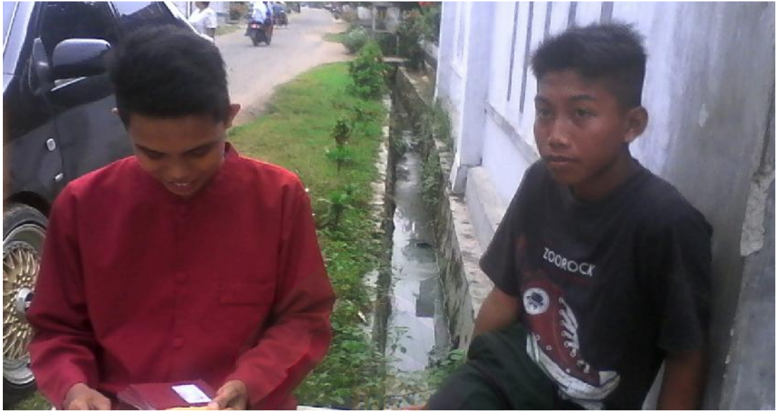
Gambar 7 wawancara dengan mantan penghisap lem fox