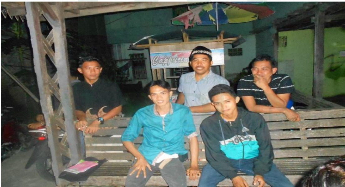
Gambar 6: Pengambilan gambar setelah melakukan wawancara dengan warga sekitar