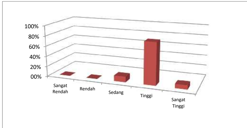
Gambar 2. Diagram Batang Minat Belajar Peserta Didik Kelas VII SMP Negeri Pallanga Setelah Penerapan Pembelajaran Terprogram