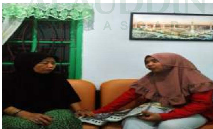
Gambar 7. Wawancara dengan Pelanggan Harian Amanah