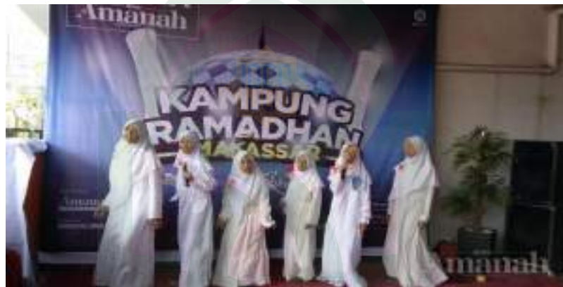
Gambar 4.7 Festival Kurma Harian Amanah

“Salah satu Peluang pemasaran yang dilakukan Harian Amanah adalah dengan menciptakan moment, memanfaatkan Bulan Ramadhan. Dimana kami membuat event yang bisa sekaligus mendapatkan promosi, keuangan, penjualan, dan pemasaran iklan. Dengan begitu Harian Amanah juga berkesempatan bisa dilirik oleh masyarakat dan mampu menarik perhatian pelanggan baru. 13