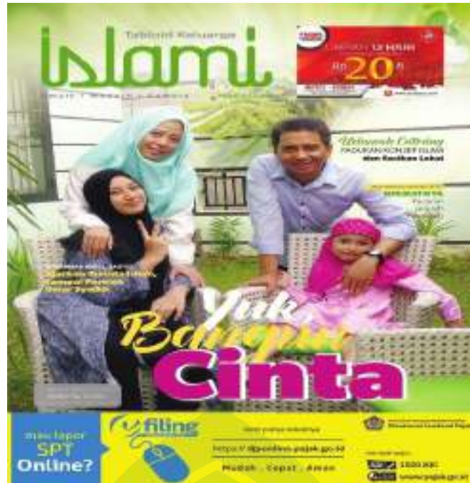
Tabloid Harian Amanah