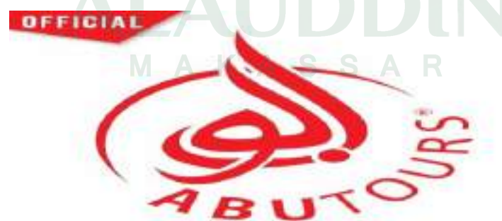
Gambar 4.9 Logo Abu Tours

“Salah satu peluang dari Koran Harian Amanah adalah dengan di backupnya Harian Amanah oleh komunitas Haji dan Umroh oleh Abu Tours. Peluang ini bisa dimanfaatkan dengan banyaknya jamaah Abu Tours. Dengan begitu kita juga bisa memperkenalkan Harian Amanah kepada jamaah dari Abu Tours.