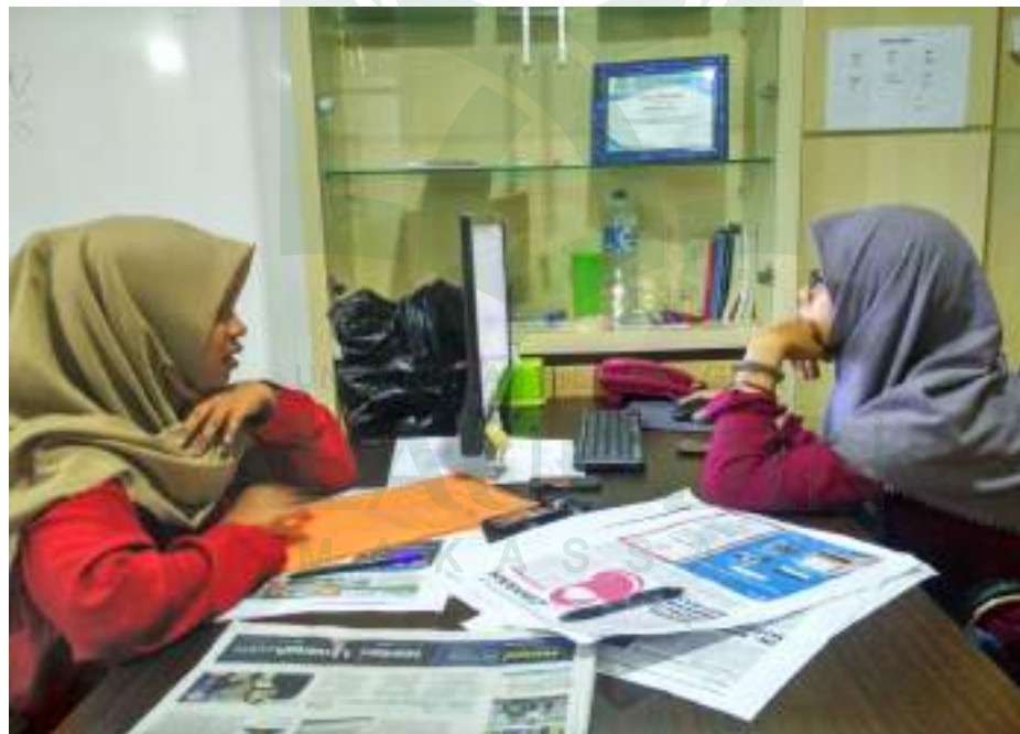
Gambar 4. Wawancara dengan Redaktur Harian Amanah