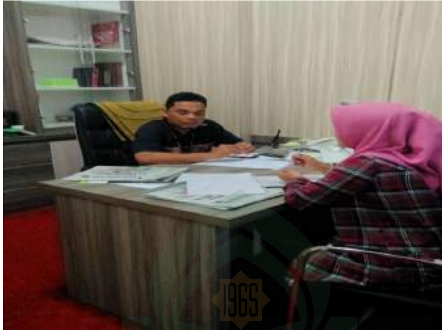
Gambar 1. Wawancara dengan Manager Sirkulasi Harian Amanah