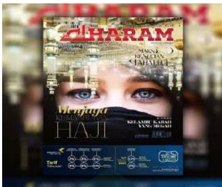
Majalah Al-Haram