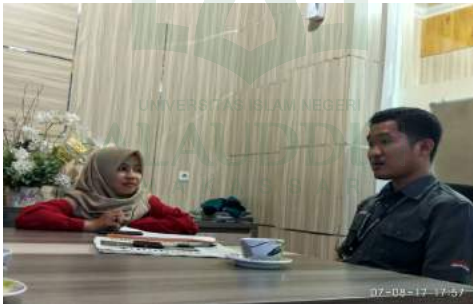
Gambar 2. Wawancara dengan Staf Marketing Harian Amanah