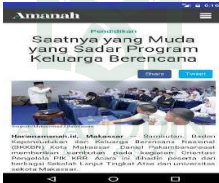
Portal Harian Amanah