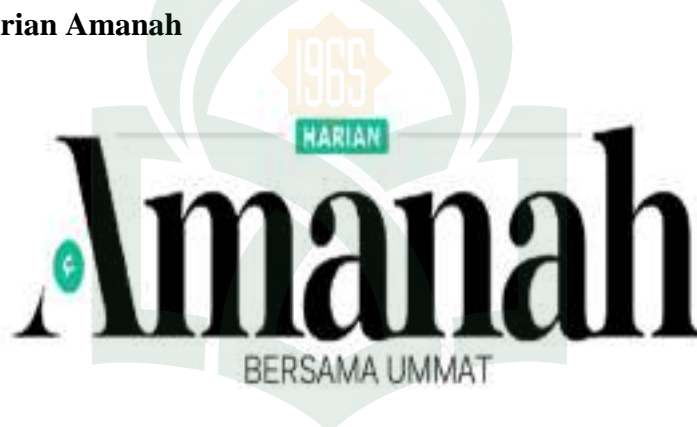
Gambar 4.1 Logo Harian Amanah