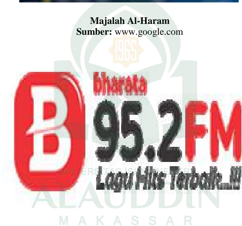
Logo Radio Bharata 95.2 FM