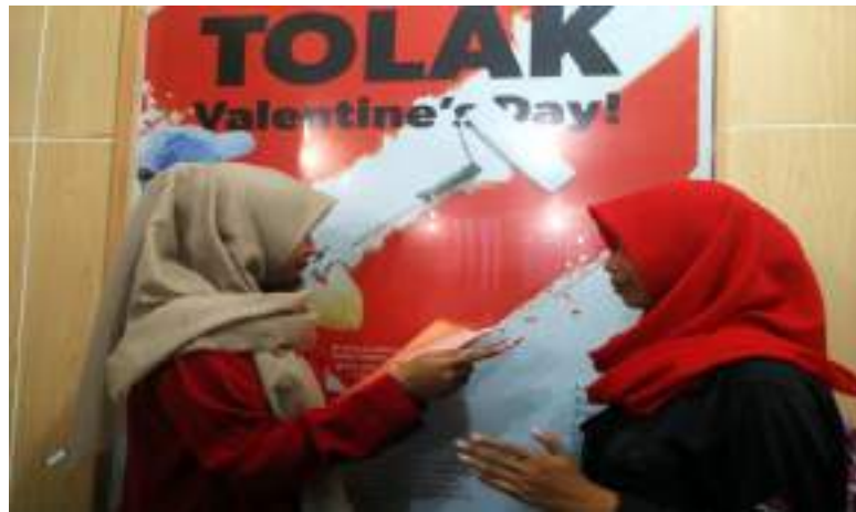
Gambar 5. Wawancara dengan Reporter Harian Amanah