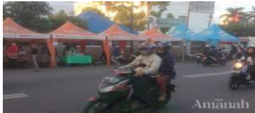
Gambar 4.8 Stand Festival Kurma Harian Amanah

jajanan berat dan terdapat juga stand fashion dimana penjual ol-shop dan penjual yang biasa stand ditempat swalayan ikut bergabung sepanjang depan kantor Koran Harian Amanah.