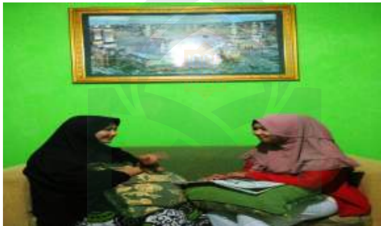
Gambar 6. Wawancara dengan Pelanggan Harian Amanah