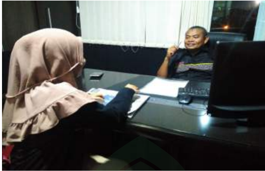
Gambar 3. Wawancara dengan Pimpinan Redaksi Harian Amanah