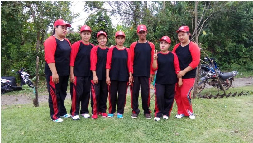
Salah Satu Tim Perlombaan Senam Maumere Desa Bilalang