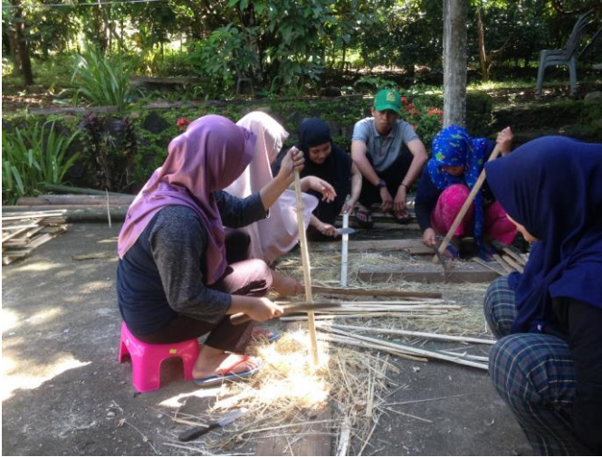
Kegiatan Lorong Indah