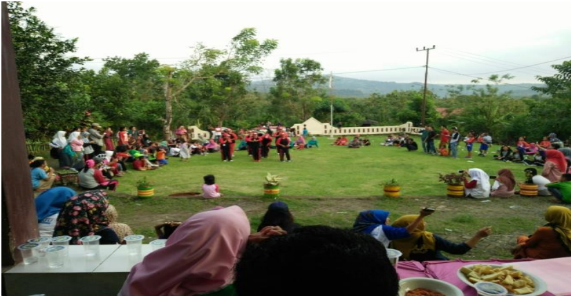
Kegiatan Perlombaan Senam Maumere se-Desa Bilalang