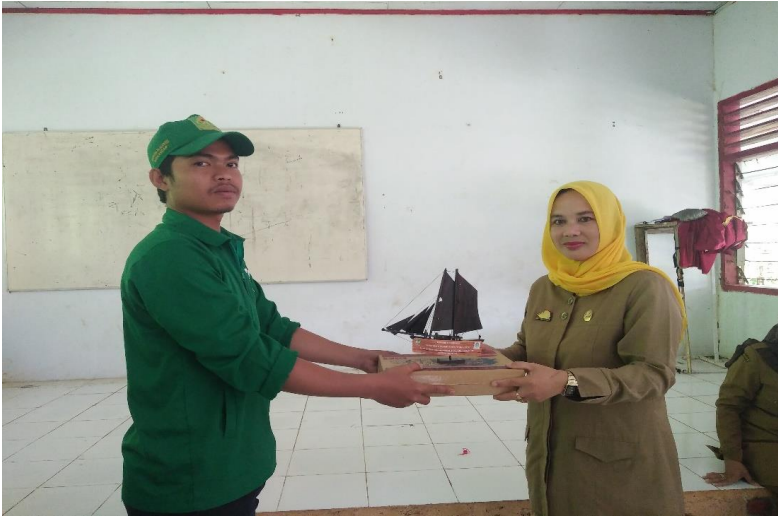
Kegiatan Wisuda Santri TK/TPA se-Kecamatan Manuju