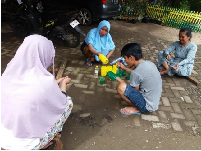
Kegiatan Lorong Indah