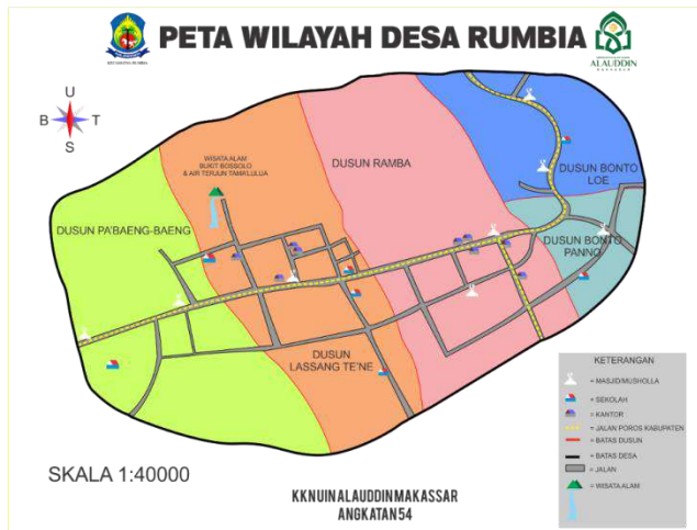
Gambar 1.1 Peta Wilayah Desa Rumbia