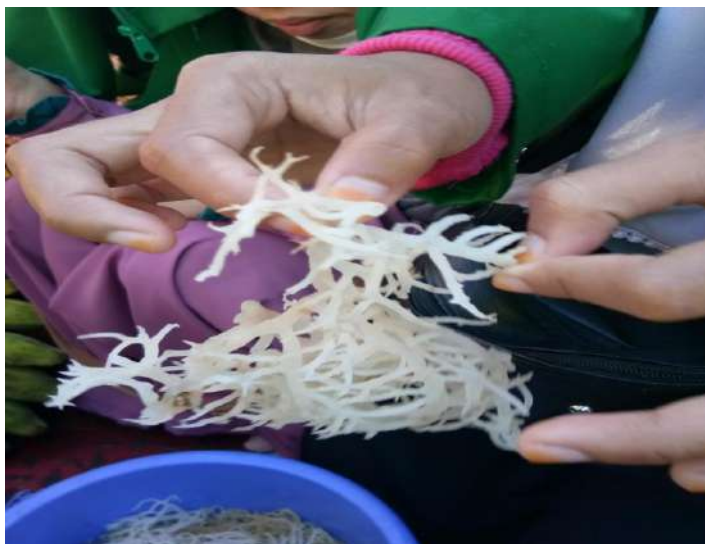
Membantu warga membersihkan rumput laut