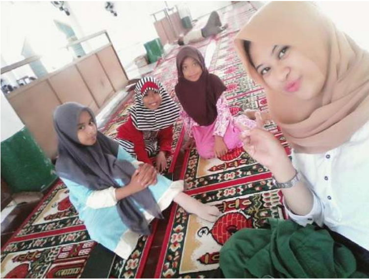
Latihan Hafalan Do'a Seahari-Hari