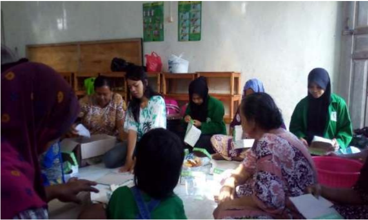
Membantu Warga dalam Memperingati Isra' Mi'raj Nabi Muhammad SAW.