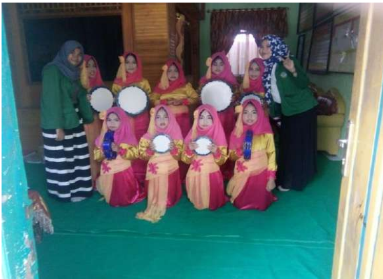
Grup Qasidah Desa Pitusunggu