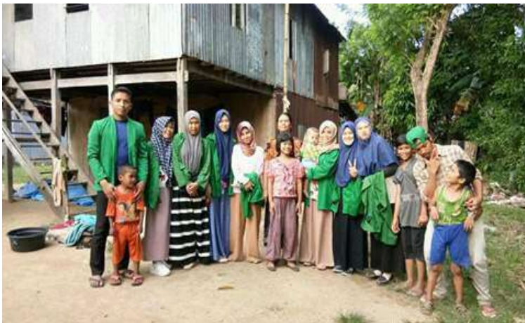
Silaturahmi dengan warga Dusun Bontosunggu