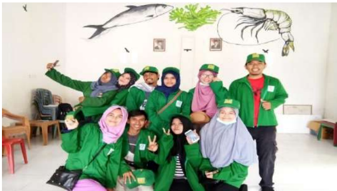
Mahasiswa KKN UINAM ANG. 55 Desa Pitusunggu Kec. Ma'rang