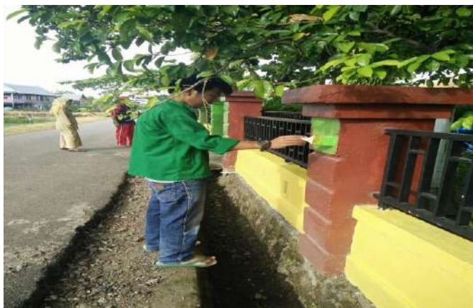
Pengecetan Pagar Sekolah