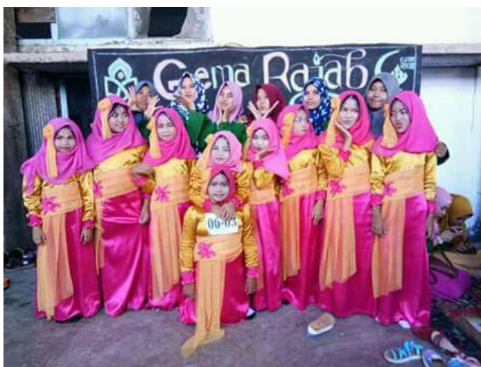
Foto Bersama grup Qasidah Desa Pitunggu