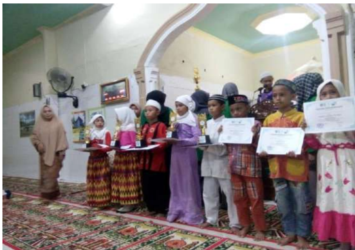
Pembagian hadiah kepada Peserta Fasih Oleh Kepala Desa Pitusunggu