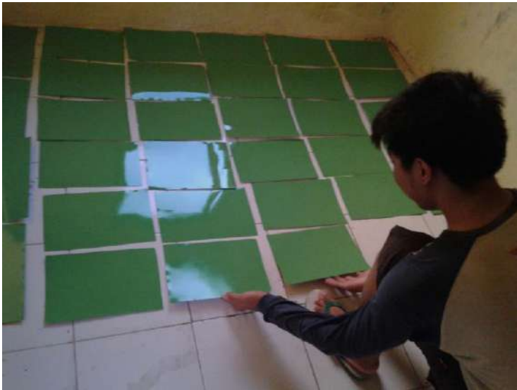
Pembuatan Nomor Rumah Warga