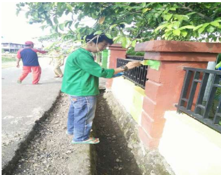
Pengecatan Pagar SD Negeri 21 Jennae