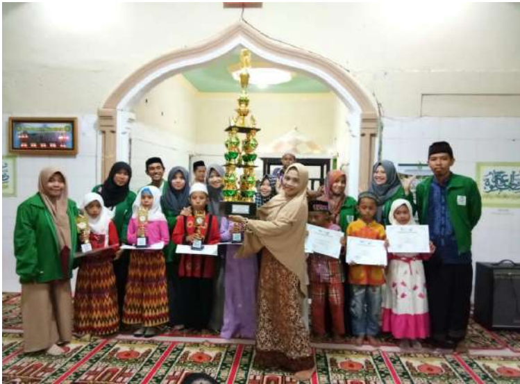
Penyerahan Piala Bergilir dalam Memperingati Isra' Mi'raj Nabi Muhammad SAW kepada Kepala Desa Pitusunggu