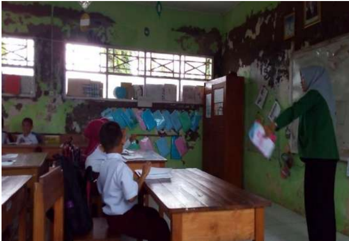
Kegiatan Belajar Mengajar di SD Negeri 17 Bontosunggu