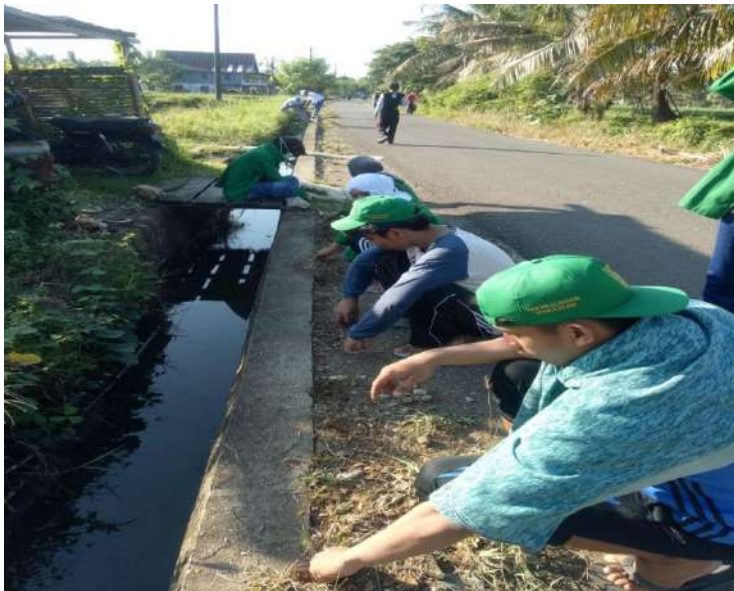
Kegiatan Bakti Sosial di Desa Pitusunggu