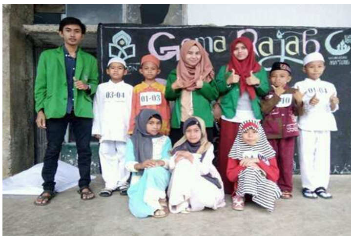
Foto Bersama Peserta FASIH