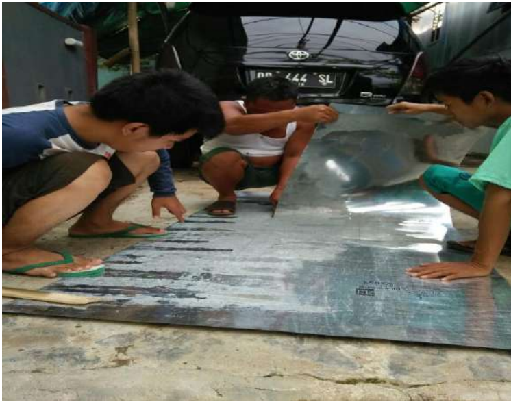
Pembuatan Nomor Rumah