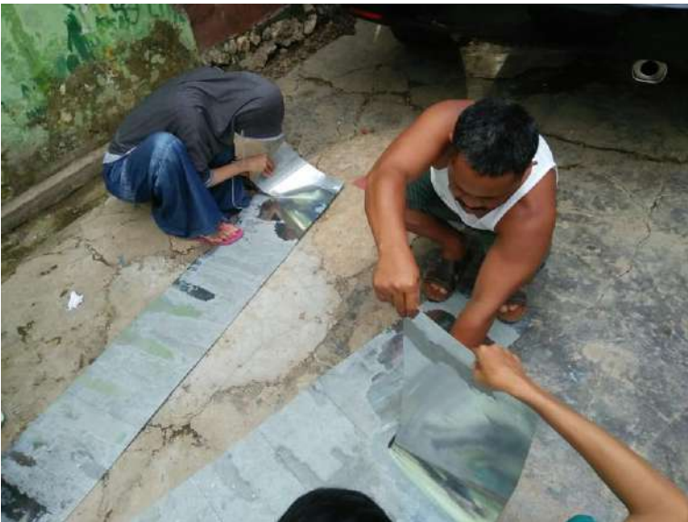
Pembuatan Nomor Rumah Warga