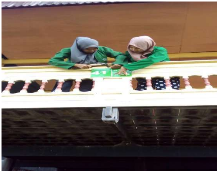
Pemasangan Nomor Rumah Warga Dusun Pungkalawaki