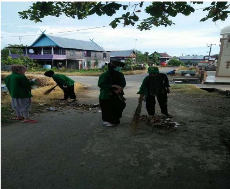
Bakti Sosial di Dusun Pungkalawaki