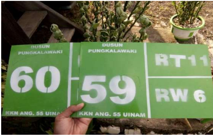
Format Penomoran Rumah Warga