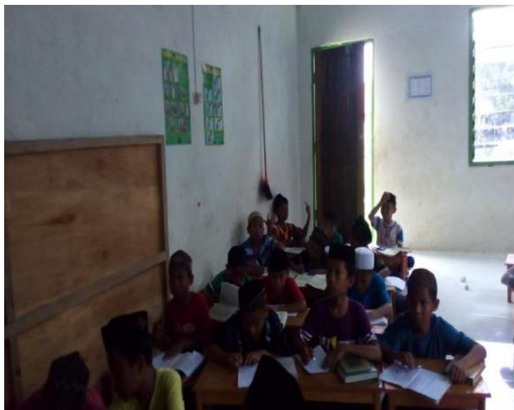
Kegiatan Mengajar di TPA Bawa Pitu