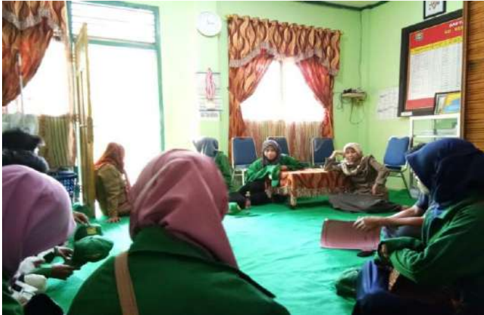
Survey di SDN 17 Bontosunggu