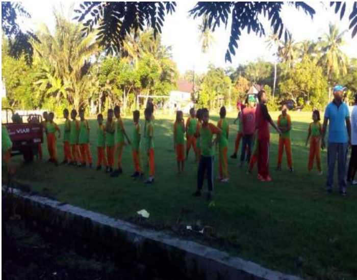
Kegiatan Senam Sehat di Kantor Desa Pitusunggu