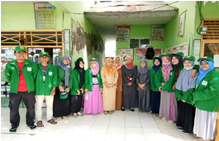
Survey di SDN 21 Jennae