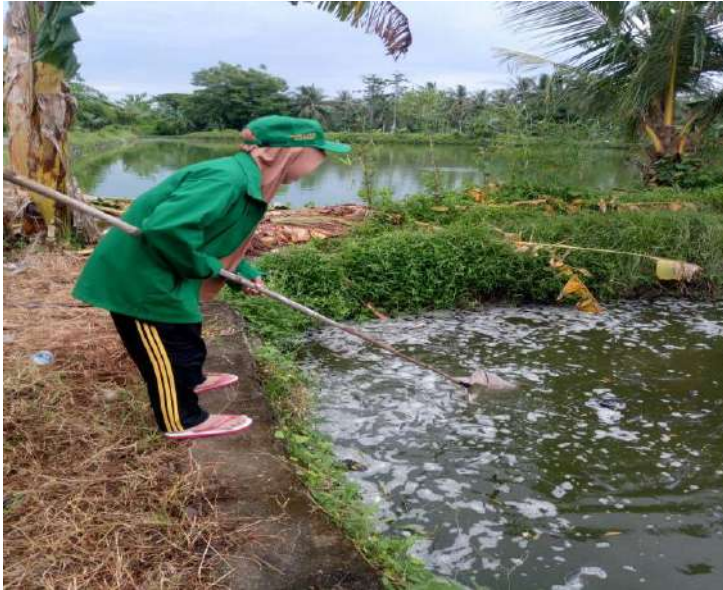
Membantu menangkap Ikan Bolu