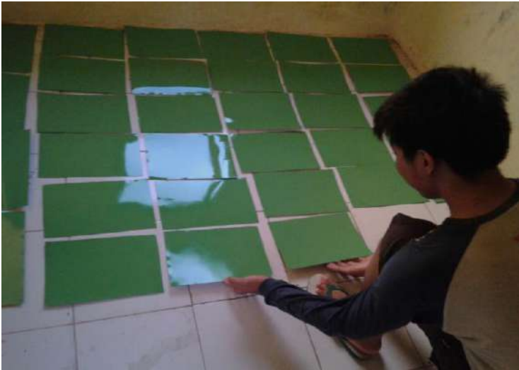
Persiapan bahan dalam pembuatan Nomor Rumah Warga