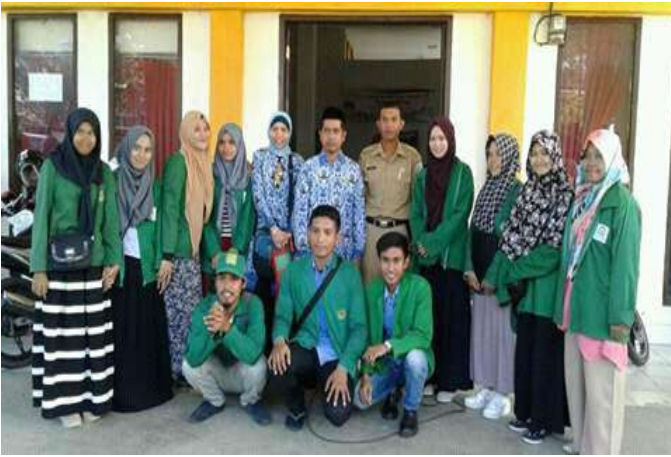
Foto Bersama Dosen Pembimbing dan Staf di Kantor Camat Ma'rang saat penarikan