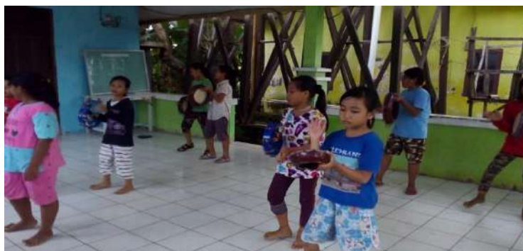
Latihan Qasidah Persiapan Fasih