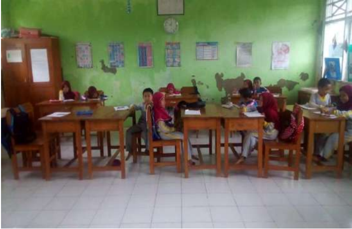
Kegiatan Belajar Mengajar di SD Negeri 21 Jennae