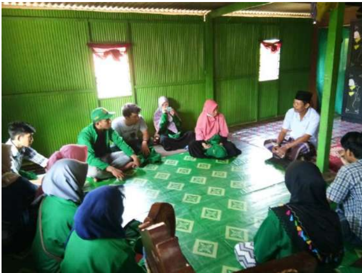
Survey Lokasi Dusun Bontosunggu