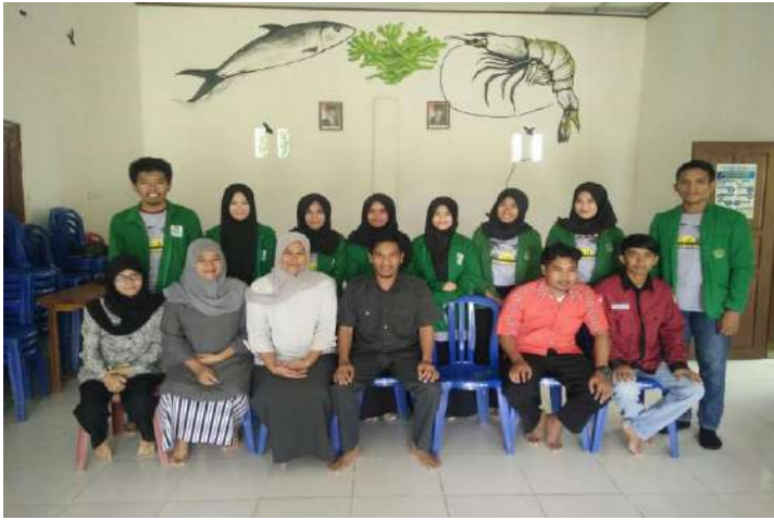
Foto bersama Staf Desa Pitusunggu