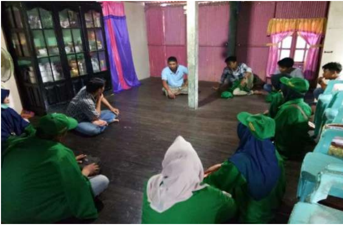
Survey lokasi Dusun Pungkalawaki