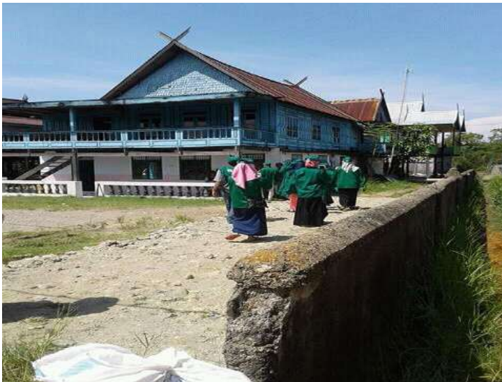
Survey hari pertama di lokasi KKN