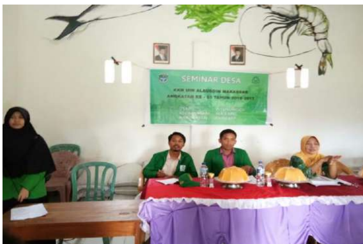
Pelaksanaan Seminar Desa