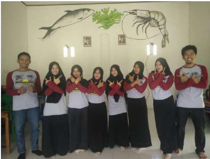
Mahasiswa KKN UINAM ANG. 55 Desa Pitusunggu