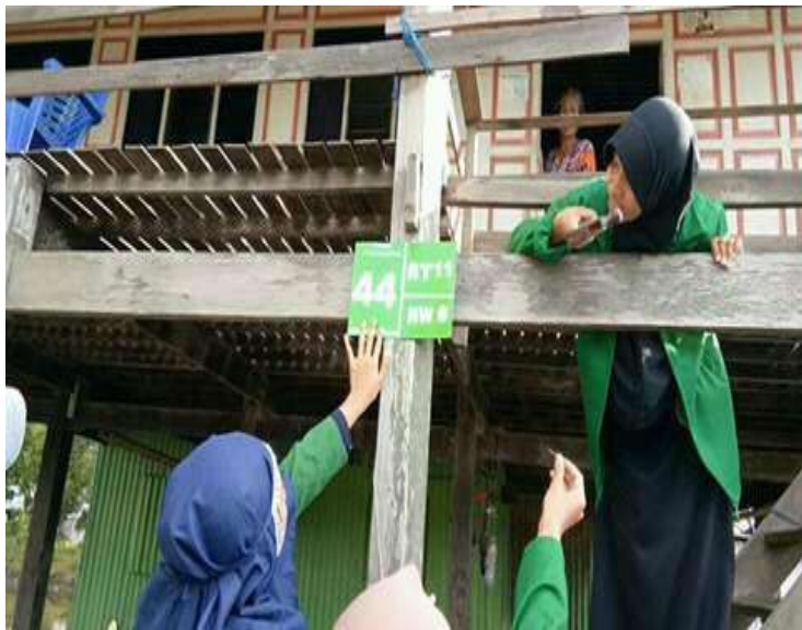
Pemasangan Nomor Rumah Warga