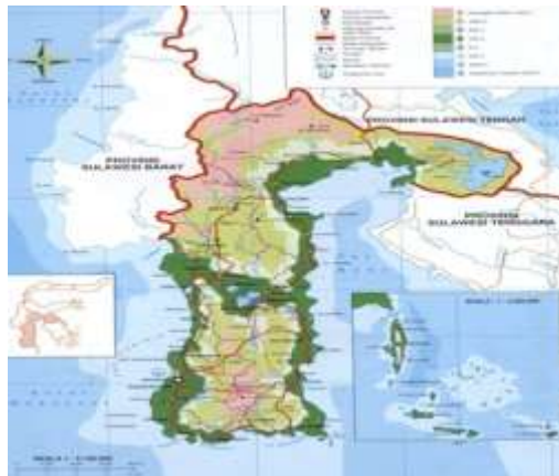
Posisi Kabupaten Gowa pada Peta Sulawesi Selatan

Data Badan Pusat Statistik Kabupaten Gowa Tahun 2013 menunjukkan bahwa, Kabupaten Gowa sebagai lokasi atau latar diadakannya penelitian ini berada pada 119.3773^{\circ} Bujur Barat dan 120.0317^{\circ} Bujur Timur. 5.0829342862^{\circ} Lintang Utara dan 5.577305437^{\circ} Lintang Selatan. Kabupaten yang berada di daerah selatan dari Sulawesi Selatan merupakan daerah otonom yang berbatasan wilayah sebelah Utara berbatasan Kota Makassar dan Kabupaten Maros. Di sebelah Timur berbatasan dengan Kabupaten Sinjai, Bulukumba, dan Bantaeng. Pada bagian selatan, Kabupaten Gowa berbatasan dengan Kabupaten Takalar dan Jeneponto, sedangkan di bagian Barat berbatasan dengan Kota Makassar dan Takalar.