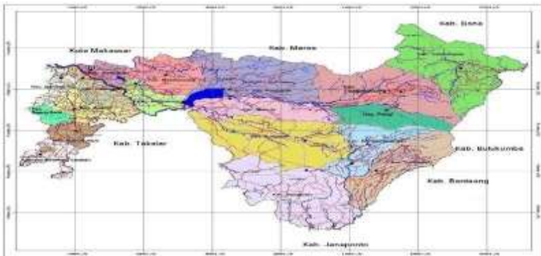
Peta Wilayah Kabupaten Gowa

Wilayah administrasi Kabupaten Gowa terdiri dari 18 kecamatan dan 167 desa/kelurahan dengan luas sekitar 1.883,33 kilometer persegi atau setara dengan 3,01 persen dari luas wilayah Propinsi Sulawesi Selatan. Wilayah Kabupaten Gowa sebagian besar merupakan dataran tinggi yaitu sekitar 72,26 persen.