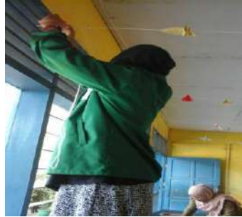
✓ Kerajinan Tangan PKK