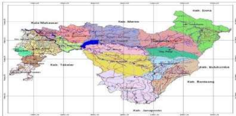
Peta Wilayah Kabupaten Gowa

Wilayah administrasi Kabupaten Gowa terdiri dari 18 kecamatan dan 167 desa/kelurahan dengan luas sekitar 1.883,33 kilometer persegi atau setara dengan 3,01 persen dari luas wilayah Propinsi Sulawesi Selatan. Wilayah Kabupaten Gowa sebagian besar merupakan dataran tinggi yaitu sekitar 72,26 persen.