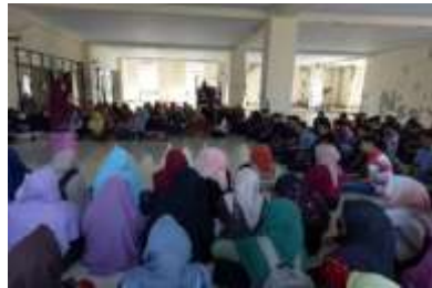
- Penerimaan di kantor Kecamatan Parangloe