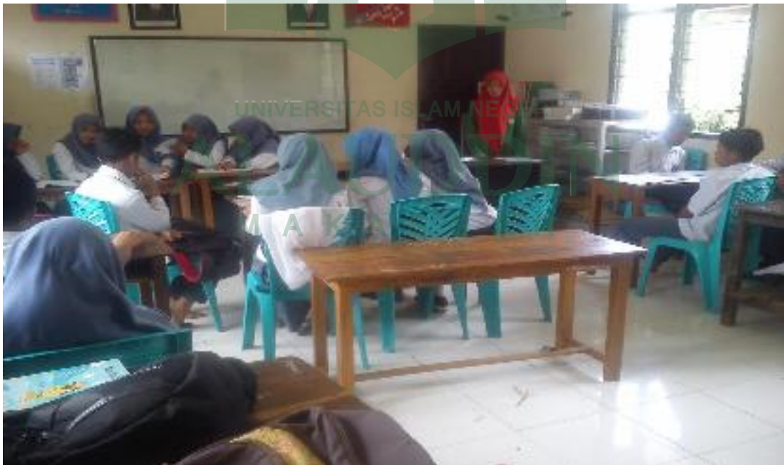
Observasi proses Pembelajaran Akidah Akhlak di Madrasah Aliyah Kaduaja