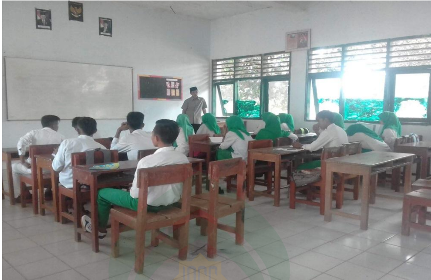
Kegiatan Do'a bersama (Istighosah)