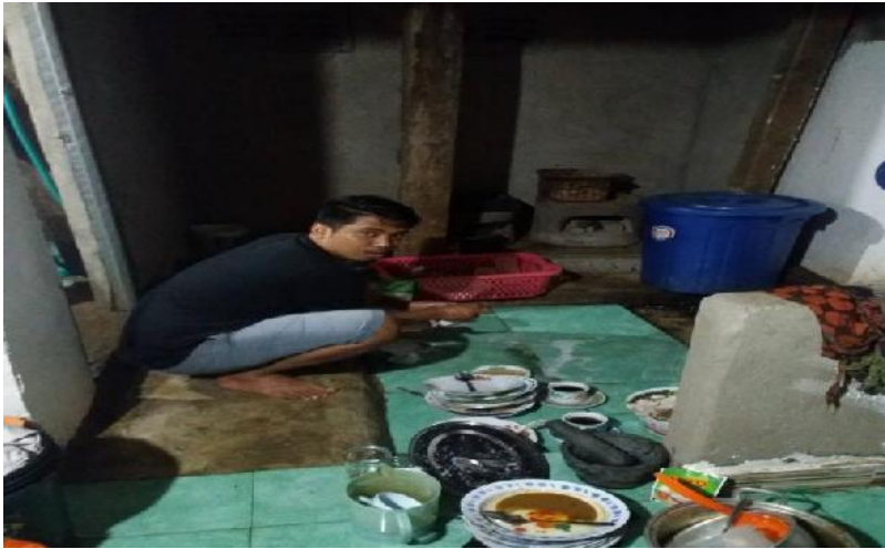
Masak-masak By Putra Posko