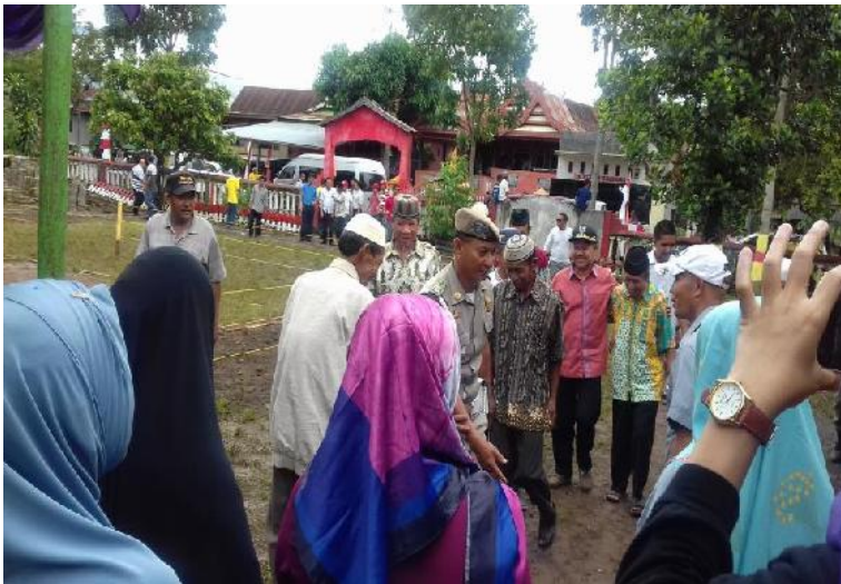
Pembukaan Sepak Takrow Se-Kec. Rumbia di