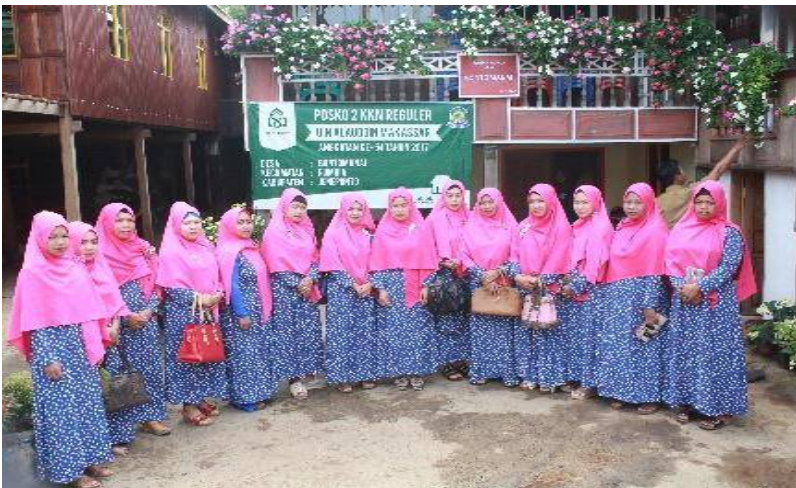
Photo Bersama Aparat Desa & Majelis Ta'lim Desa Bontomanan