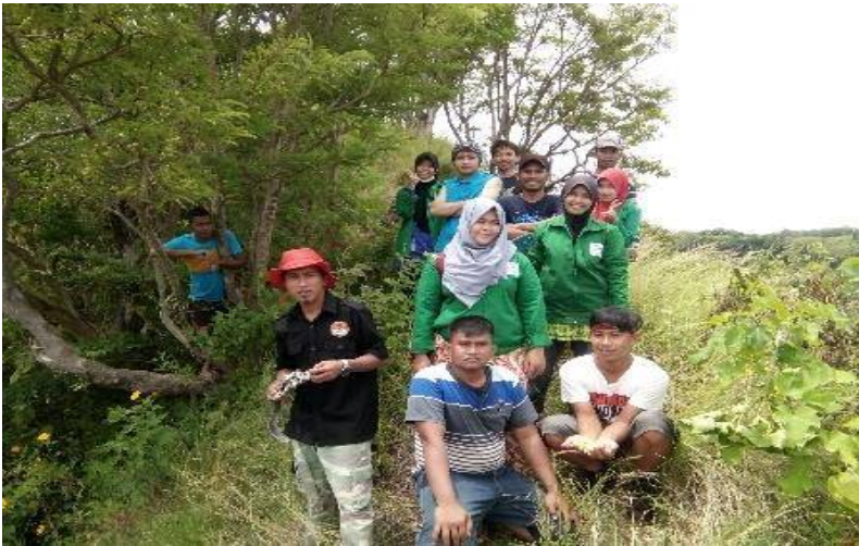
Pembersihan Objek Wisata Alam