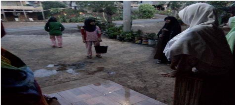
Pembersihan Kantor Desa Bontomanai