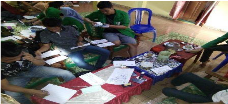
Persiapan Seminar Kecamatan Rumbia