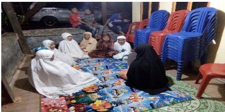
Observasi Santri TPA