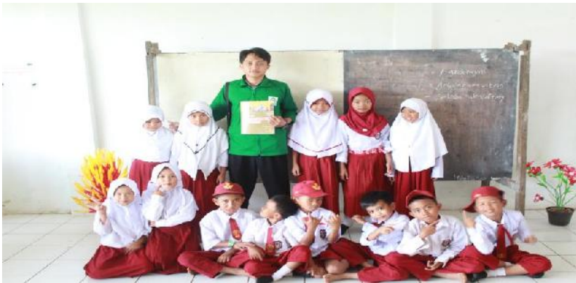
Photo Bersama Siswa SD Pattiro