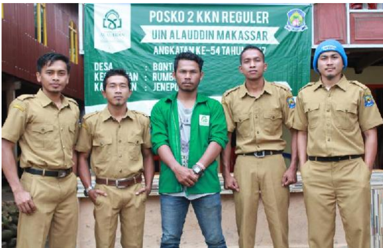
Photo Bersama Siswa Aparat Desa