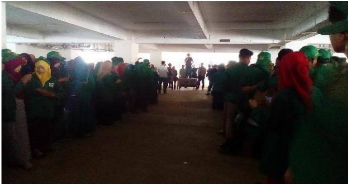
Pelepasan KKN Pukul 09:00