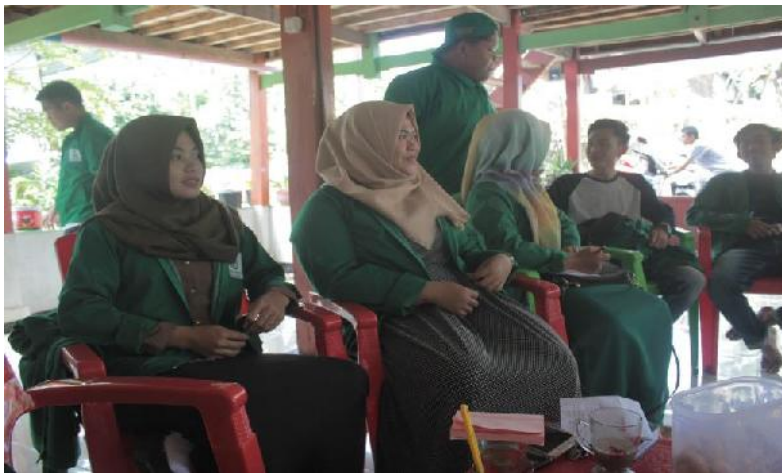
Rapat Koordinasi Terakhir Kecamatan dan Posko