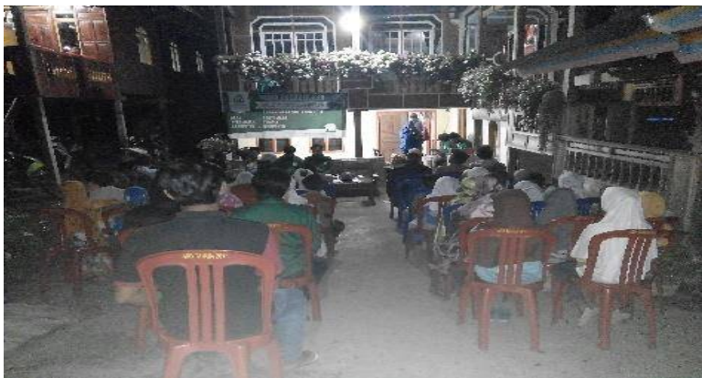
Pembagian Kado di Mala Ramah Tamah