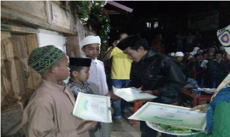
Malam Ramah Tamah Desa