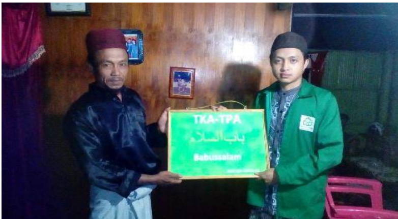
Penyerahan Papan Nama TKA-TPA