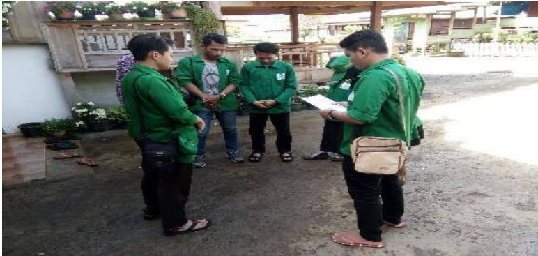
Pendataan Masjid se-Desa Bontomanai