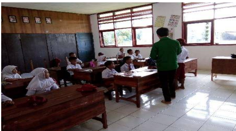
Mengajar di SD Pattiro