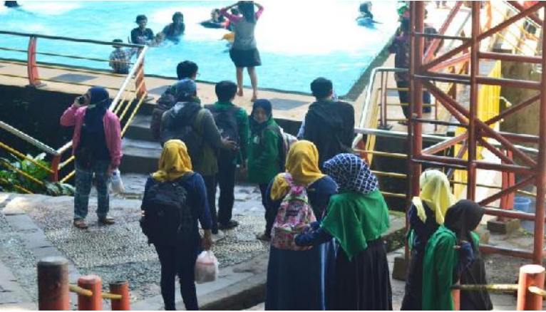
Tour Objek Wisata