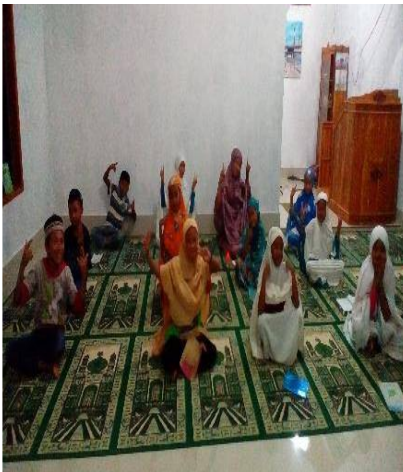
BIMBEL Bahasa Inggris