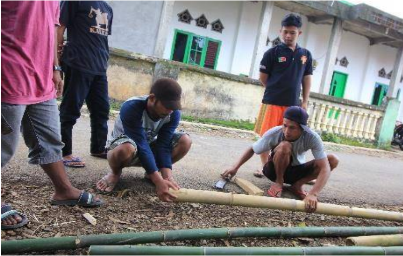
Gotong Royong dengan Masyarakat Bontomanai