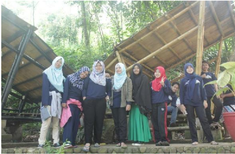
Tour Objek Wisata Bontomanai