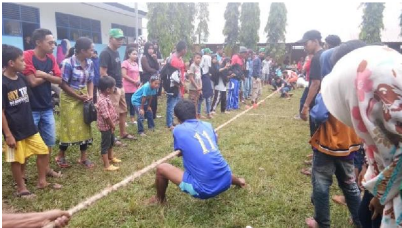
Gambar 2 : Salah seorang peserta Pekan Olahraga dan Kesenian (POK) berusaha menarik tali tambang dengan sekuat tenaga untuk memenangkan pertandingan