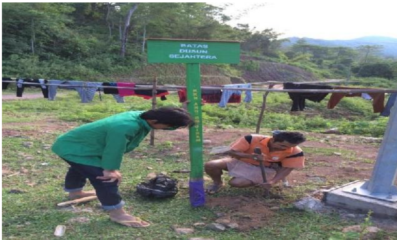
Gambar 2 : Proses pemasangan batas Dusun Sejahtera