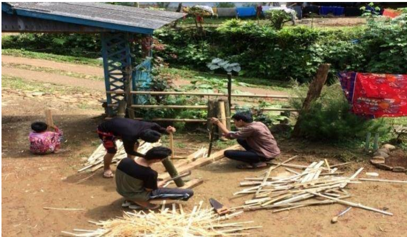
Gambar 2 : Proses pemasangan pagar di rumah kediaman Kepala Dusun Sejahtera