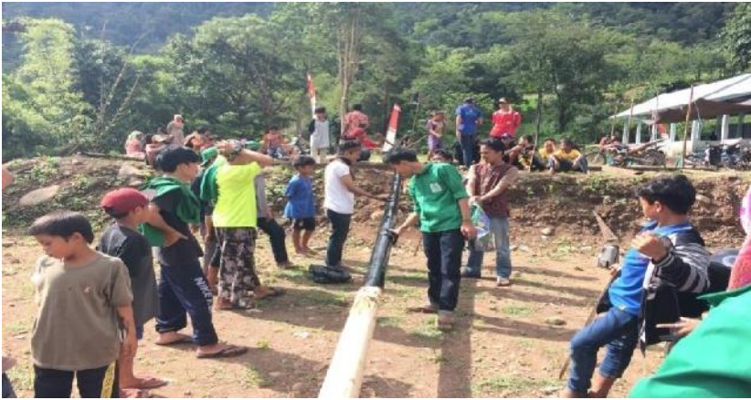
Gambar 1 : Panitia pelaksana Pekan Olahraga dan Kesenian (POK) sedang mempersiapkan alat perlombaan panjat pinang.