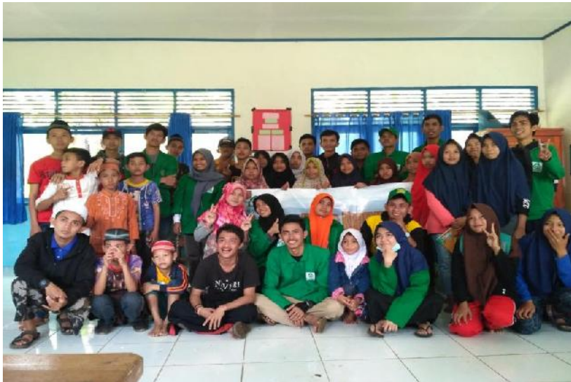
Gambar 3 : Sesi foto bareng panitia pelaksana Latihan Dasar Kepemimpinan (LDK) dengan peserta setelah seluruh rangkaian kegiatan telah usai