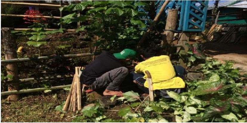
Gambar 1 : Nampak tiga Mahasiswa KKN posko 2 sedang meraut bambu untuk pembuatan pagar