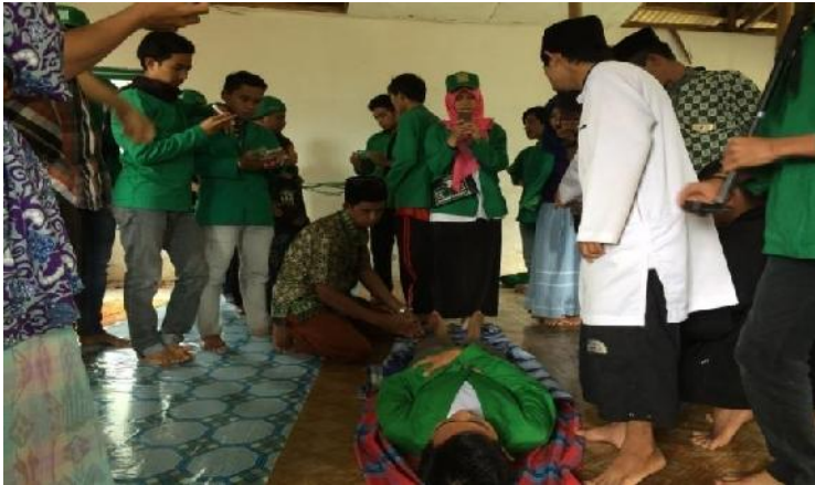
Gambar 2 : Setelah menerima materi di lanjutkan dengan praktik melayani jenazah