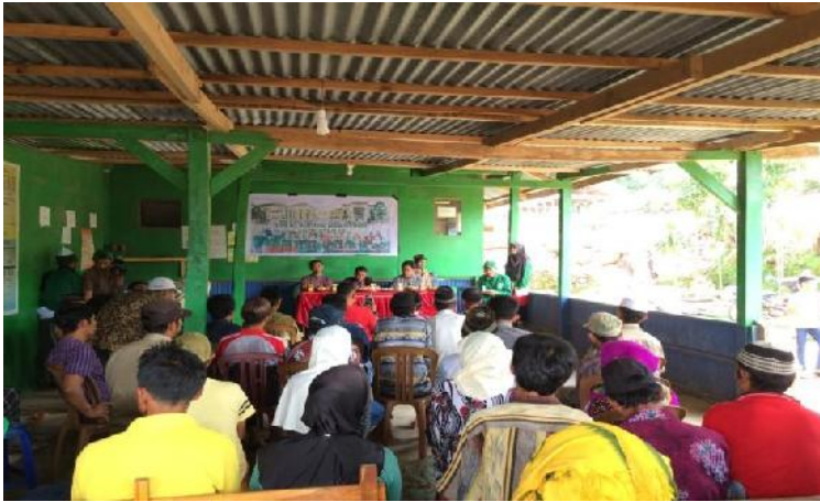
Gambar 1 : Proses penyampaian program kerja terhadap masyarakat Desa Bontomanurung dan Desa Bontosaomba