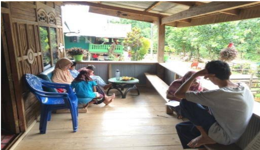
Gambar 1: Mahasiswa KKN posko 2 sedang mengajar santri-santri TKA/TPA