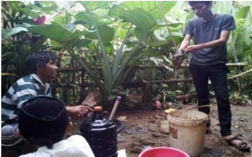
Gambar 1: Salah seorang Mahasiswa KKN memberikan Penjelasan terhadap masyarakat Dusun Sejahtera