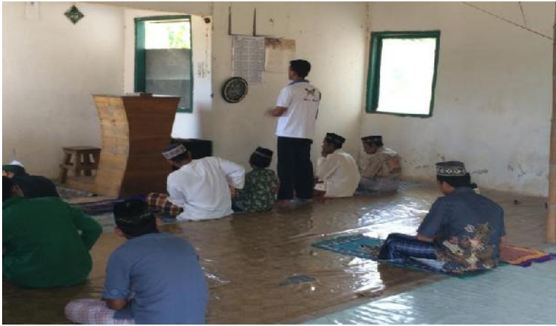
Gambar 2 : Suasana seperti gambar pertama