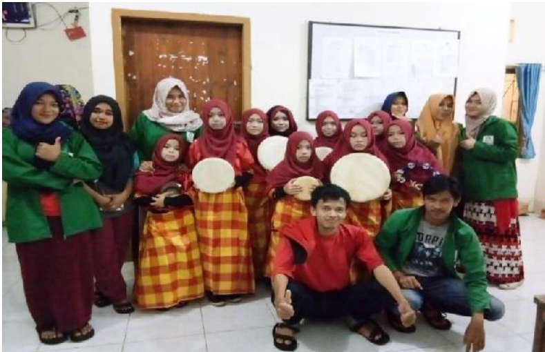
Gambar 2 : Foto bareng mahasiswa KKN posko 2 dengan peserta PORSANI perwakilan Bontoparang