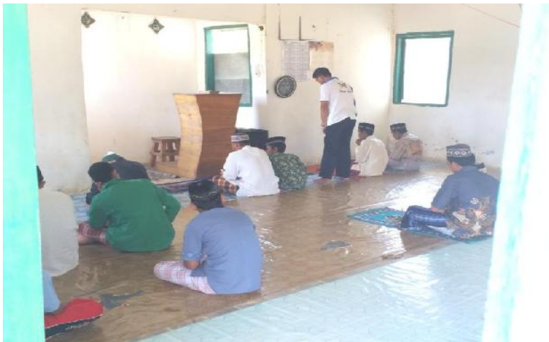
Gambar 1 : Suasana ibadah Jum'atan di Masjid Babul Jannah