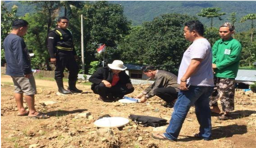
Gambar 1: Salah seorang Dosen UINAM mengukur arah kiblat