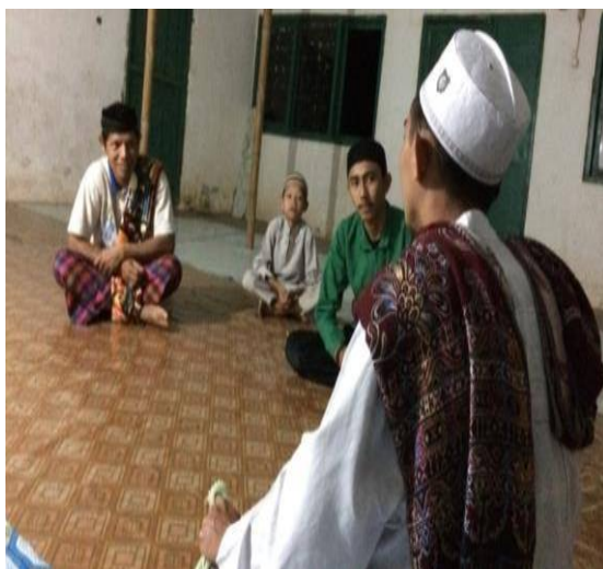
Gambar : Koordinator Desa memberikan pemahaman terhadap peserta terkait metode pembawaan Khutbah/ Ceramah