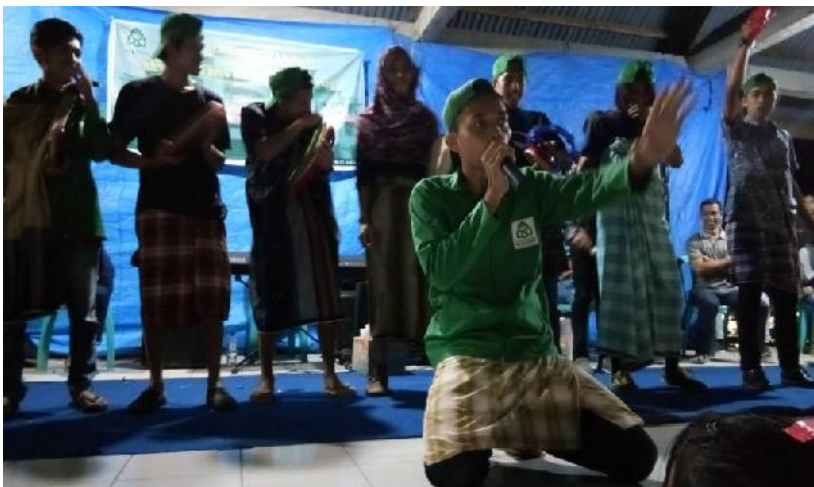
Gambar 2 : Seorang vocalis menyanyikan salah satu lagu shawat