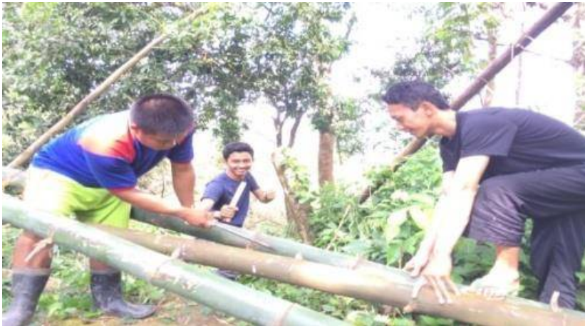
Gambar 1: Peserta KKN posko 2 mengambil bambu di kebun Kepala Dusun Sejahtera