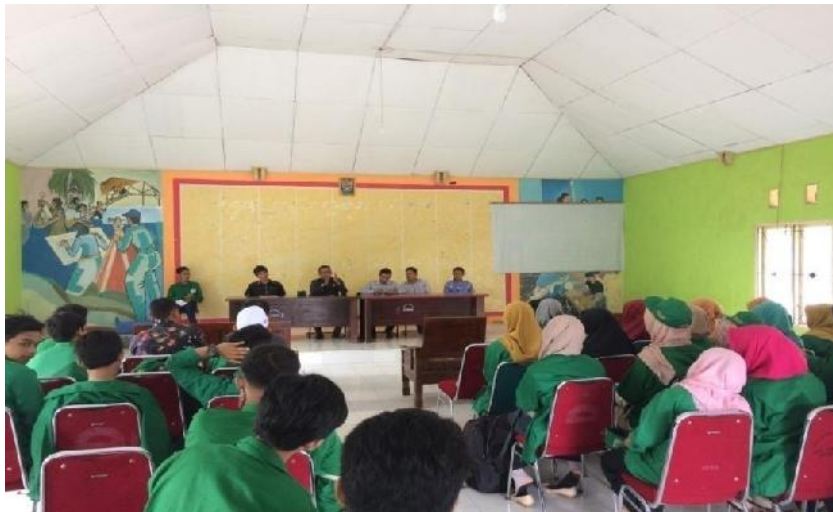
Gambar 2 : Sambutan dari Sekertaris Kecamatan Tompobulu