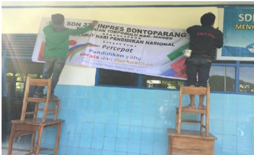
Gambar 2 : Suasana pemasangan spanduk