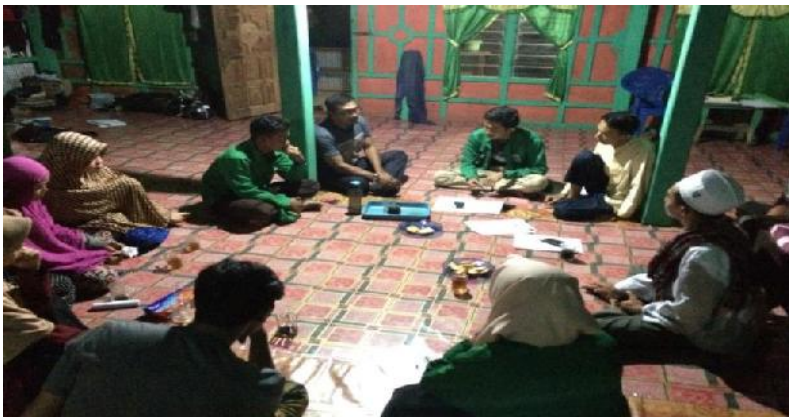
Gambar 2 : Suasana yang sama dengan gambar pertama