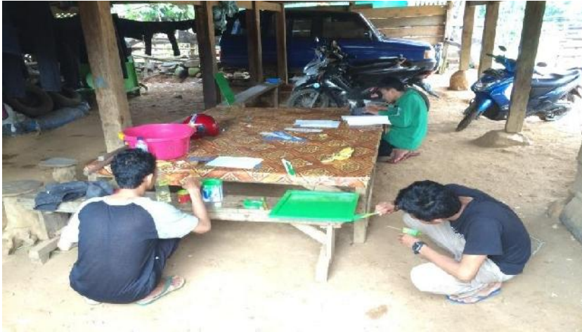
Gambar 1 : Tiga orang Mahasiswa KKN UINAM posko 2 sedang membuat papan Batas Dusun Sejahtera.