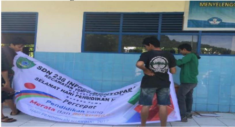
Gambar 1 : Tiga orang Mahasiswa sedang memasang spanduk peringatan Hari Pendidikan Nasional