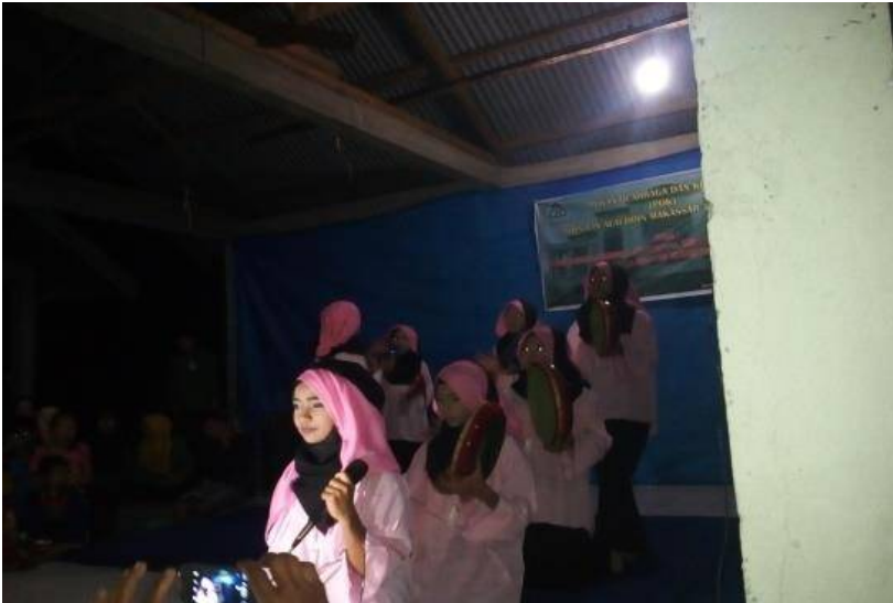
Gambar 1 : Peserta POK menampilkan lagu Qasidah