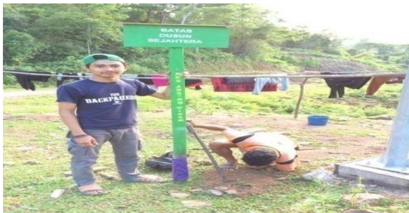
Gambar 1: Salah seorang mahasiswa KKN posko 2 Mempersiapkan alat pemasangan Batas Dusun