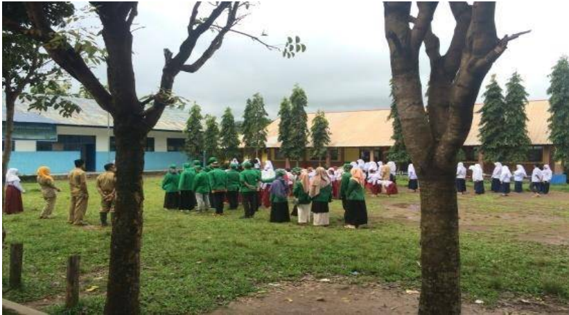
Gambar 1 : Mahasiswa KKN beserta para dewan guru mengikuti upacara bendera pada hari senin.