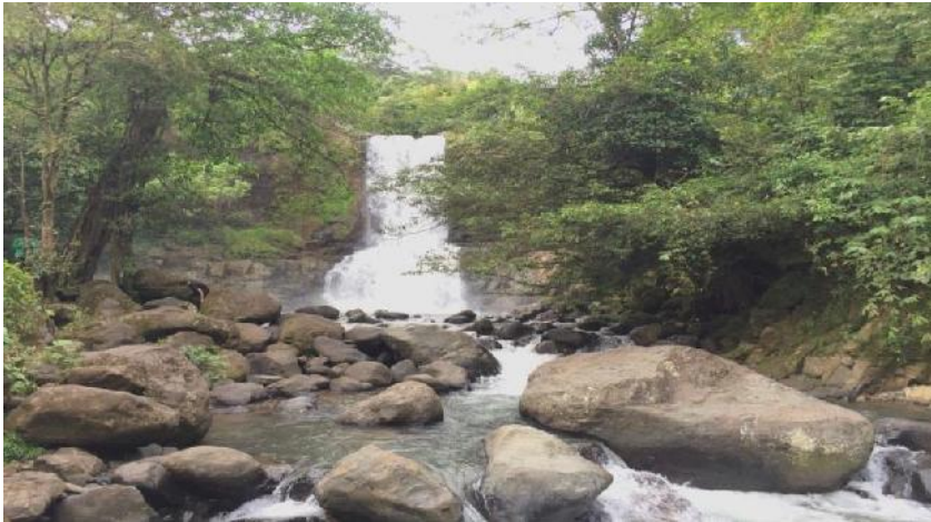
Gambar 2 : Suasana wisata air terjun Pung Bunga