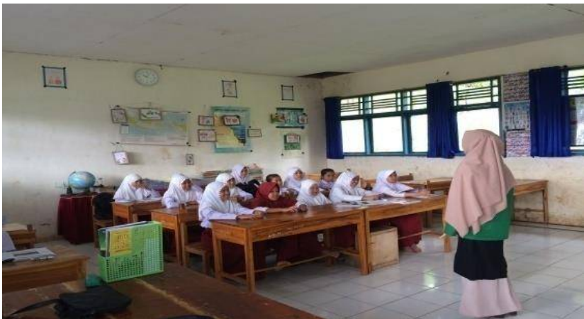
Gambar 2 : Salah seorang Mahasiswi mengajar di salah satu kelas SDN 238 Bontoparang