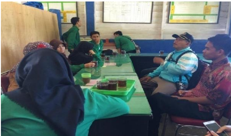
Gambar 2 : Mahasiswa KKN UINAM dengan pihak guru sekoah sedang membahas apa yang menjadi hambatan dan keunggulan sekolah setempat