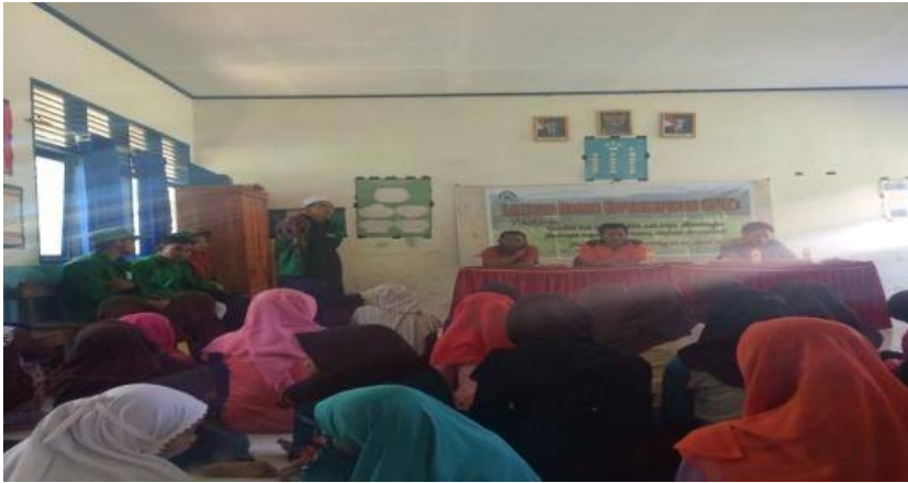
Gambar 1 : Sambutan koordinator Desa pada pembukaan latihan dasar kepemimpinan (LDK)