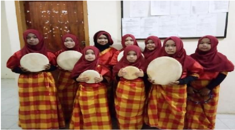
Gambar 2 : Foto peserta PORSENI Sekecamatan Tompobulu pada cabang lomba Qasidah