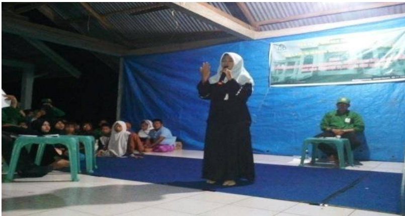
Gambar 2 : Peserta POK menampilkan Ceramah Islamiyah