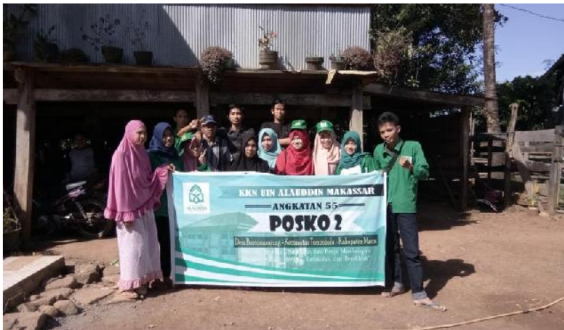
Gambar 1 : Foto bareng bersama keluarga Kepala Dusun Sejahtera (Bapak Posko 2)