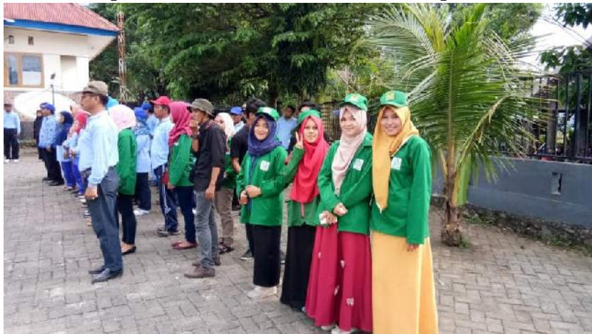
Gambar 1 : Mahasiswa KKN UINAM Ang. 55 Posko 2 mengikuti upacara pembukaan porсени Sekecamatan Tompobulu