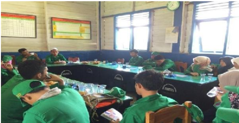
Gambar 1 : Koordinator Desa KKN UINAM Ang. 55 membuka rapat bersama