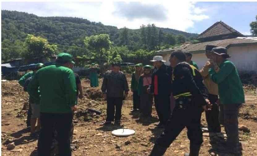
Gambar 1 : Nampak salah seorang Dosen UINAM memberikan penjelasan berkaitan tata cara mengukur arah kiblat