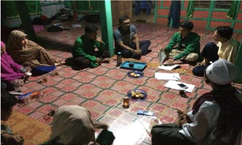
Gambar 1 : Bapak Sekertaris Kecamatan Toppobulu memberikan masukan dan arahan terkait Program Kerja Penyelenggaraan Jenazah