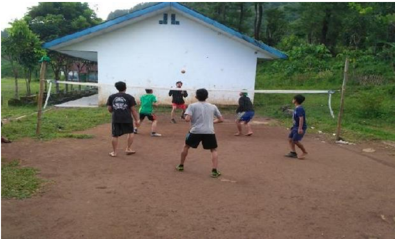
Gambar 1 : Proses pelatihan terhadap peserta porseni SDN 238 Bontoparang