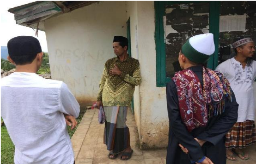
Gambar 2 : Suasana gambar sama dengan yang pertama