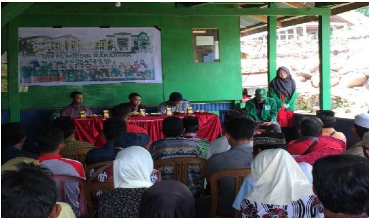
Gambar 2 : Pembacaan do'a pada acara pembukaan Seminar Desa