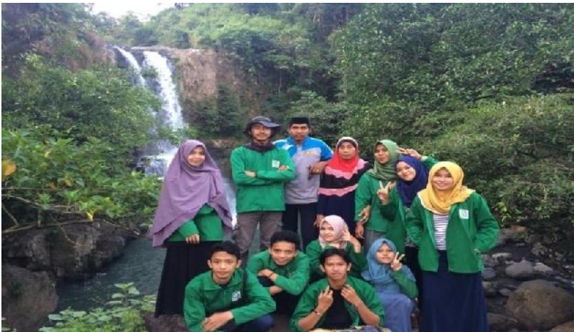
Gambar 1 : Photo bareng bersama dengan keluarga Kepala Dusun Sejahtera