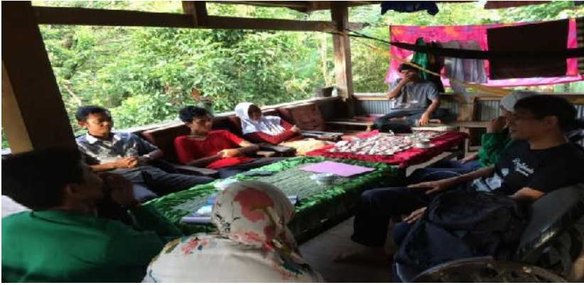
Gambar 1 : Nampak suasana yang penuh canda tawa antara Dosen Pembimbing dengan Mahasiswa KKN Posko 2