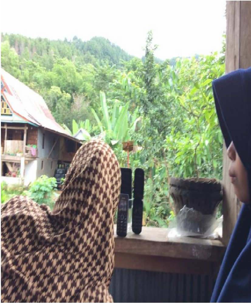
Gambar 1 : Potret Mahasiswa yang sedang mencari jaringan telephone di lokasi KKN