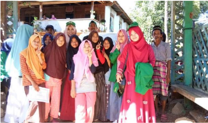
Gambar 2 : Suasana gambar sama dengan yang pertama