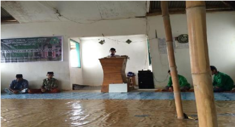
Gambar 1 : pemateri menjelaskan kiat-kiat dalam meayani seorang jenazah mulai dari memandikan hingga menguburkan jenazah.