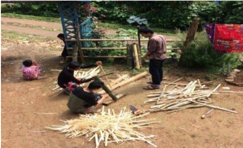
Gambar 2: Nampak Mahasiswa KKN posko 2 membuat pagar