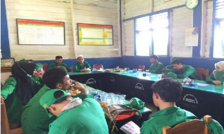
Gambar 2 : Suasana yang sama dengan gambar pertama