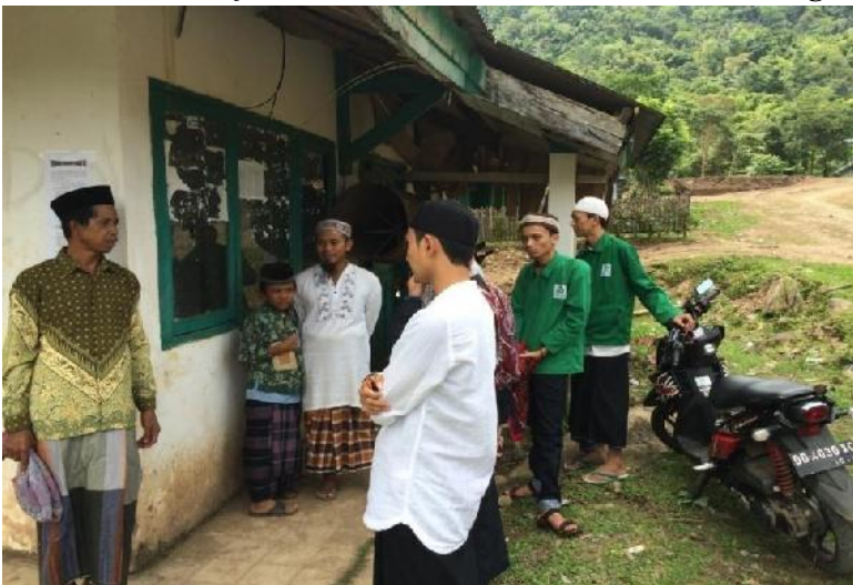
Gambar 1 : Nampak Mahasiswa KKN sedang berbincang dengan masyarakat setempat terkait dengan kondisi sosial yang terjadi di masyarakat.