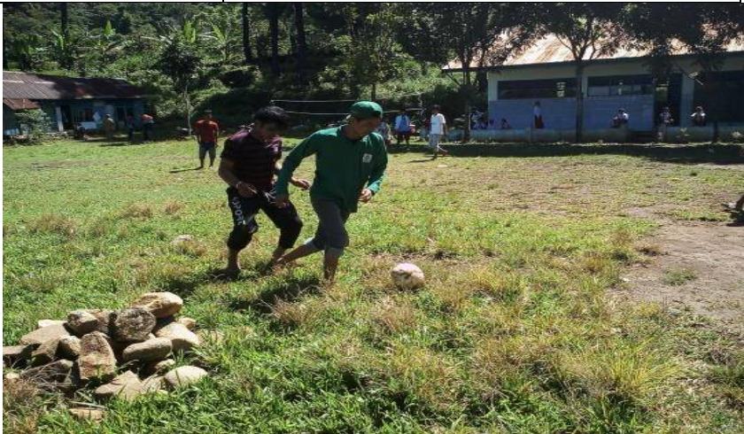
Gambar 1: Salah seorang Mahasiswa bermain bola dengan peserta PORSENI