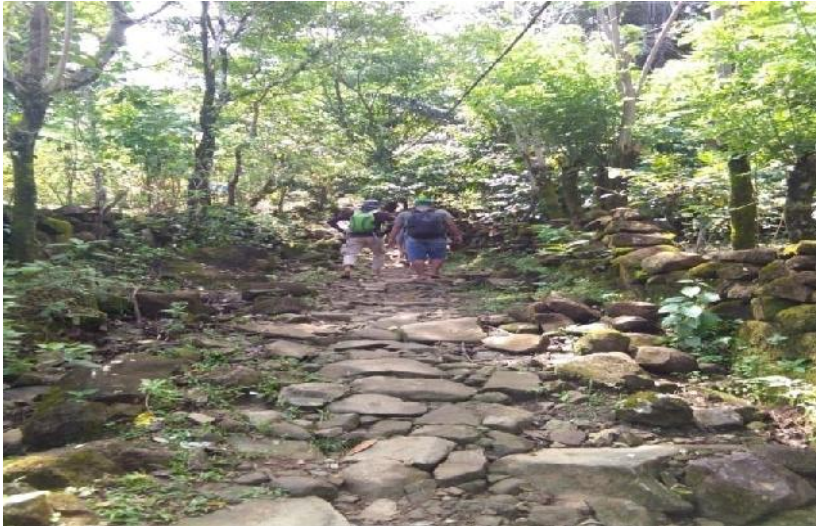
Gambar 1 : Kondisi akses menuju ke Dusun Bara