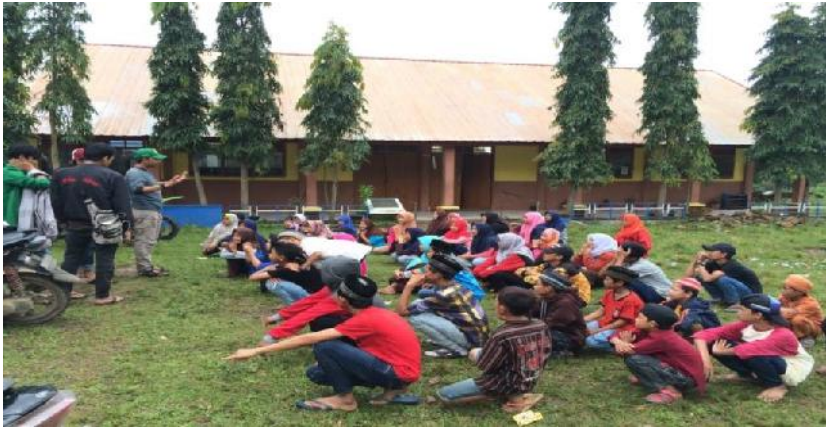
Gambar 4 : Apel bagi peserta Latihan Dasar Kepemimpinan (LDK)