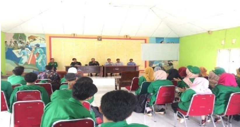
Gambar 1 : Sambutan dari salah seorang Dosen Pembimbing