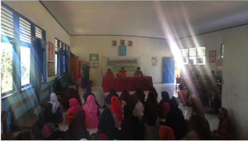
Gambar 2 : Sambutan Koordinator Desa KKN UINAM Ang. 55 Desa Bontomanurug