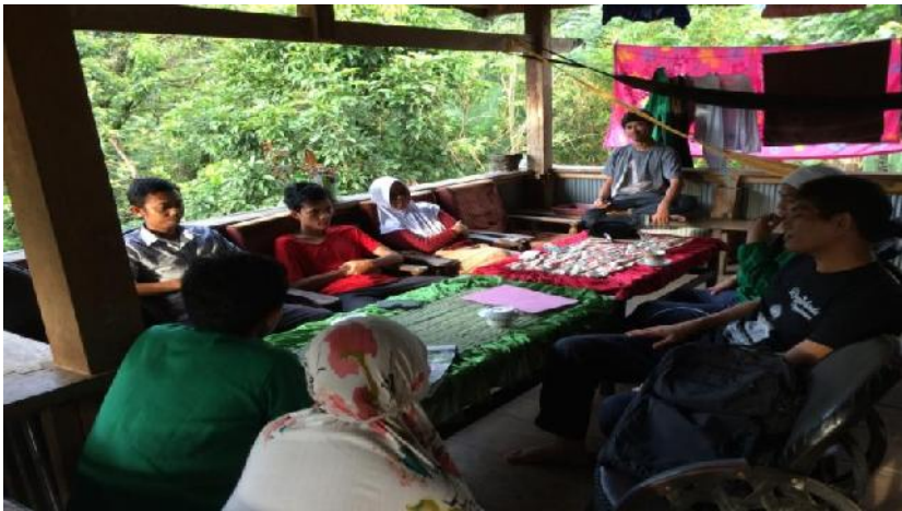
Gambar 2 : Suasana seperti gambar pertama