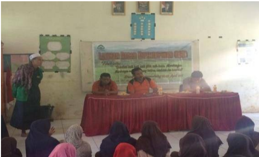
Gambar 2: Sambutan Kordinator Desa dalam pembukaan Latihan Dasar Kepemimpinan (LDK)