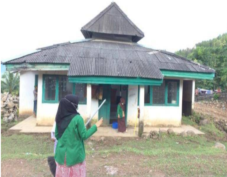
Gambar : Mahasiswa KKN dari beberapa posko hadir kerja bakti di Masjid Babul Jannah Bontomanurung