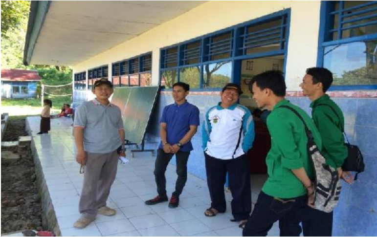
Gambar 1 : Nampak Mahasiswa KKN UINAM posko 2 sedang berbincang dengan pihak guru berkaitan dengan kondisi sekolah setempat.