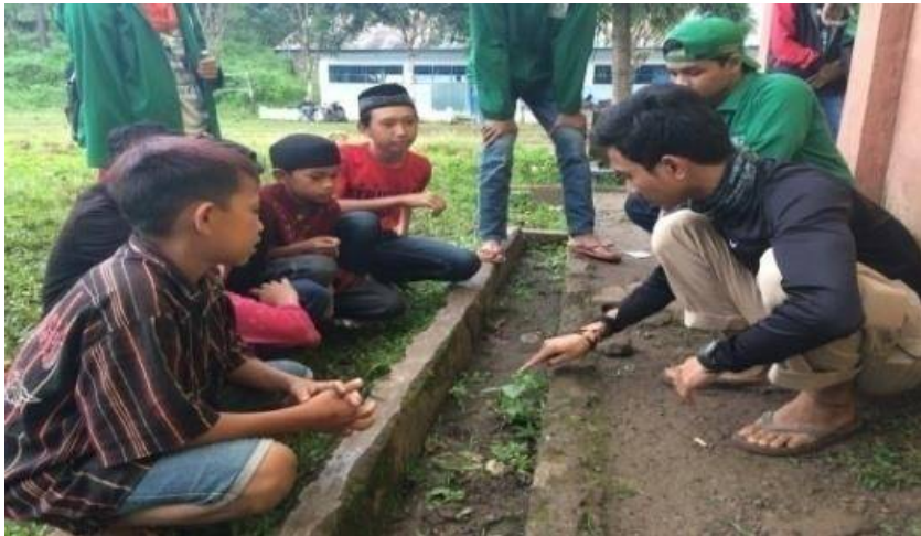
Gambar 1 : Salah seorang panitia latihan dasar kepemimpinan (LDK) memberi penjelasan terkait game yang diberikan kepada peserta