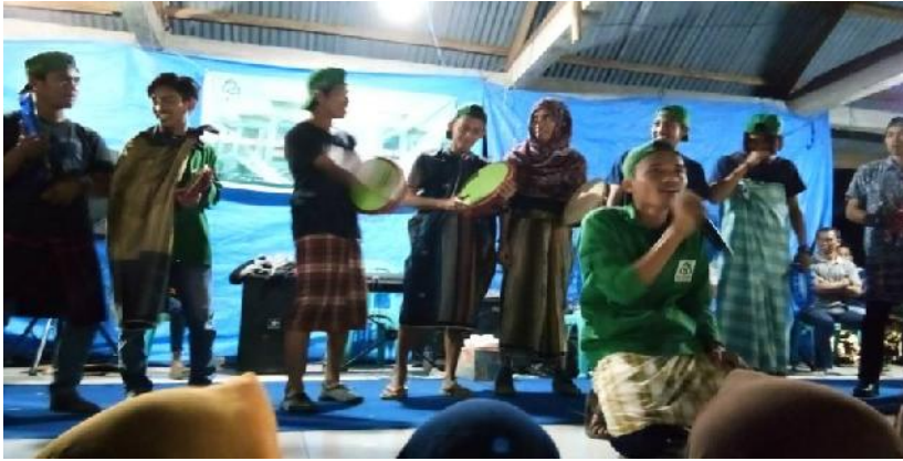
Gambar 1 : Pemberian salam kepada para penonton atau masyarakat yang hadir dalam acara Pekan Olahraga dan Seni (POK) oleh salah seorang Mahasiswa KKN dalam penampilan hiburannya