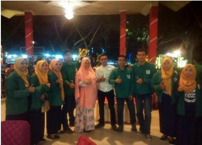
Gala Dinner Mahasiswa KKN UIN Alauddin Makassar Se- Kecamatan Bissappu Kabupaten Bantaeng yang diselenggarakan oleh Pemerintah Kabupaten Bantaeng