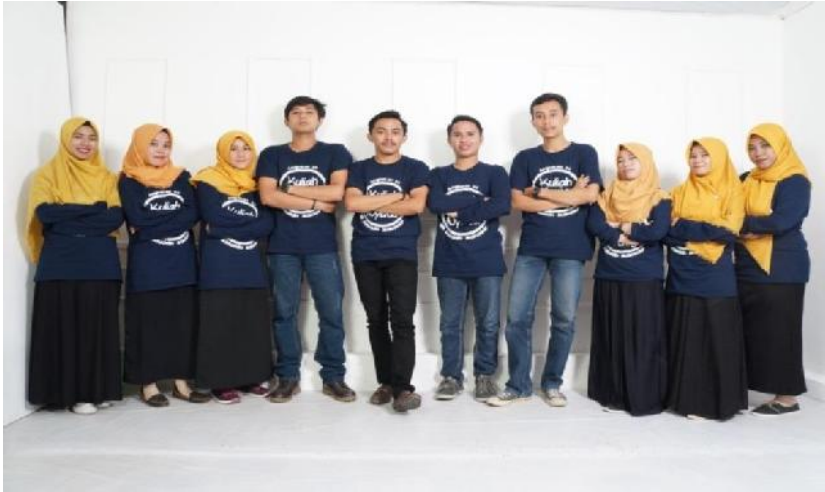
Mahasiswa KKN Angkatan 54 Posko 4 Kelurahan Bonto Rita