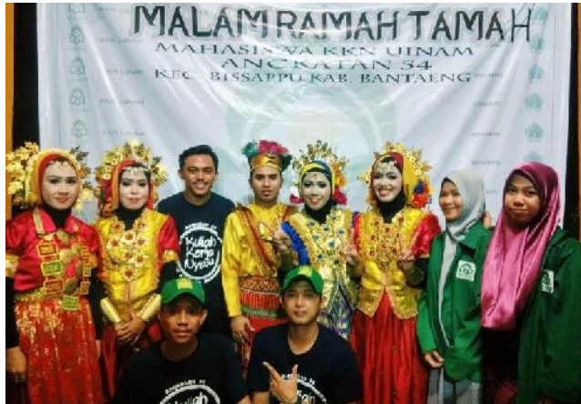
Malam Ramah Tamah Mahasiswa KKN UIN Alauddin Makassar Kecamatan Bissappu Kabupaten Bantaeng 17 Mei 2017