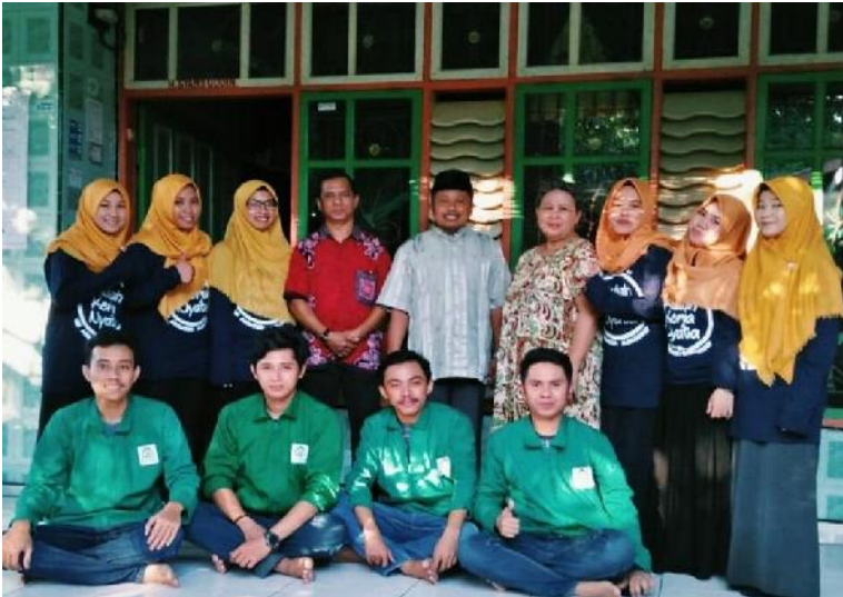
Kunjungan Pembimbing dan Pihak LP2M