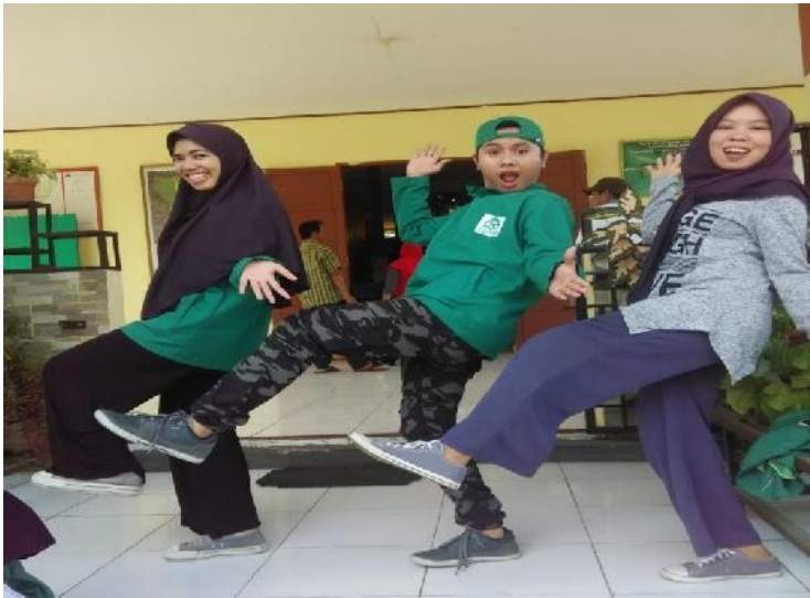
Senam Pagi Setiap Hari Sabtu di Kantor Kelurahan Bonto Rita