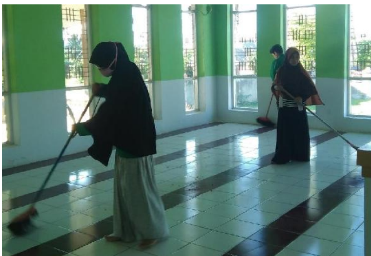
Kerja Bakti di Masjid / Mushollah Setiap Hari Jum'at