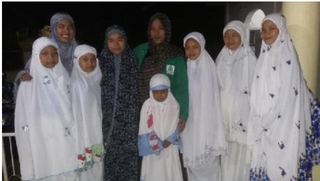
Mengajar BTQ Setiap Hari Senin-Jum'at