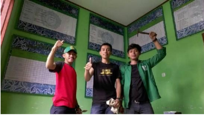
Pembuatan Atribut PKK dan LPM