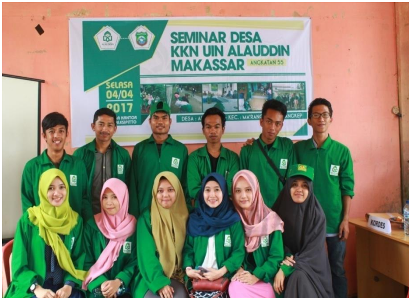
Foto kami satu posko dengan pak korcam....

Untuk desa alesipitto yang tercinta terima kasih telah menerima dengan tulus dan selalu kompak dan tetap jaga ikatan persaudaraan , jangan lupakan kami yang telah singgah walaupun hanya sebentar. Wassalamualaikum W.r.W'b.