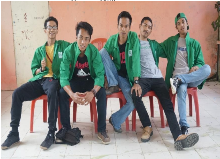
Foto keseruan kami para lelaki dengan gaya yang berbeda sesuai karakter masing-masing,,,,,

Posko kami tak pernah sepih, karena anak-anak didesa sini selalu mengunjungi kami setiap harinya, sesekali pun mereka meninap, padahal kami mengajar di sekolah mereka, bisa dikatakan mereka 24 jam bersama kami, mungkin kedekatan mereka dengan kami yang tak terbatas, terkadang mereka sedikit nakal, tetapi bagaimanapun mereka adalah anak-anak yang butuh arahan dan bimbingan.