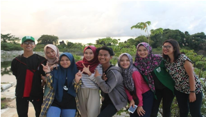
Foto keseruan kami dengan para remaja desa alesipitto,,,,

Bagi adik-adik semoga kalian menjadi anak sholeh yang berbakti kepada guru dan kedua orang tua. Tunjukkan perilaku mulia kalian di sekolah dan di luar sekolah dan jaga nama baik sekolah sehingga dapat dipandang dimasyarakat luas dan jangan lupa belajarlh dengan giat. Dan terima kasih telah menginspirasi saya khususnya dan juga teman-teman semoga .kalian sukses kelak dan berguna bagi masyarakat, nusa dan bangsa.