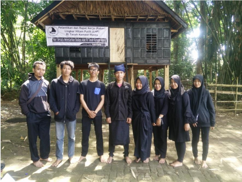
Kunjungan ke Tana Toa, kajang.