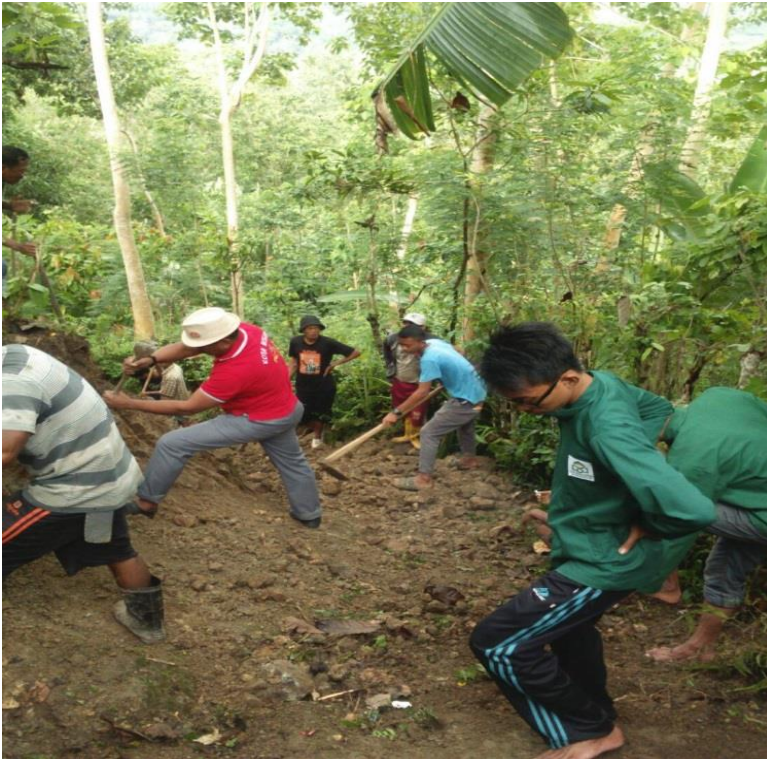
Pembukaan jalan baru untuk akses menuju perkebunan warga