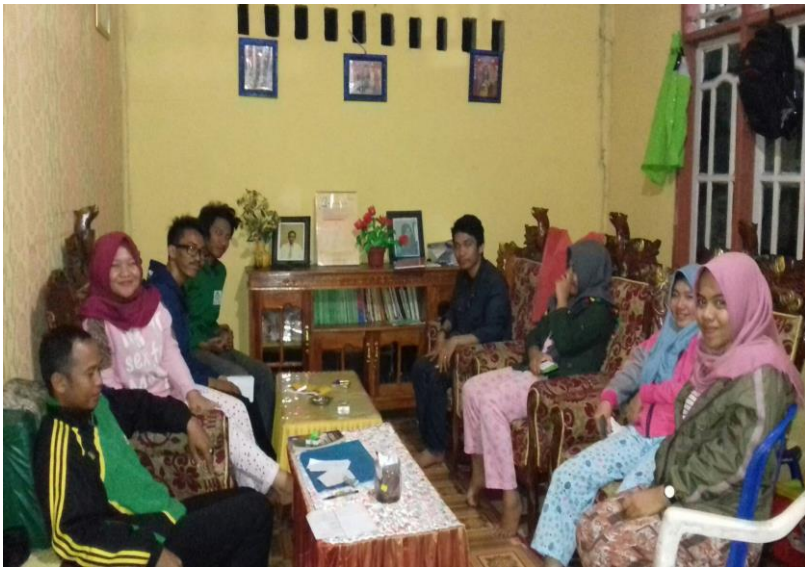
Pertemuan dengan sekretaris desa perihal program yang akan dijalankan