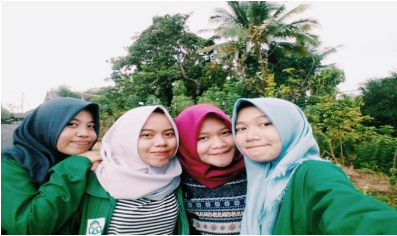
Foto bersama para mahasiswa putri