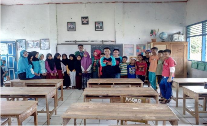
Foto bersama siswa-siswi SD Bonto kunyi setelah kegiatan Try out