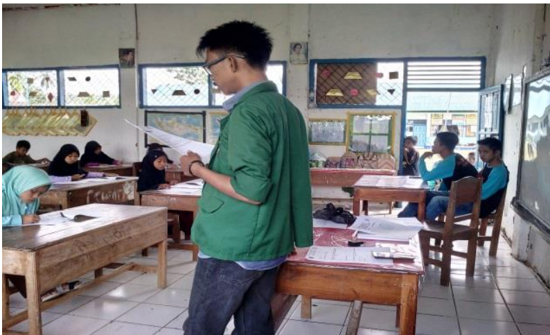
Kegiatan Try out di SD Bonto kunyi?