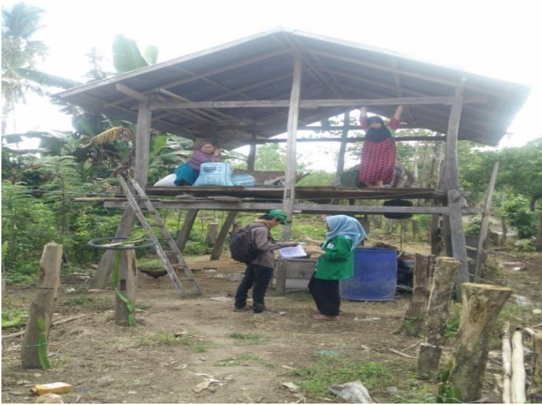
Pendataan di Dusun Bonto tappalang