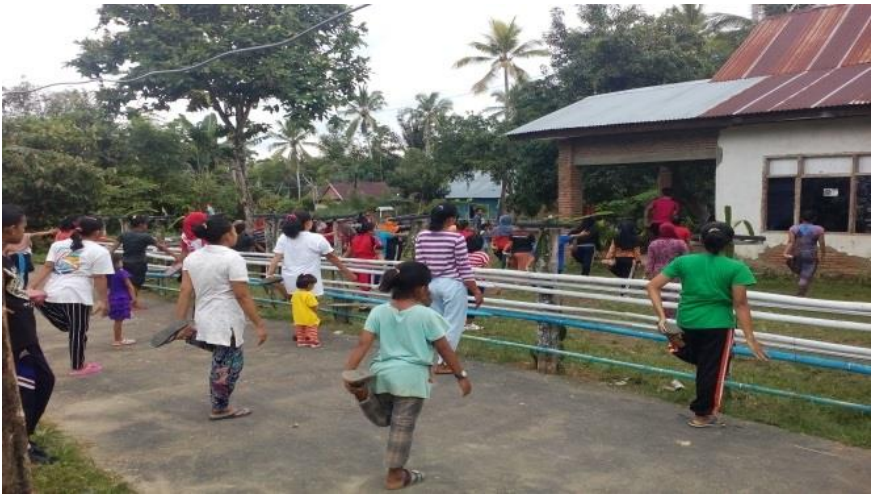
Senam rutin untuk warga desa