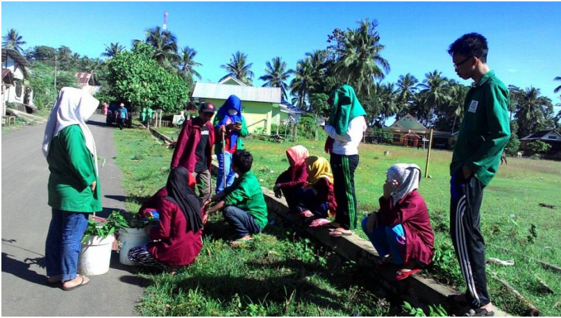
Penanaman Pohon di sepanjang dusun Erasa