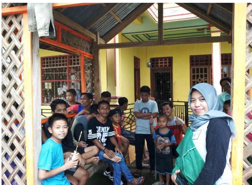
Foto bersama para supporter volly