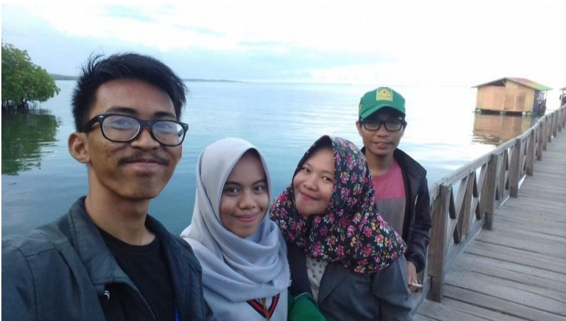
Wisata ke Tongke-Tongke di akhir pekan