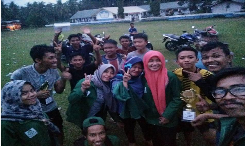
Foto bersama salah satu pemenang lomba volly