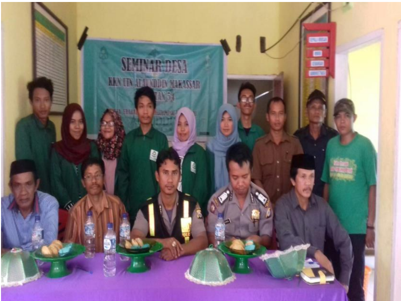
Foto bersama para aparatur desa saat seminar desa