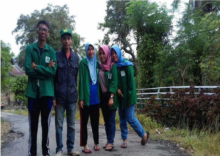
Hari pertama saat observasi desa Era baru