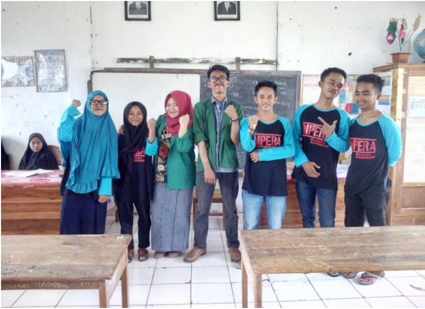
Foto bersama dengan anggota IMPERA