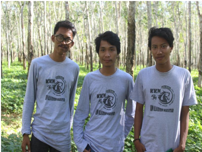
Foto bersama para mahasiswa putra