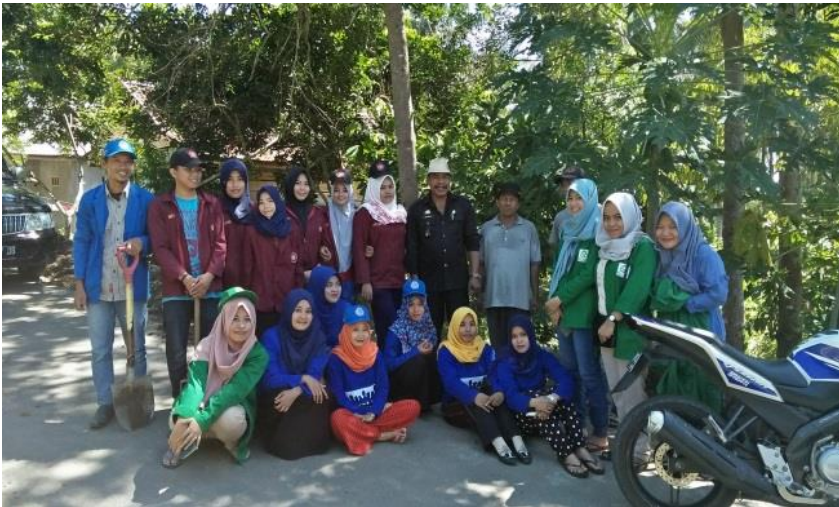
Foto bersama dengan mahasiswa STISIP dan IAIM setelah bakti sosial