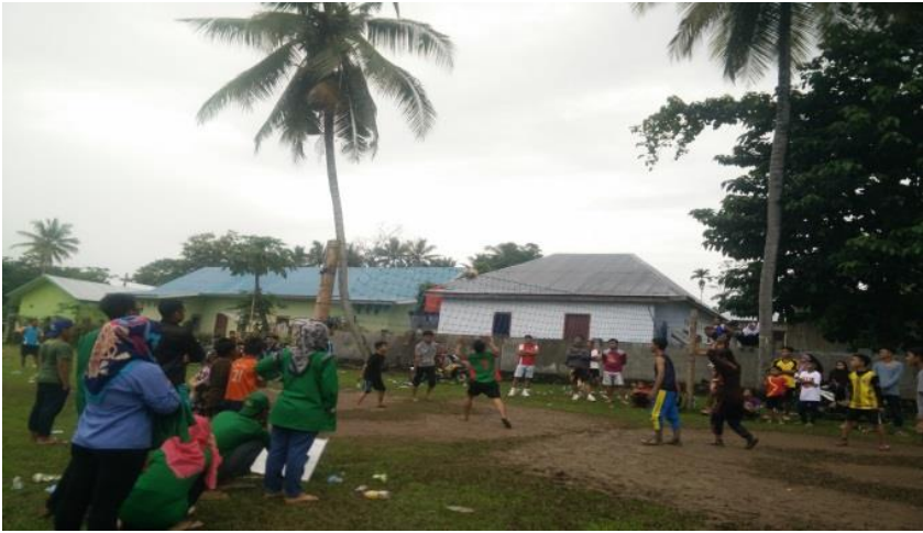
Perlombaan volly di lapangan dusun Erasa desa Era baru