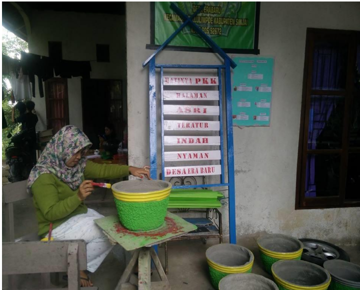
Pemberian cat pada pot bunga