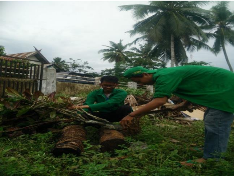
Kegiatan Jumat bersih di kantor desa Era baru