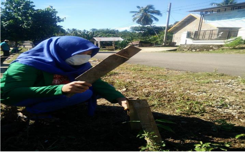
Penanaman pohon di sepanjang jalan dusun Erasa