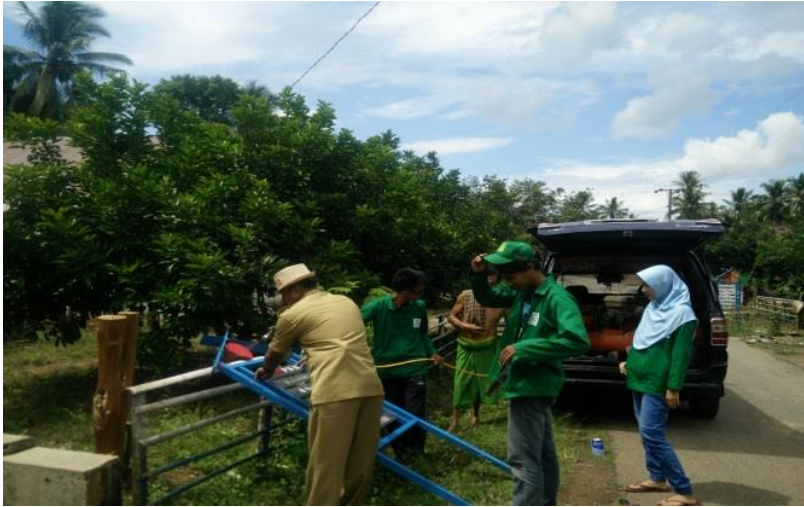
Pembuatan papan “hati PKK”