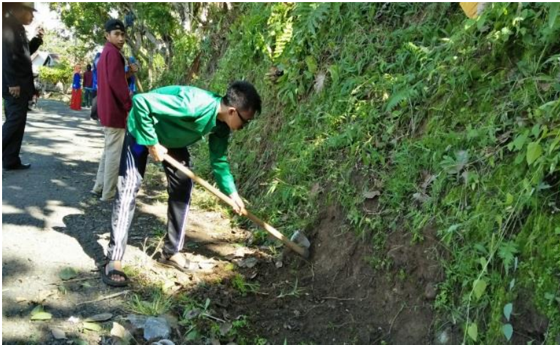
Kegiatan bakti sosial di sepanjang jalan desa Era baru