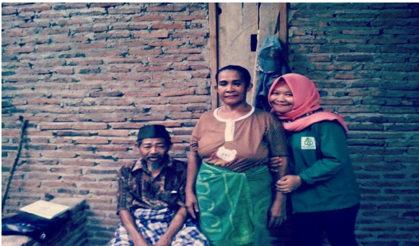
Bersama salah satu warga yang mengidap penyakit maag akut di dusun