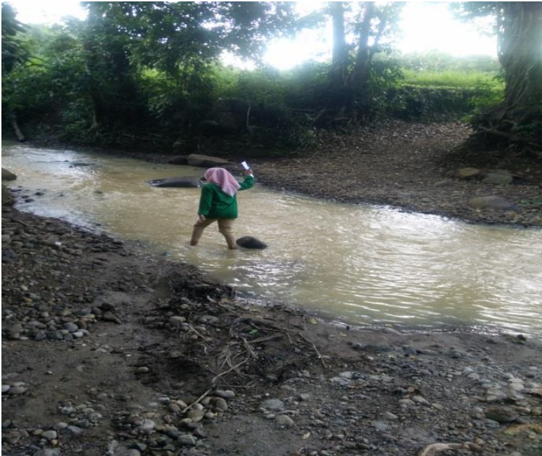
Pada saat pendataan di dusun Bonto tappalang