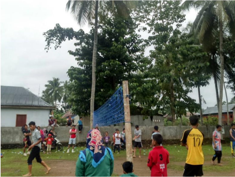
Pertandingan Volly di lapangan Erasa