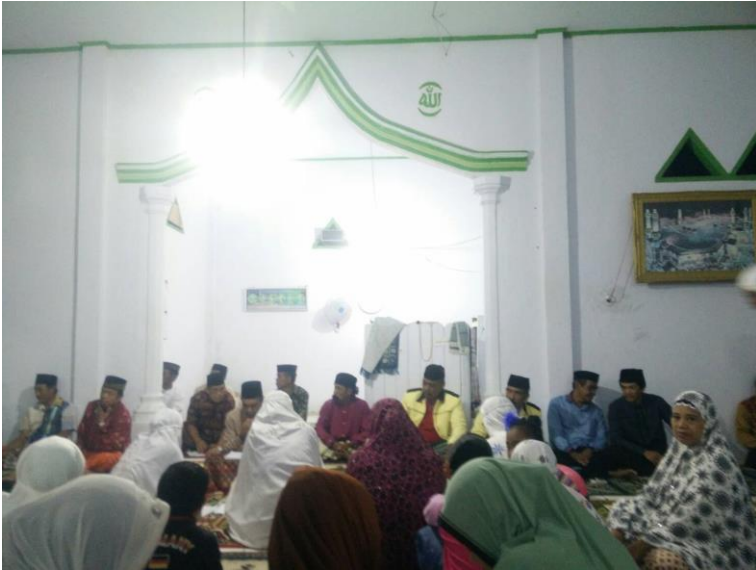
Isra' miraj di masjid Erasa