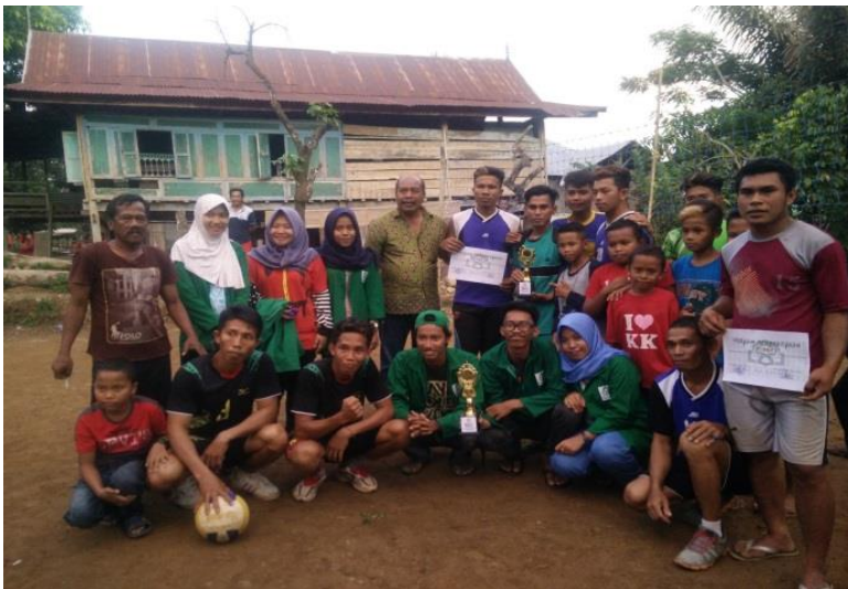
Penyerahan hadiah lomba volly se-desa Era baru