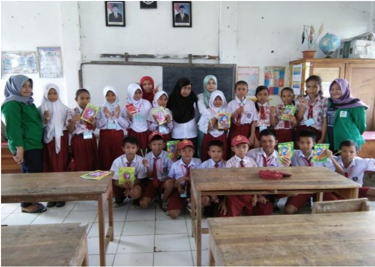
Pembagian cendaramata untuk siswa-siswi SD Bonto kunyi