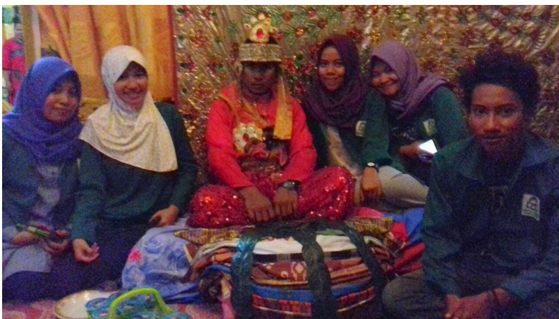
Foto bersama pengantin laki-laki di malam mappacci'