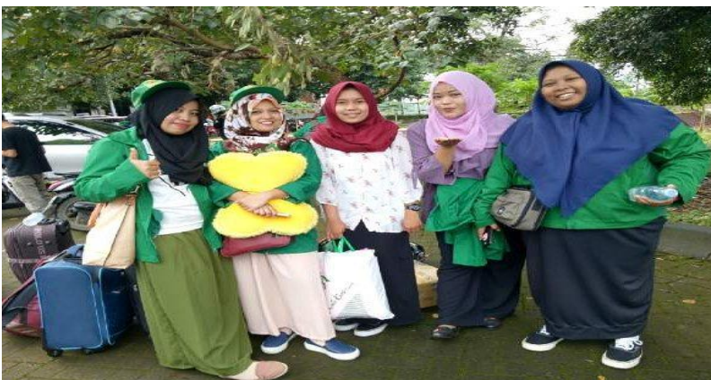
Pada saat keberangkatan KKN