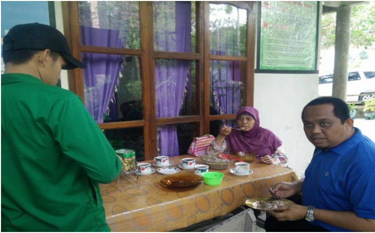
Pada saat LP2M mengunjungi posko desa Era baru