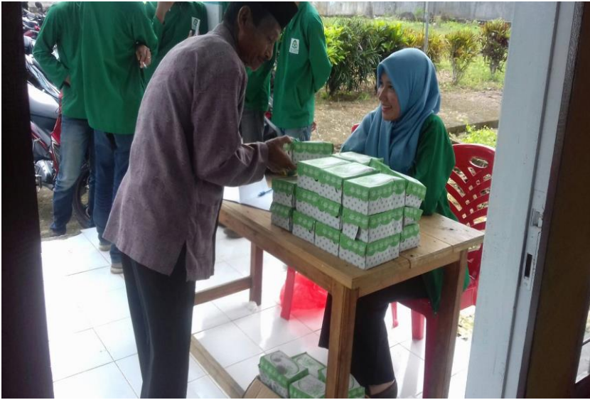
Pembagian konsumsi saat seminar desa di kantor desa Era baru