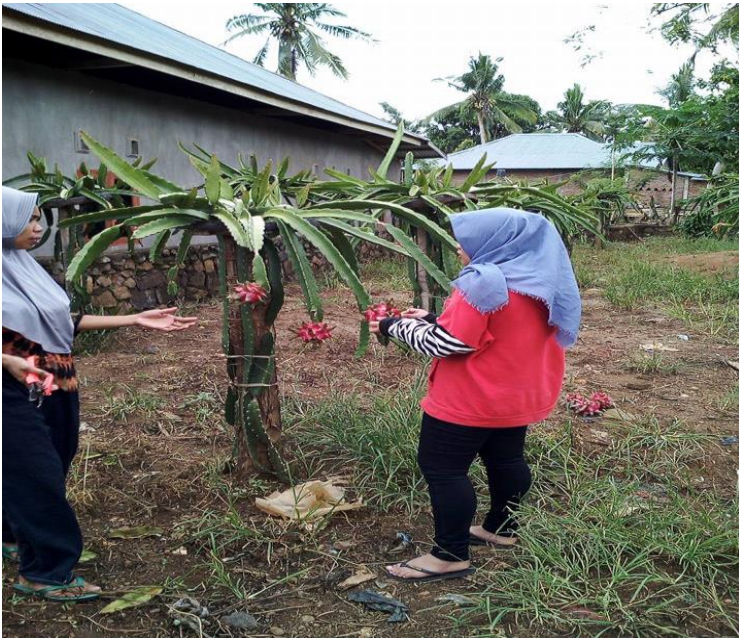
Panen Buah naga di desa Sukamaju dengan warga