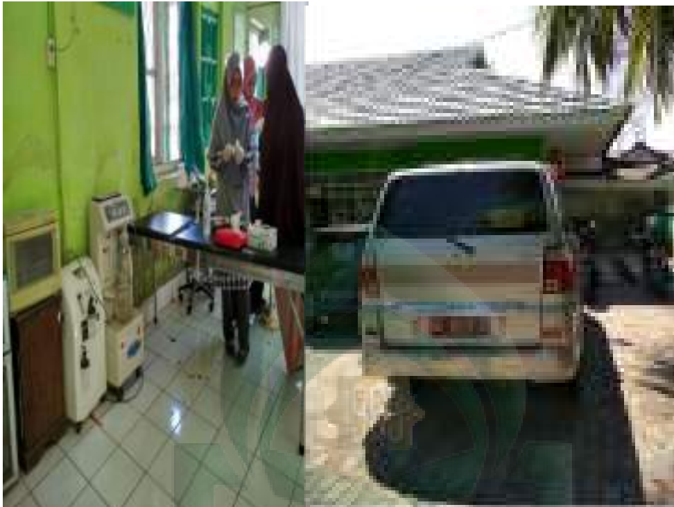
Perawat sedang menangani pasien di UGD Fasilitas mobil ambulance di UPT.Dinkes Pattalassang Pattalassang