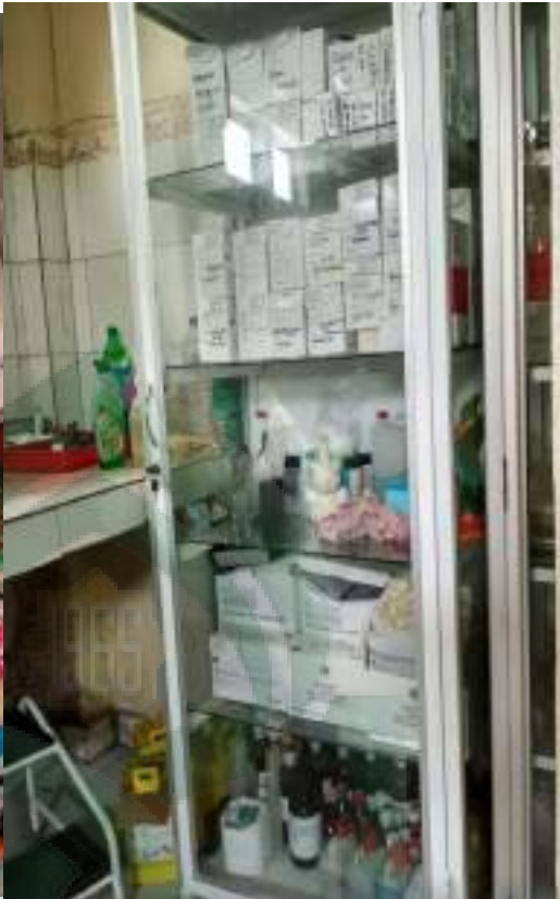
penyimpanan alat imbus dan suntik di polsel tempat penyimpanan obat di polsel