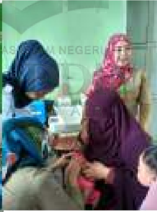
perawat sedang menangani pasien