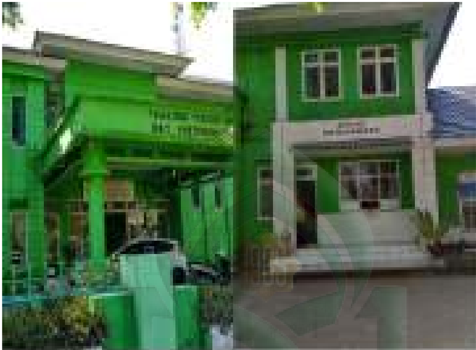
Tampak depan UPT.Dinkes Pattalassang