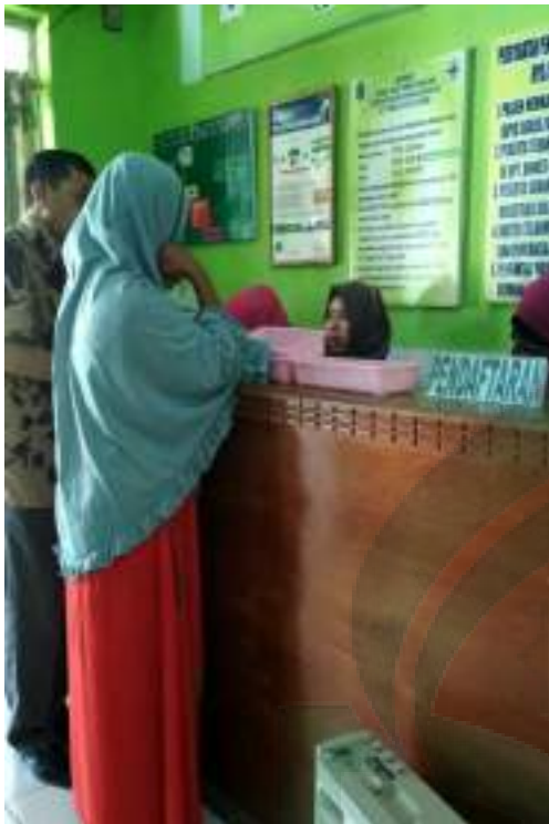
Tempat pendaftaran di pattalassang