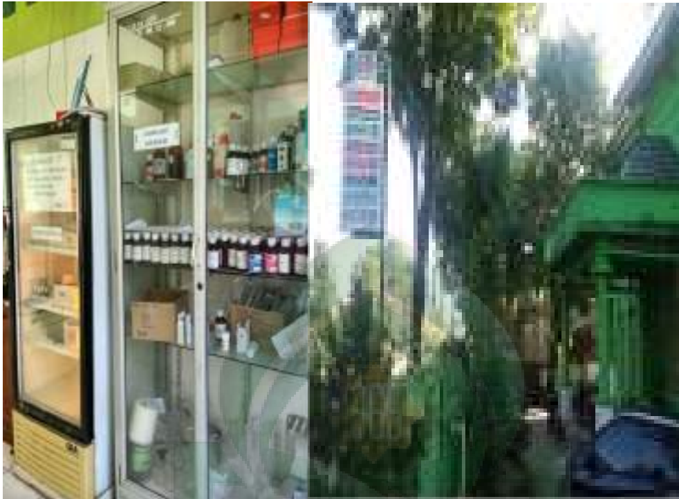
Tempat penyimpanan obat di laboratorium halaman depan di UPT.Dinkes Pattalassang