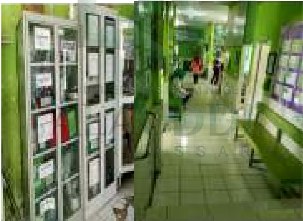
Tempat peralatan di ruangan UGD kursi tunggu untuk pasien yang menunggu giliran