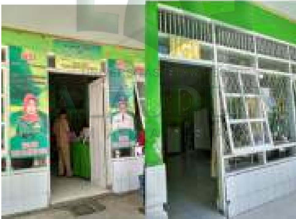
Tampak depan tempat masuk di UPT.Dinkes pattalassang