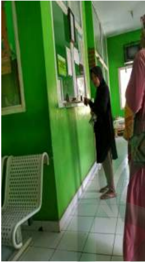
Pasien sedang mengambil no.antrian