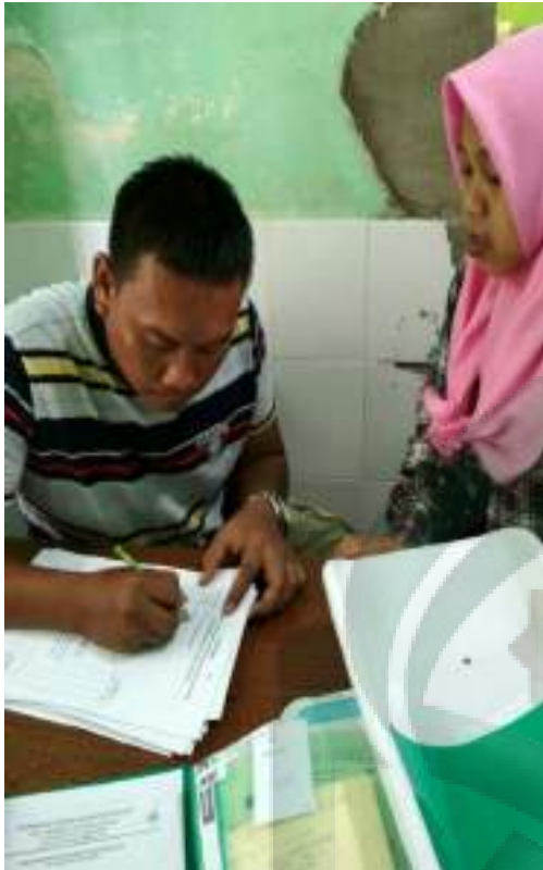
Pasien sedang mengisi lembar kuisioner