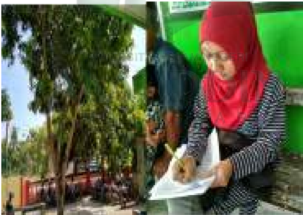
Halaman depan UPT.Dinkes Polsel