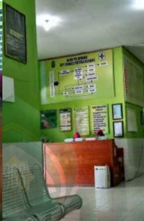
tempat ruang tunggu dan pendaftaran