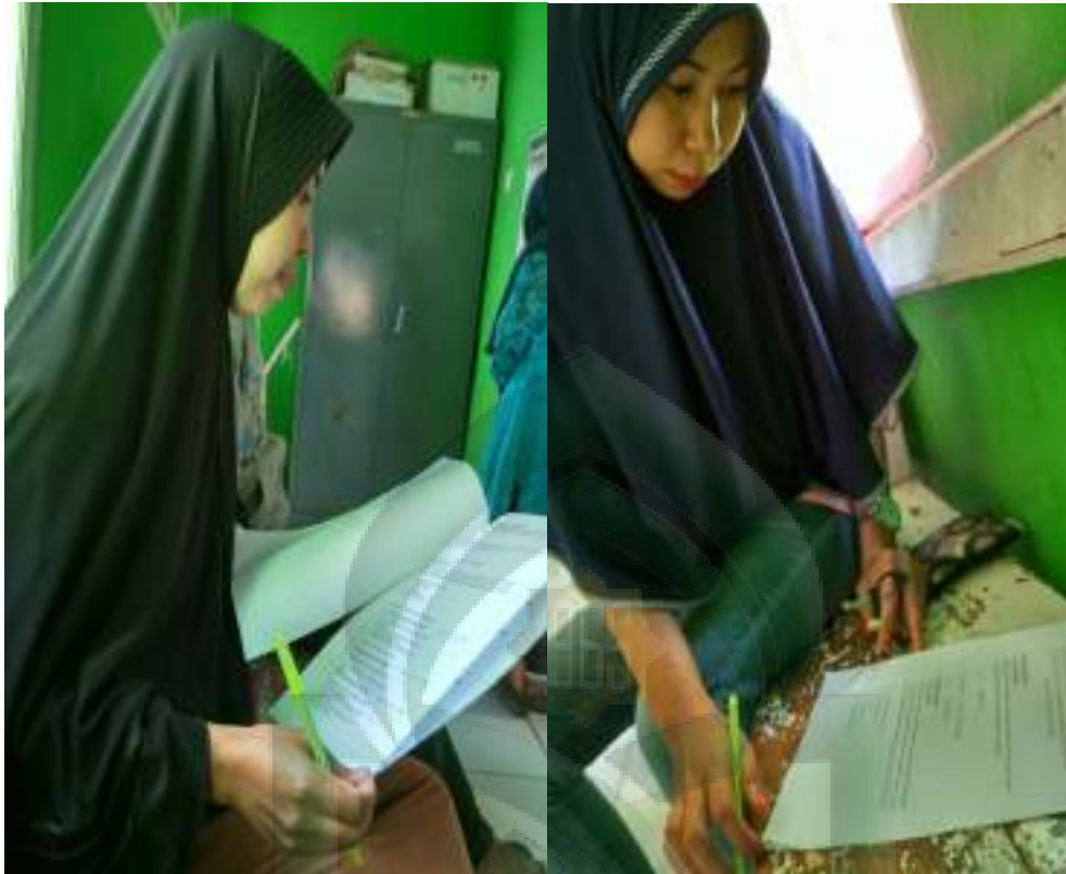
Pasien sedang mengisi lembar kuisisioner pasien mengisi lembar kuisisioner