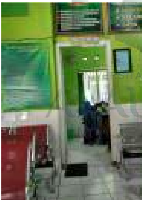
Tampak depan ruangan pemeriksaan dokter sambil berbincang