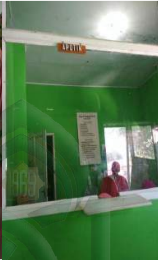
tempat pengambilan obat di Pkm Polsel