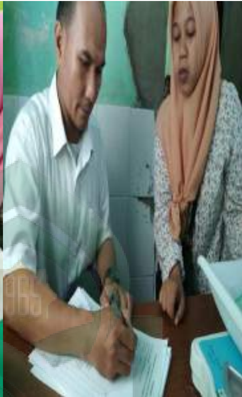
pasien sedang mengisi lembar kuisioner