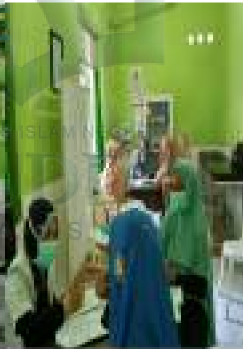
dokter yang sedang memeriksa pasien dan berbincang tentang penyakit pasien