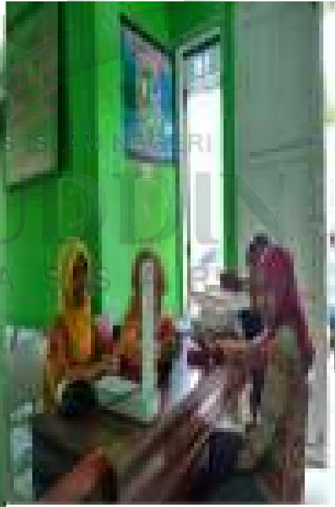
tempat administrasi / pendaftaran