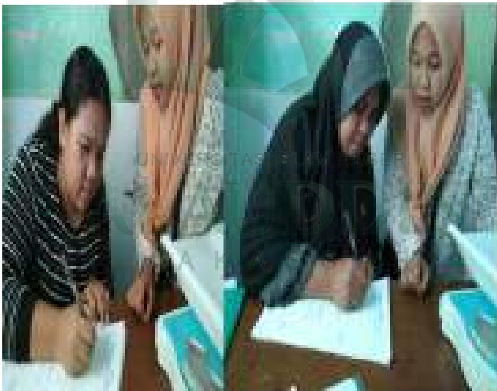
Pasien sedang mengisi lembar kuisisioner pasien sedang mengisi lembar kuisisioner