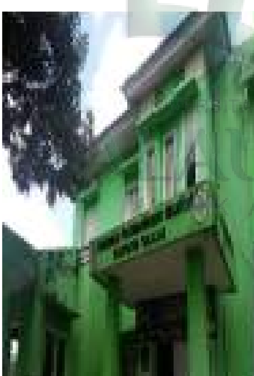
Tampak depan UPT.Dinkes Polsel