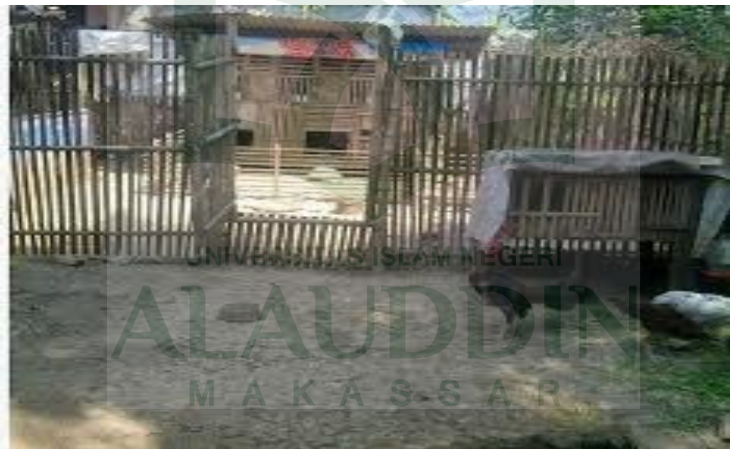
Bentuk kandang salah satu peternak