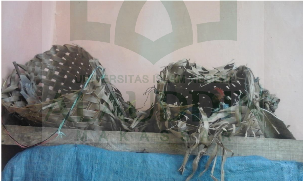
Tempat bertelur ayam buras betina