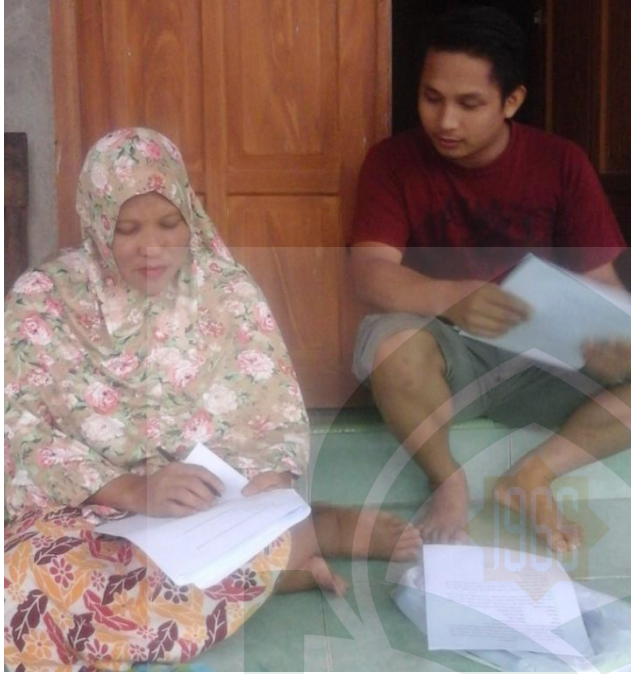
Pengisian kuesioner oleh responden