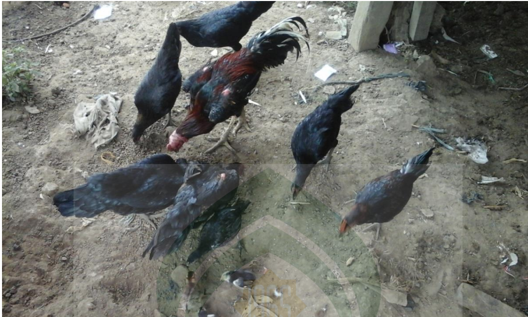
Cara pemberian pakan ayam buras