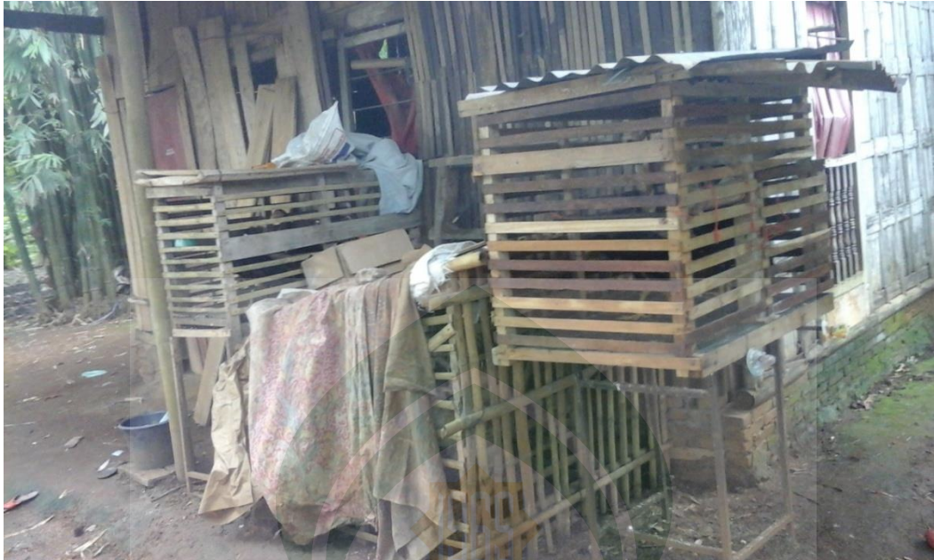
Bentuk kandang salah satu peternak

UNIVERSITAS ISLAM NEGERI ALAUDDIN M A K A S S A R