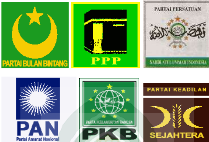
Gambar 6 : Visualisasi Lambang-lambang Partai Politik Islam yang Menjadi Peserta Pemilu 2004-2009