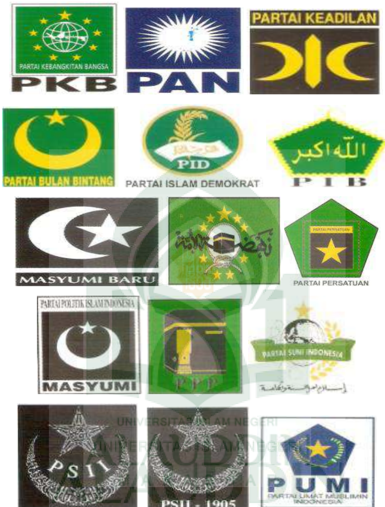
Gambar 5 : Visualisasi Lambang-lambang Partai Politik Islam yang Menjadi Peserta Pemilu 1999.