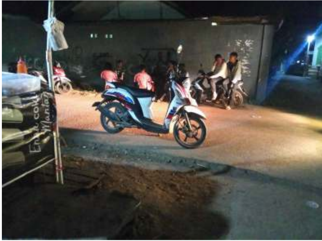
Tempat kumpul remaja di BTN Bumi Samata Permai Gowa