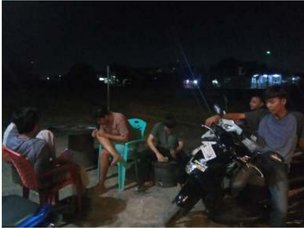
Tempat kumpul remaja di BTN Bumi Samata Permai Gowa