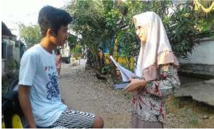
Wawancara bersama Alling remaja SMA. 27 April 2018.