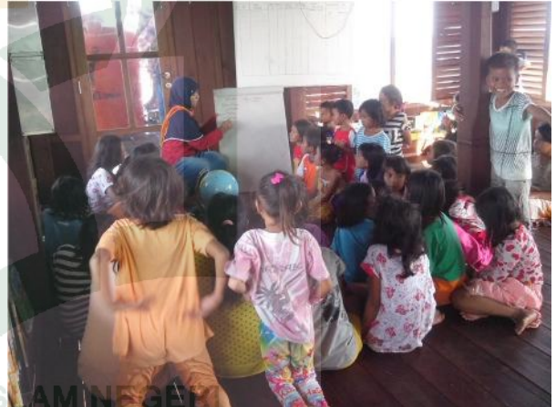
Anggota Pramuka Laut sedang belajar baris berbaris dan belajar di Learning center