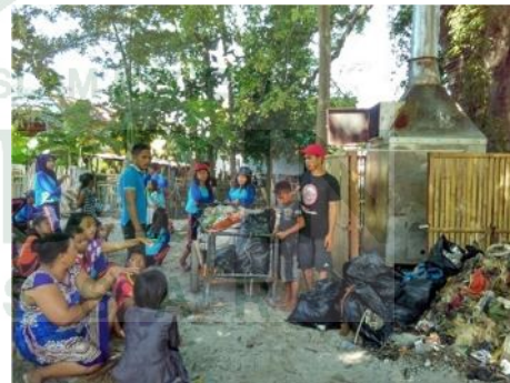
Peringatan hari sampah Indonesia, para pramuka laut berkeliling pulau mengkampanyaekan pentingnya menjaga lingkungan serta memungut sampah