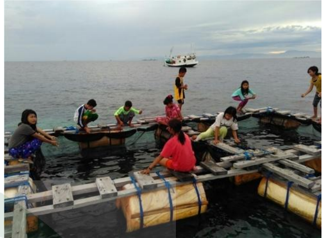
Anggota Pramuka Laut sedang belajar Hidroponik di Green House dan budidaya ikan di Keramaba Jaring Apung (KJA)