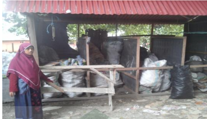
Foto lokasi bank Sampah Di Pulau Badi