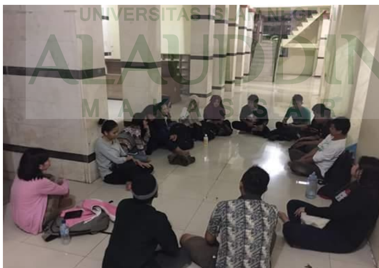
SR bersama di Mesjid Kampus 1 UIN Alauddin Makassar, tanggal 24 April 2016