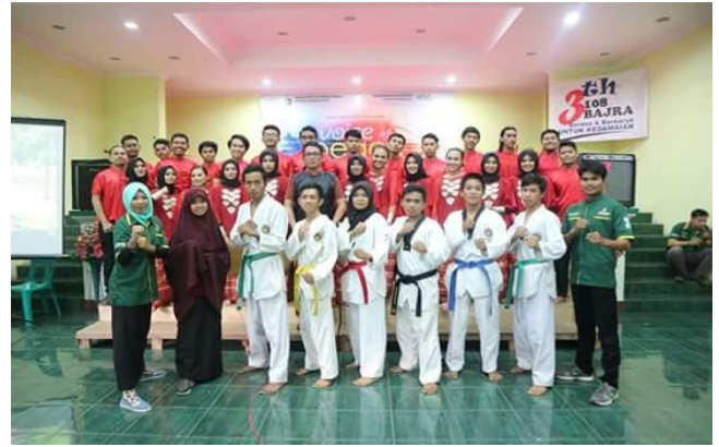
Foto bersama usai kegiatan Voice of Peace di Gedung Kantor Advent jln. Racing center pada tanggal 4 Juni 2018