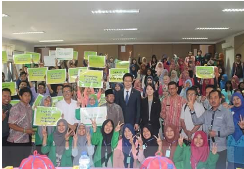
Seminar tentang Perdamaian di kalangan Remaja di LT Fakultas Ushuluddin