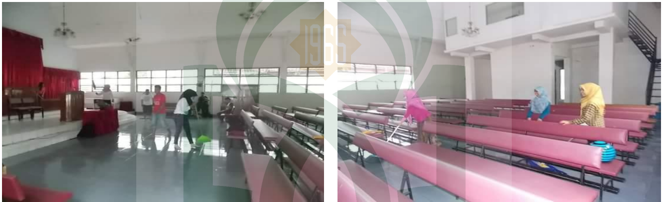
Foto Membersihkan Gereja Masehi Advent Hari ke Tujuh di jalan Sunu Kota Makassar tanggal, 11 April 2016