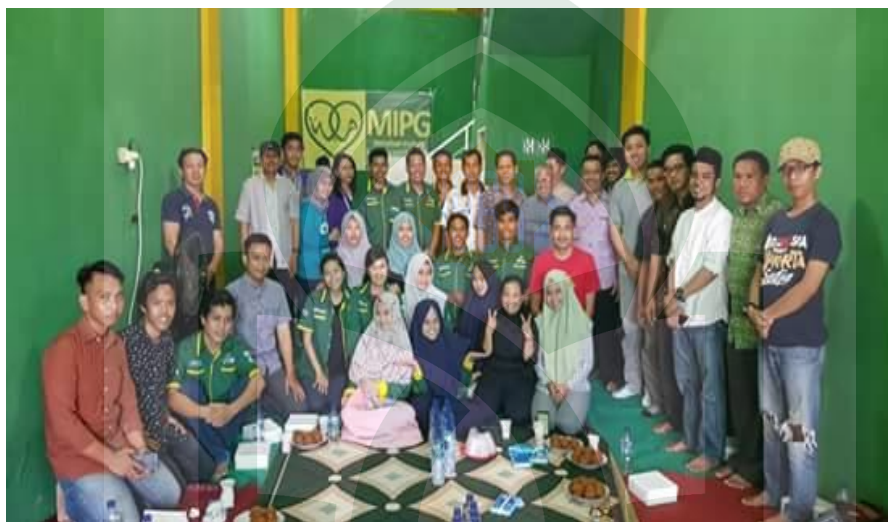
Foto bersama usai Peresmian Sekret Baru MIPG di Ruko Balang Tonjong no. 28 G, pada tanggal 30 April 2018.