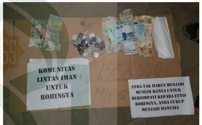
Galang dana di perempatan Jln. Andi Pettarani untuk saudara yang ada di Rohingya pada tanggal 16 September 2018.