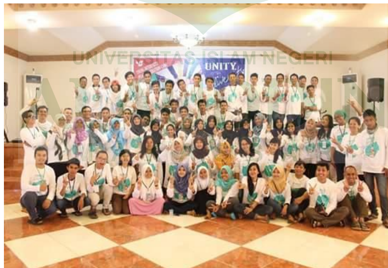
Foto bersama peserta Peace Camp di Pantai Galesong-Takalar pada tanggal 25-27 Agustus 2017