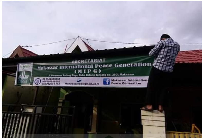
Sekretariat MIPG yang lama di Antang, Kec. Manggala Kota Makassar