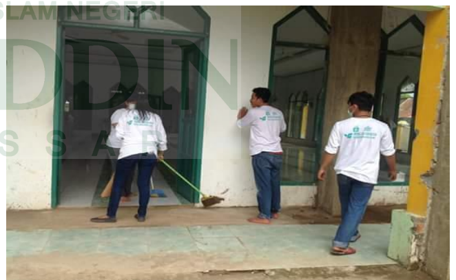
Foto Membersihkan Mesjid Al-Amin di dekat Pantai Galesong-Takalar pada tanggal 27 Agustus 2017.