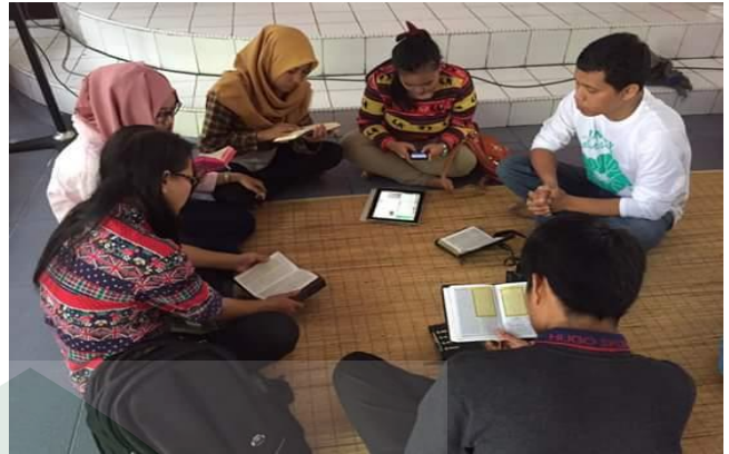
Foto kegiatan SR Mahabbah Institute for Peace and Goodness di Gereja Masehi Advent Hari ke Tujuh di jalan Sunu 11 April 2016