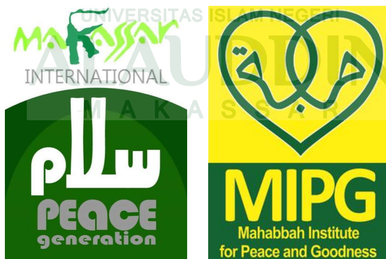
Logo MIPG yang lama dan baru.