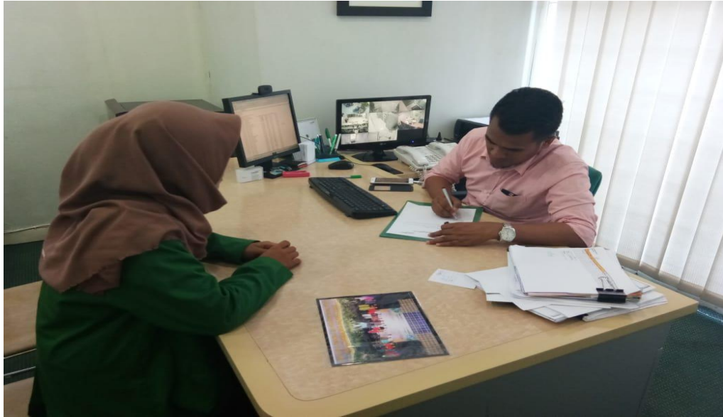
Gambar. 1 wawancara Branch Manager Bank Syariah Mandiri KCP Polewali Mandarss