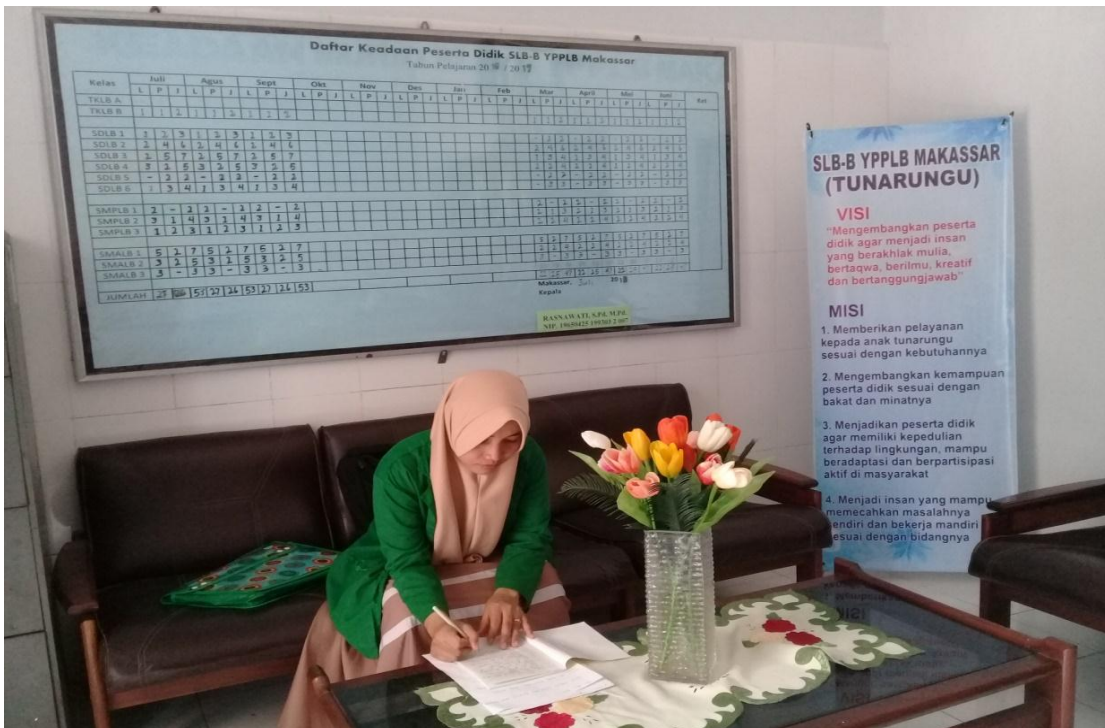
Kondisi Ruang Kantor Sekolah SLB-B Yayasan Pendidikan Luar Biasa (YPPLB)