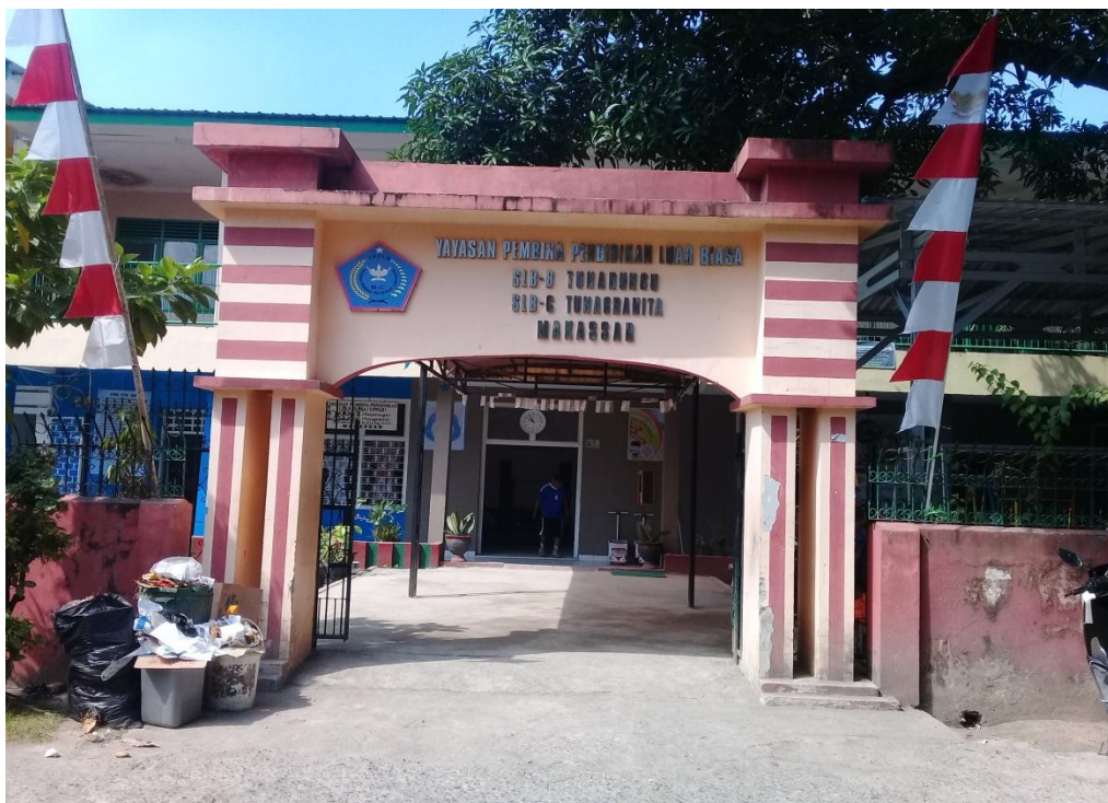
Gerbang Masuk atau Papan Pengenalan Sekolah SLB-B Yayasan Pendidikan Luar Biasa (YPPLB)