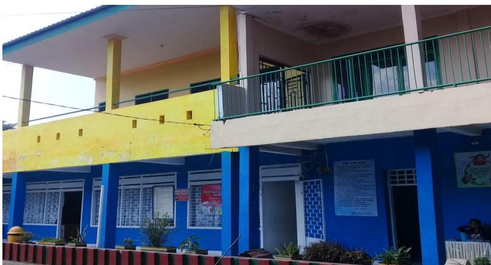
Gedung Sekolah SLB-B Yayasan Pendidikan Luar Biasa (YPPLB)