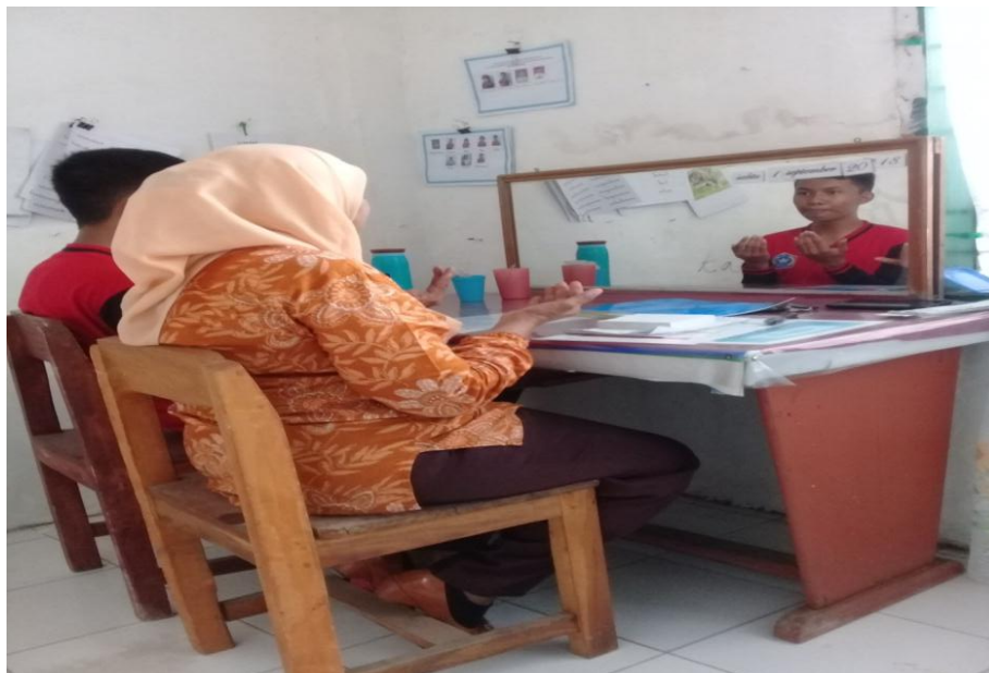
Prakter Berdoa Sebelum Belajar