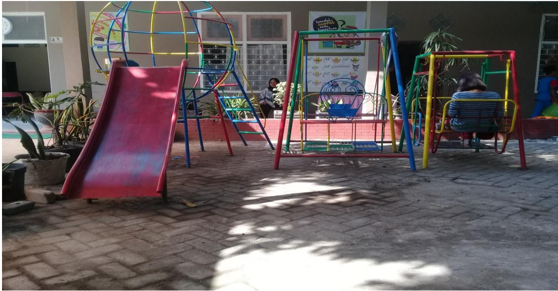
Taman Permainan Sekolah SLB-B Yayasan Pendidikan Luar Biasa (YPPLB)