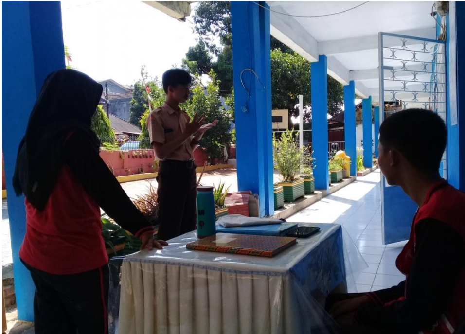
Dokumentasi Saat berkomunikasi Sesama Teman