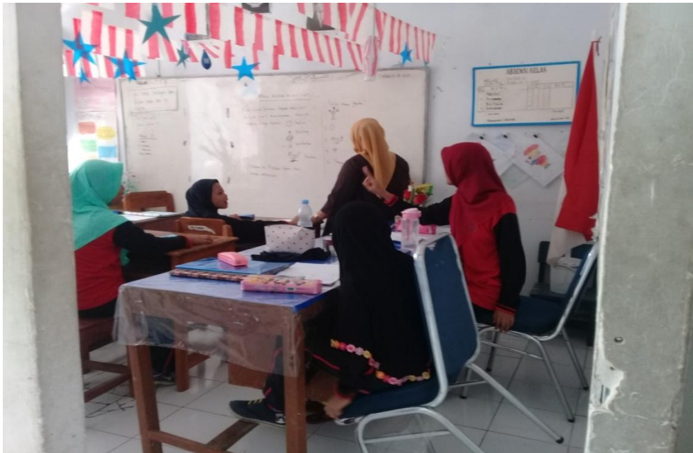
Dokumentasi Suasana Proses Belajar Mengajar