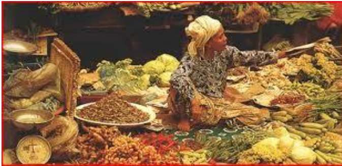
Gambar 3. Seorang ibu yang sedang menjajakan dagangan sayuran dan bumbu dapur di pasar tradisional