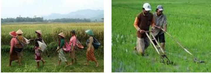
Gambar 1. Sekelompok perempuan bersiap memanen padi dan dua orang laki-laki membajak sawah.

membajak sawah dan memelihara ternak dan pekerjaan khusus perempuan seperti menanam dan memanen hasil pertanian seperti pada gambar di bawah ini.