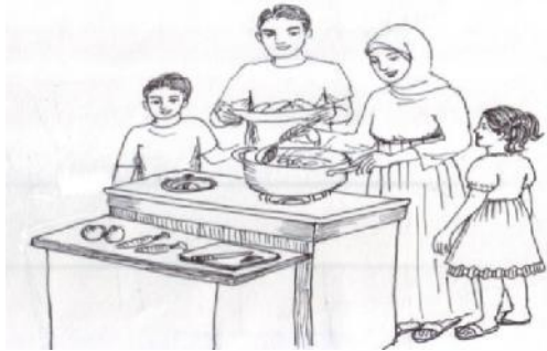
Gambar 4. Sebuah keluarga yang terdiri dari ayah, ibu, dan dua orang anak sedang bekerja sama mempersiapkan makanan di dapur

Oleh sebab itu, negara perlu mendorong dilakukan kajian terhadap hambatan dan tantangan dalam mengedepankan nilai-nilai budaya dan norma masyarakat yang luhur terhadap budaya serta sumber-sumber nilai budaya seperti filsafat atau pandangan budaya, termasuk pandangan budaya yang didasarkan pada pemahaman ajaran agama.