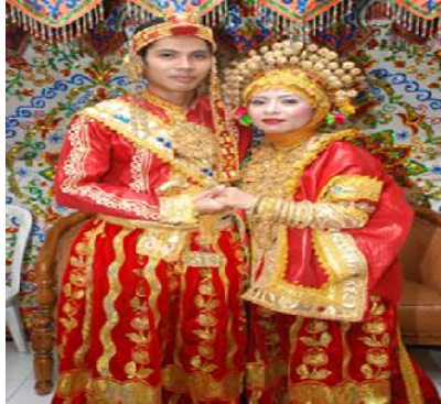
Gambar 5. Pengantin laki-laki dan perempuan dalam busana adat Bugis Makassar

Jadi sikalaibine berarti saling mengambil antara laki-laki dan perempuan.