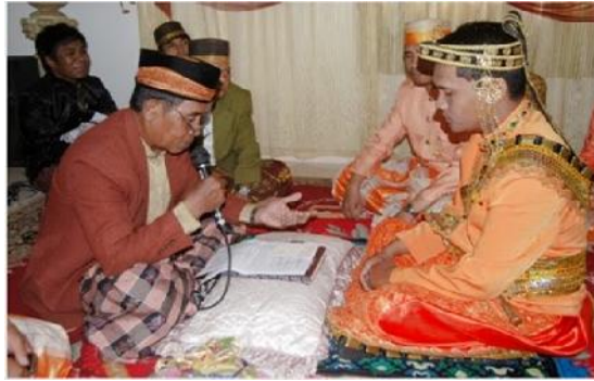
Gambar 6. Prosesi Akad Nikah dalam Tradisi Bugis-Makassar