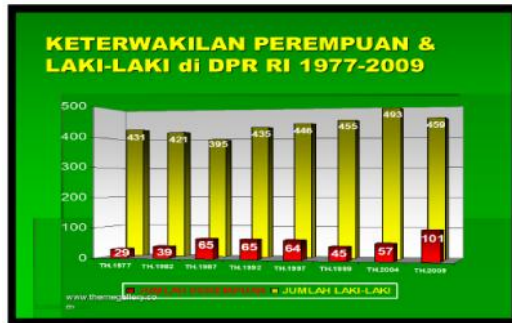
Diagram 1. Persentase Keterwakilan Perempuan di DPR RI 1977-2009

Keterwakilan politik berbasis gender di atas menunjukkan ketertinggalan perempuan jauh dari laki-laki. Keterwakilan perempuan di DPR Sulawesi Selatan tahun 2009 juga sangat sedikit yaitu hanya 13,94%. Hal ini bisa dilihat pada chart berikut ini