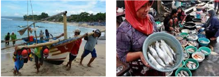
Gambar 2. Kaum laki-laki sedang mendorong perahu ke pinggir pantai setelah melaut dan Kaum perempuan sedang menjajakan dagangan ikan di pasar