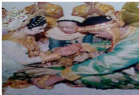
Gambar 7. Prosesi Pernikahan Mappasikarawa didampingi oleh Indobotting