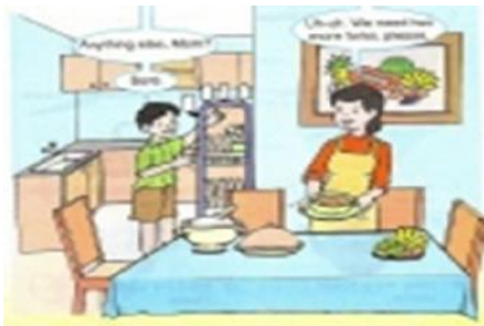
Gambar 8. Peran perempuan dalam rumah tangga dalam persepsi umum

Pada dasarnya, budaya masyarakat Bugis Makassar memiliki norma-norma pembagian peran laki-laki dan perempuan. Apabila masing-masing pihak laki-laki dan perempuan menjalankan peran mereka sesuai dengan norma, maka akan tercipta kerukunan dan kedamaian di dalam rumah tangga. Suami berperan sebagai pangulu bola (Bugis: kepala rumah tangga) dan sebagai passappa dallé (Bugis: pencari nafkah untuk keluarga). Karena peran laki-laki sebagai pencari nafkah, maka laki-laki yang akan menikah disyaratkan mampu " mattuliliwi dapureng wékka pétu " (Bugis: mengelilingi dapur tujuh kali, Idrus: 2003). Ini berarti laki-laki wajib memiliki kemampuan untuk mengepulkan asap dapur keluarganya, dan di samping berkewajiban pula memenuhi kebutuhan-kebutuhan lainnya.