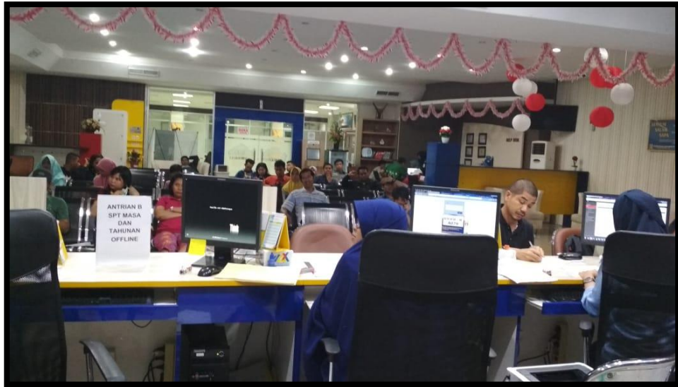
GAMBAR 4.5 Pegawai Pajak Seksi Pelayanan Melayanai Wajib Pajak di TPT

masih banyak dari mereka yang kurang peduli dengan pajak dan cenderung mengacuhkan fungsi dari sadar akan pajak.