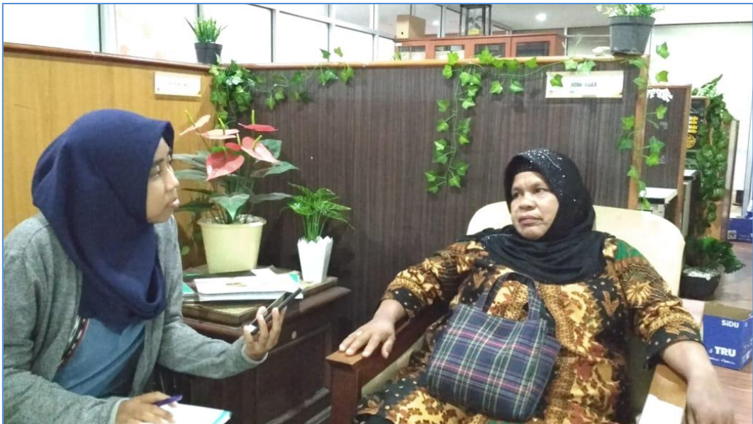
Wajib Pajak di KPP Pratama Makassar Selatan