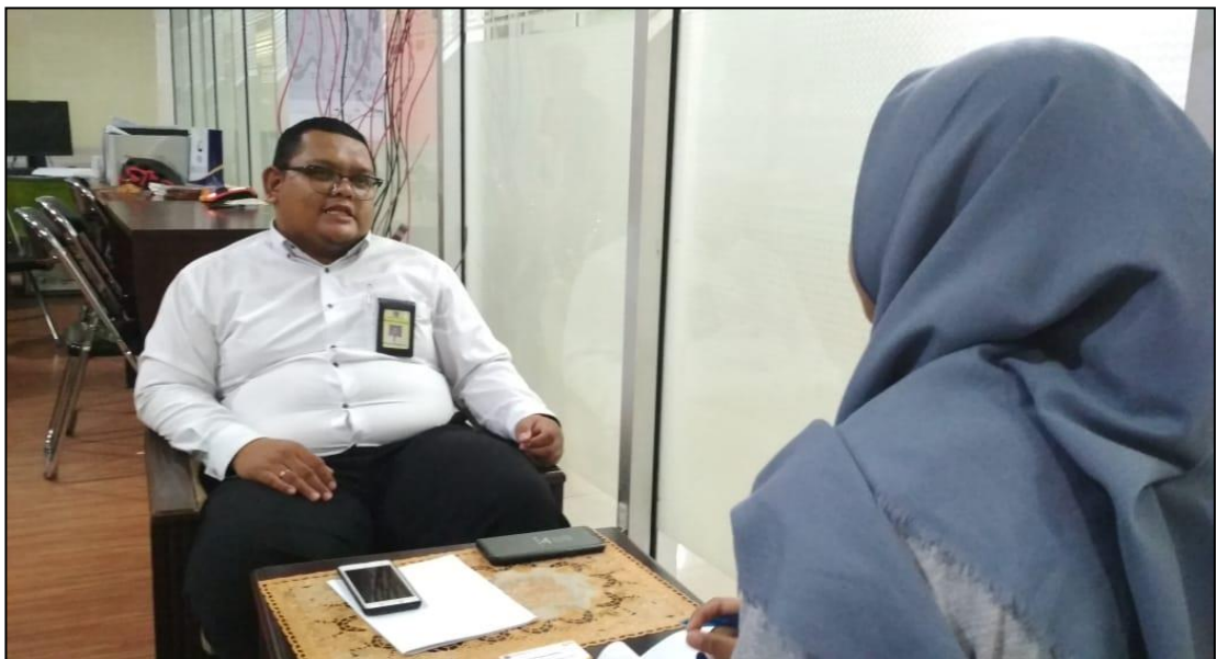
Pegawai KPP Pratama Makassar Selatan Seksi Ekstensifikasi ( account representative )