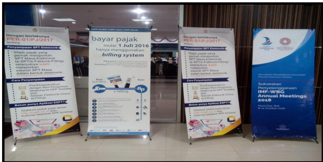
GAMBAR 4.7 BANNER

Pesan adalah susunan simbol yang penuh arti tentang orang, objek, kejadian yang dihasilkan oleh interaksi dengan orang. Pengkalsifikasian pesan menurut bahasa dapat pula dibedakan atas pesan verbal dan pesan nonverbal. Klasifikasi pesan menurut penerima dapat dibedakan menjadi dua yaitu pesan internal dan eksternal. Klasifikasi pesan yang terakhir adalah berdasarkan tujuan dari pengirim dan penerima pesan.