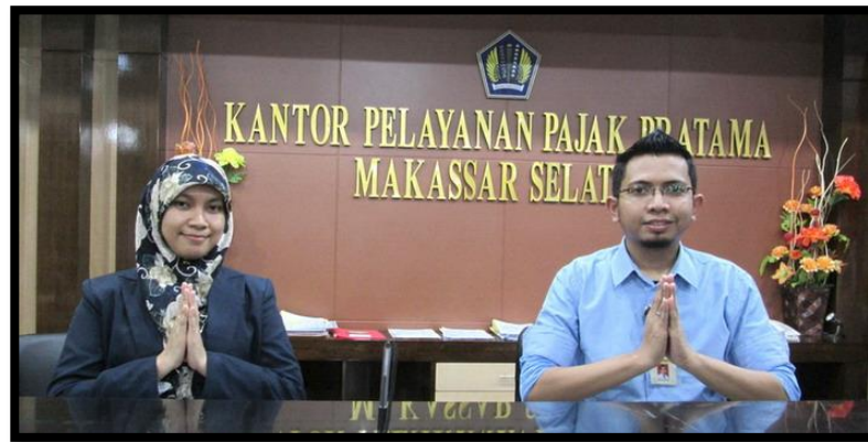
GAMBAR 4.8 SEKSI PELAYANAN (SENYUM SAPA SALAM)