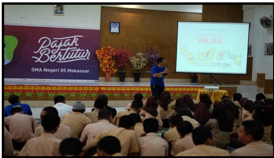
GAMBAR 4.2 PROGRAM SADAR PAJAK (PAJAK BERTUTUR)

menentukan lokasi mengajar secara bebas dan jumlahnya, materi yang disesuaikan dengan jenjang pendidikan peserta, sedangkan materi telah disediakan oleh kantor pusat serta dapat dikembangkan oleh unit kerja dengan kearifan lokal masing-masing.