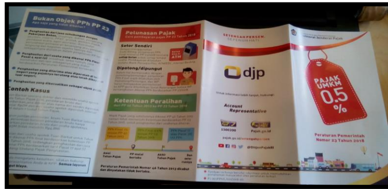
GAMBAR 4.6 FLYER

Semua dibuat kreatif dan se-inovativenya agar dapat dipahamai secara langsung, khalayak sasaran menjadi tidak terlalu sulit dalam menangkap pesan-pesan yang di sampaikan oleh KPP Pratama Makassar Selatan.