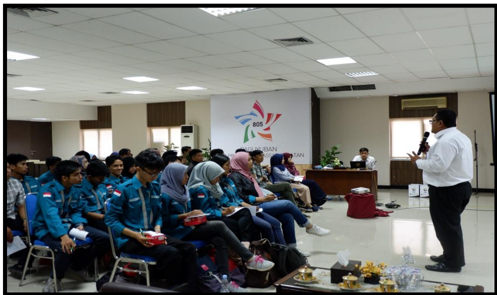
GAMBAR 4.3 PENGENALAN PAJAK KE MAHASISWA

Selain dari pajak bertutur yang sasaran khalayaknya adalah siswa/i dan mahasiswa/i juga kedepannya, tidak lagi menjadi suatu program sadar pajak yang hanya dilakukan dalam setahun sekali. Namun, kedepannya pajak akan menjadi suatu pembelajaran di kalangan siswa/i dan mahasiswa/i yang rutin dilaksanakan seperti mata pelajaran umum lainnya. Jadi DJP akan bekerjasama dengan kementerian pendidikan guna mewujudkan program sadar pajak yang dicanangkan akan ditargetkan pada tahun 2045 yaitu generasi emas indonesia yang cerdas dan sadar pajak.