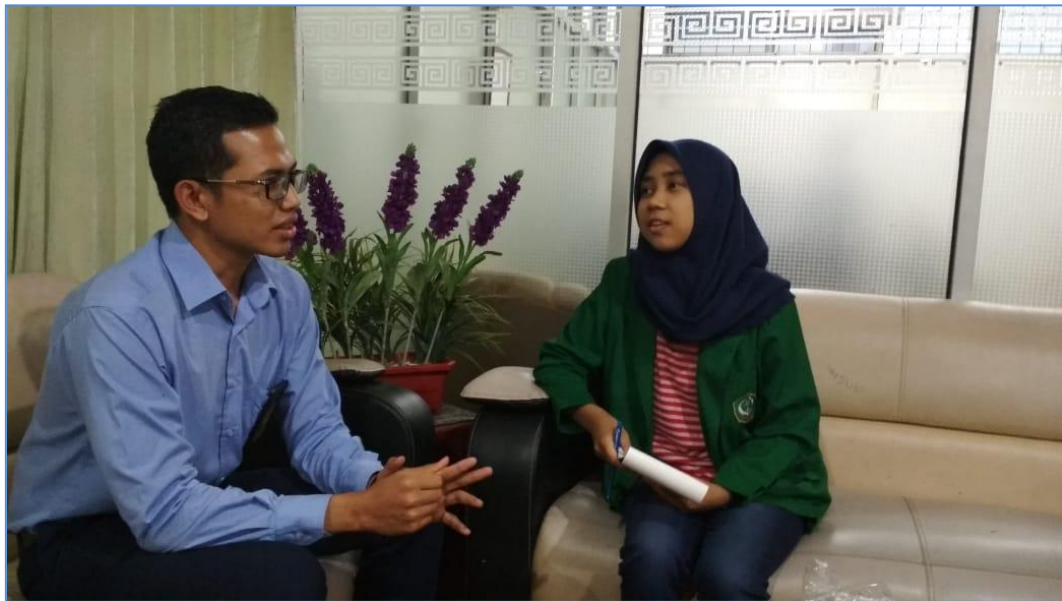
Pegawai KPP Pratama Makassar Selatan Seksi Pelayanan