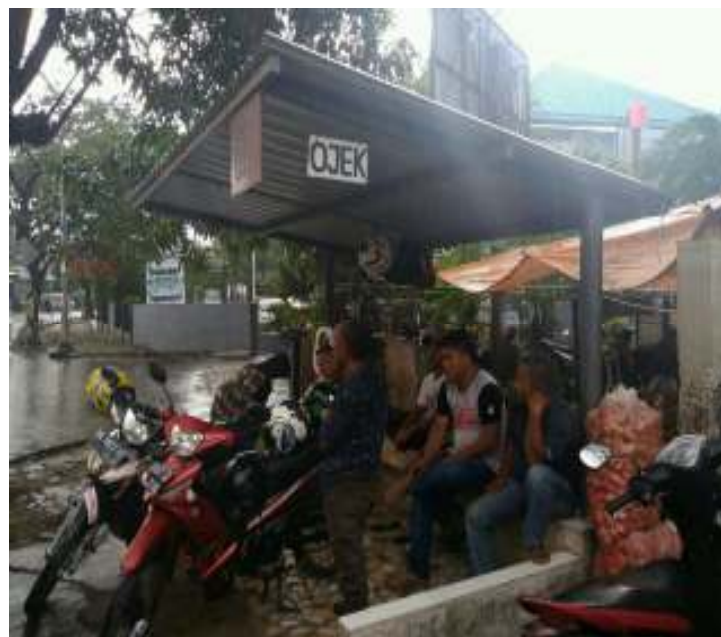
Wawancara dengan para tukang ojek di pangkalan ojek pada tanggal 1 Mei 2018