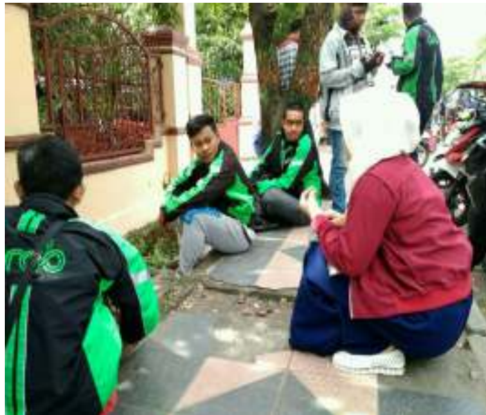
Wawancara dengan para driver ojek Online di makassar pada tanggal 26 April 2018