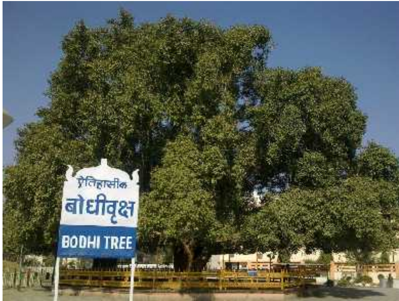
Gambar 1. Pohon Bodhi di Bodhgaya

kembali, dan merupakan salah satu pemandangan yang terindah dari reruntuhan ibukota itu.