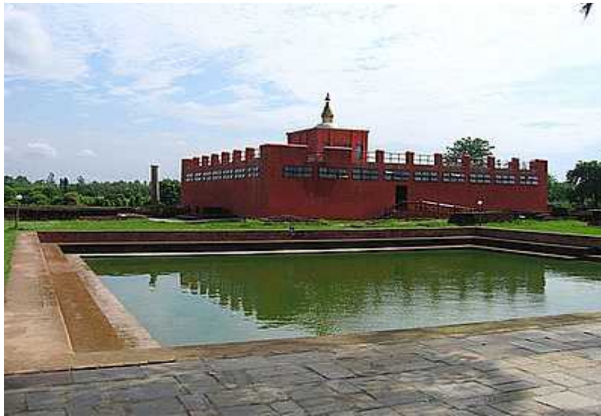
Gambar 13. Taman Lumbini di India