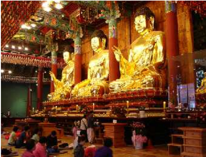
Gambar 5. Patung Jogyesa di Korea Selatan

Agama Buddha masuk ke Korea bersama-sama dengan tulisan-tulisan Tionghoa sekitar 372 M. Sekalipun agama Buddha dapat berkembang selama beberapa abad, namun tidak dapat meresap sepenuhnya kedalam kehidupan rakyat. Ketika pada abad 13 M. Suatu arus reaksi Konfusianisme melanda Korea dari Tiongkok, kalangan istana di Korea dengan cepat beralih kepada filsafat yang baru ini. Pemuka-pemuka Buddhis tidak dapat membendung arus yang populer ini, sehingga sejak saat itu agama Buddha mulai mengalami kemunduran. Dewasa ini tinggallah aliran Zen yang dinamis itu yang masih bertahan.