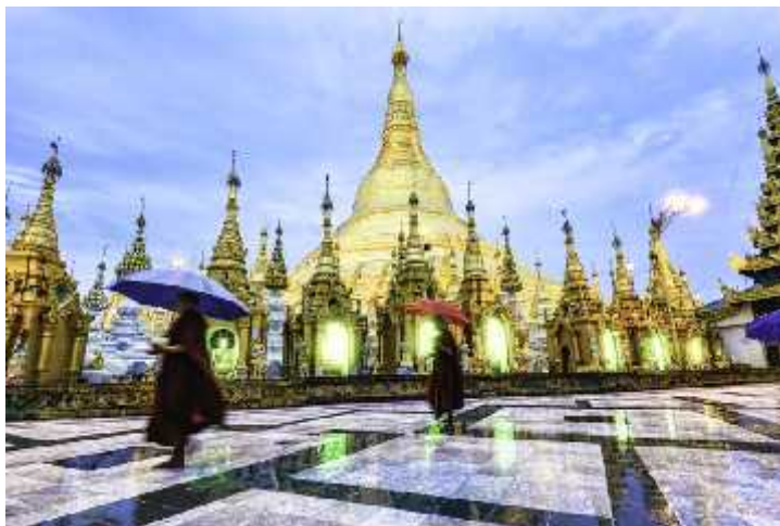
Gambar 2. Pagoda Swadagon di Birma

Sejarah permulaan Agama Buddha di Birma tidak banyak diketahui orang. Agaknya Birma telah mengenal Agama Buddha sejak zaman Asoka, yang menurut hikayat Ia mengirimkan duta-dutanya ke "Survdarnabhumi" yang disebut (negeri Emas; Birma). Penyebaran agama Buddha ini berlangsung melalui darat dan laut