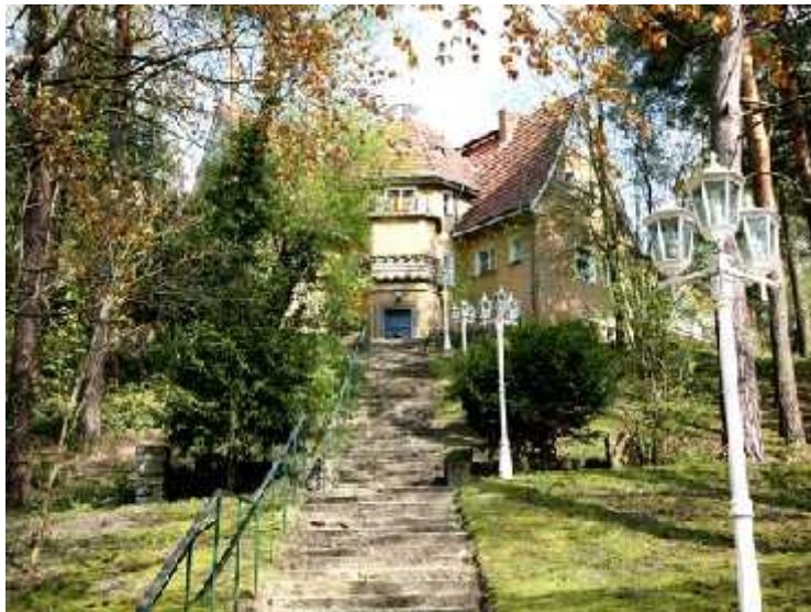
Gambar 12. Kuil Buddhistisches Haus di Berlin