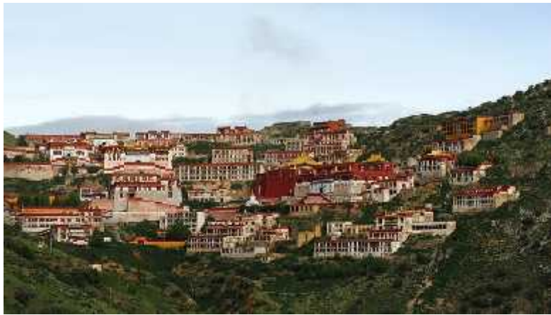
Gambar 7. Biara Garden di Tibet

yang memuja Siwa dan kekuatan feminismenya / sakti ( suatu bentuk ibadah dilingkungan kerajaan Bengal India.