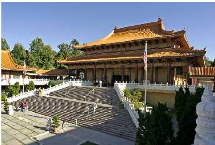
Gambar 10. Kuil Hsi Lai di Amerika

Hawaii merupakan tempat yang memegang peranan penting bagi Buddhisme. Para missioner yang berasal dari Jepang dikatakan sangat aktif, walaupun para missionaris Kristen berusaha mengembangkan agama Kristen di Cina dan di Jepang, dilain pihak Jepang dan Cina berusaha mengembangkan Buddhisme di Amerika. Bahkan upacara Kristen mulai dipengaruhi oleh cara meditasi Buddhisme. Banyak orang kulit putih yang mulai masuk menjadi penganut agama Buddha. Dengan berkembangnya komunikasi, Buddhisme ikut memanfaatkan kesempatan untuk mengaktifkan diri.