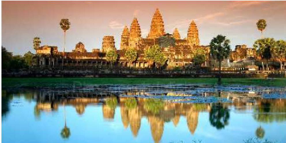
Gambar 3. Candi Angkor War