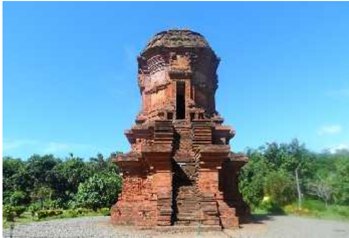
Gambar 9. Candi Jabung