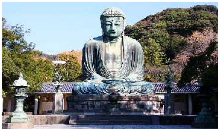
Gambar 6. Patung Buddha Kamakura

Buddhisme masuk dari Korea ke Jepang pada tahun 552 M. Pada mulanya memang terdapat perlawanan dari kalangan tertentu, sekalipun tidak begitu hebat. Tetapi kemudian dibawah Pangeran Shotoku Taishi ( abad 6~7 M), Buddhisme berkembang dengan pesat, oleh karena Pangeran ini bertindak sebagai pelindung, dan pemimpinnya. Dalam mengembangkan agama Buddha di Jepang Pangeran ini dapat di sejajarkan dengan Raja Asoka dari India pada abad ke~3 SM. Didirikannya kota Nara dan kuil Heryuji pada tahun 607 M., yang merupakan kuil tertua dan masih berdiri hingga sekarang. Arsitektur kuil ini menjadi pola bagi kuil-kuil Jepang selanjutnya.