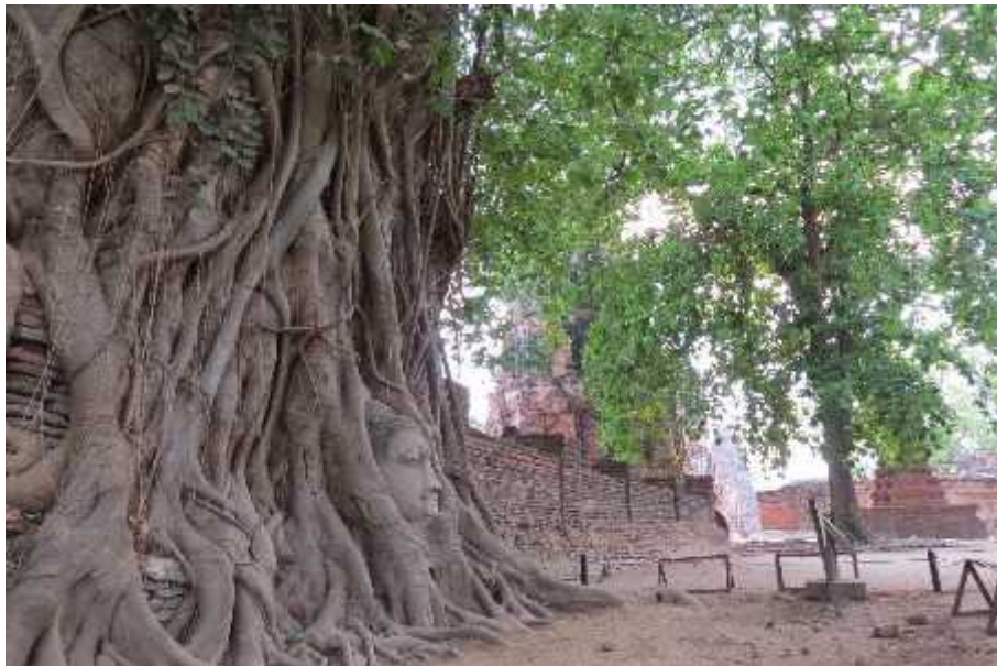
Gambar 14. Gambar Kepala Budha di Pohon Bodhi