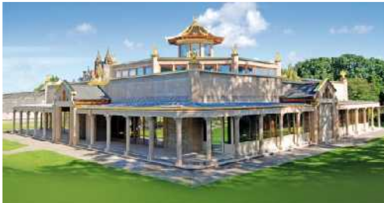
Gambar 11. Kuil Buddha Kadampa di Inggris

Penyebaran Buddhisme di Inggris tidak lepas dari kolonialisme Inggris di India. Pada saat itu banyak orang Inggris, khususnya para sarjana, penyair dan kaum cendekiawan menjadi pendukung agama-agama dan tradisi India, terutama pada saat penindasan atas gerakan kemerdekaan. Pada masa awal pendudukan Inggris, kaum cendekiawan Inggris berusaha menyelamatkan kebudayaan dan memelihara tradisi India, di mana Buddhisme termasuk di dalamnya.