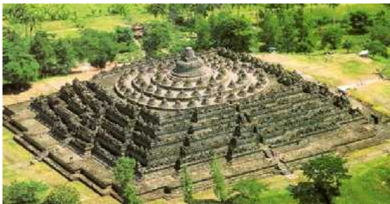
Gambar 8. Candi Borobudur di Jawa Tengah

Salah satu bukti nyata bahwa agama Buddha itu telah mendarah-daging dalam sanubari bangsa Indonesia, ialah bahwa hingga kini masih tetap berdiri megah, arif agung candi Borobudur, lambang kebesaran agama Buddha di Indonesia. Jika kita meninjau candi Borobudur sebagai candi Buddhis, maka biarpun sepiantas kita tak dapat melupakan adanya candi Prambanan sebagai candi Siwa dari agama Hindu, yang disebut juga candi Rara Jonggrang.