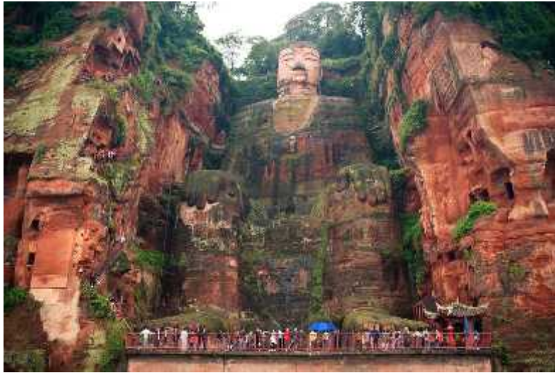
Gambar 4. Patung Buddha Raksasa Leshan di Tiongkok