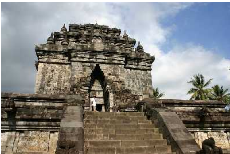
Gambar 15. Candi Mendut