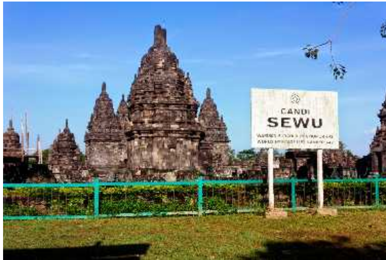
Gambar 16. Candi Sewu