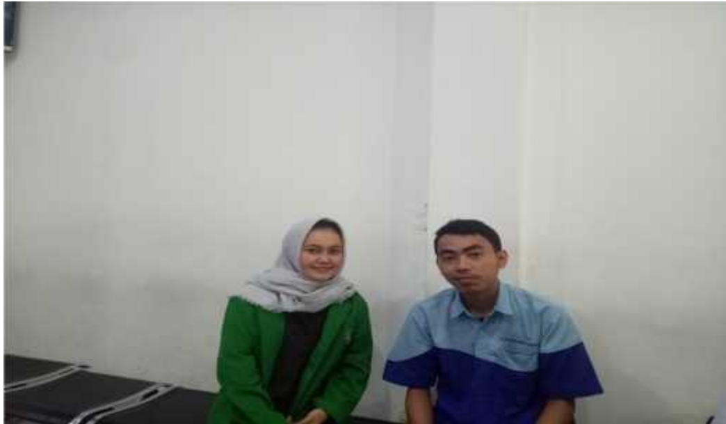
5. Foto bersama Nasabah PT. Bank Rakyat Indonesia (persero) Tbk. Unit Batua Raya