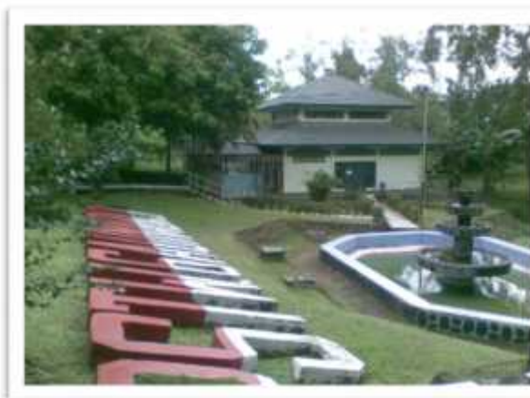
Gambar 3. Mushallah PSTW Gau Mabaji Gowa