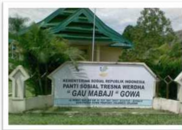
Gambar 1. Kantor PSTW Gau Mabaji Gowa