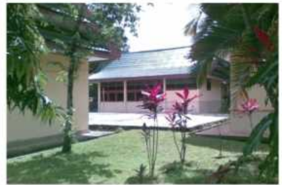
Gambar 2. Suasana Lingkungan PSTW Gau Mabaji Gowa