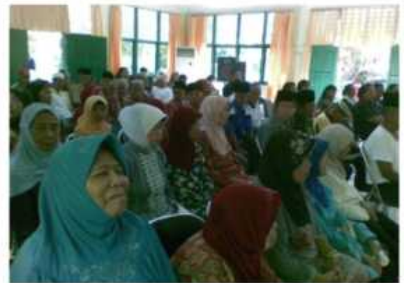
Gambar 4. Kegiatan Sosial Lansia PSTW Gau Mabaji Gowa