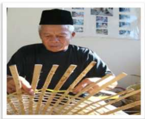
Gambar 8. Kreativitas Lansia di PSTW Gau Mabaji Gowa