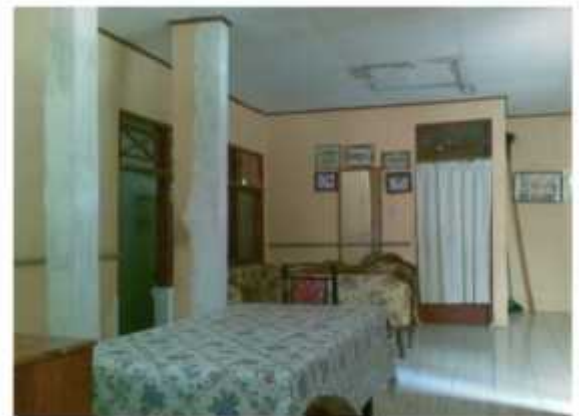
Gambar 6. Suasana Asrama Lansia di PSTW Gau Mabaji Gowa