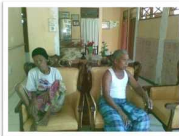
Gambar 5. Suasana Lansia di Asrama PSTW Gau Mabaji Gowa