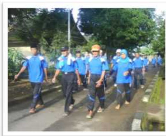
Gambar 7. Gerak jalan santai lansia PSTW Gau Mabaji Gowa