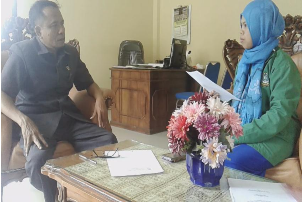
Pengadilan Agama, Wawancara , Polewali, 25 januari 2016.