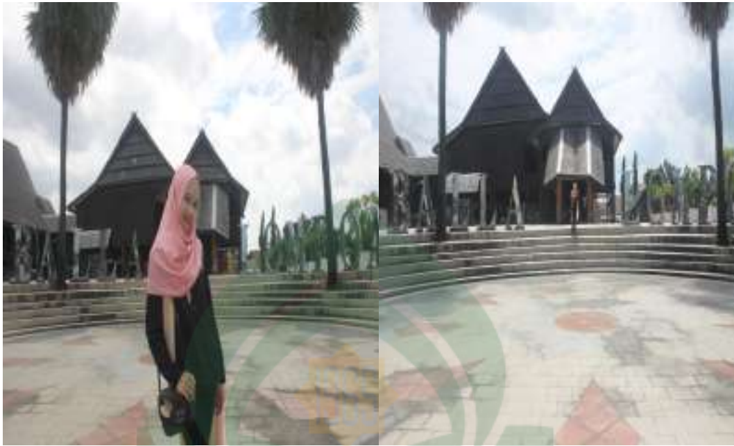
Museum Balla Lompoa (Kerajaan Gowa)