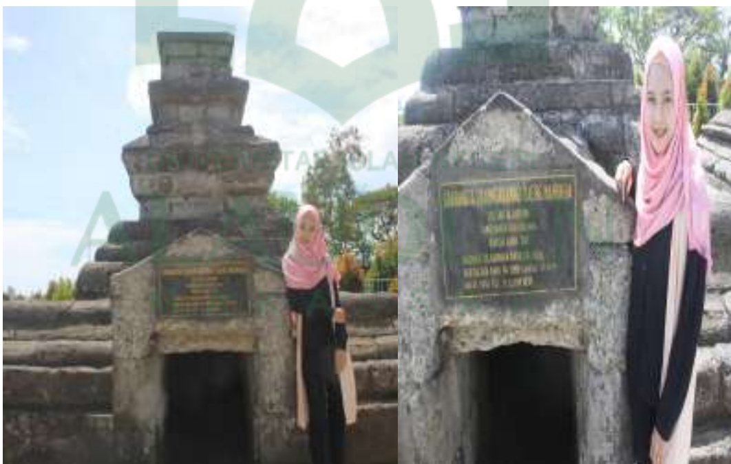
Makam Raja Gowa XIV, I Mangarangi Daeng Manrabia (Sultan Alauddin).