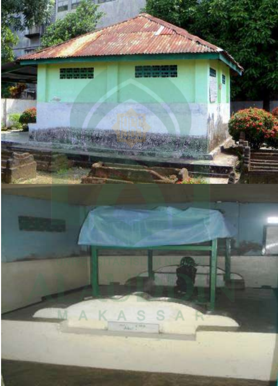
Makam Datuk ri Bandang, di Sinassara', Tallo', Kota Makassar