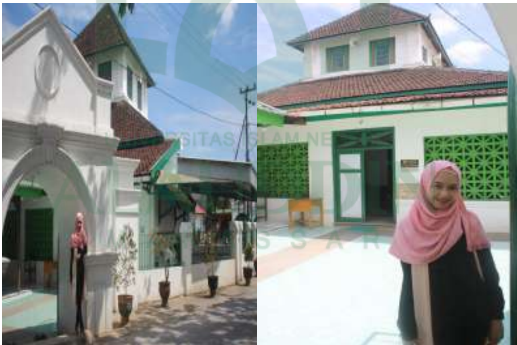
Masjid Tua Katangka