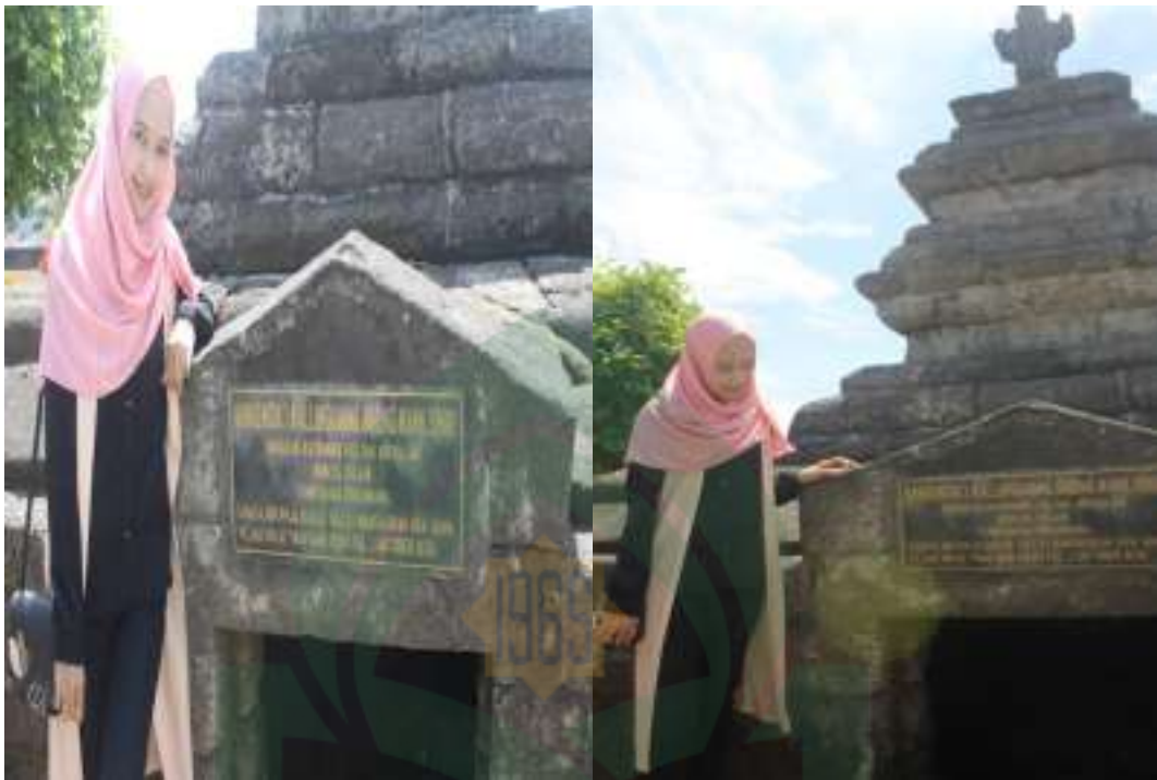
Makam Raja Tallo, I Malingkaang Daeng Manyonri (Sultan Abdullah Awwalul Islam)