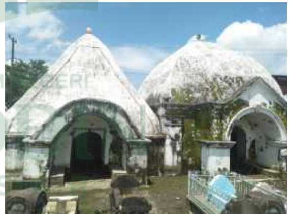
Gambar 32. Kubah Makam ke 1 dikanan dan ke 2 dikiri