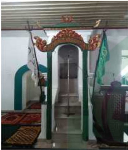
Gambar 13. Mimbar Masjid Tua Katangka