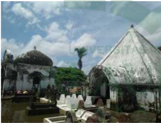
Gambar 35. Kubah Makam ke 5 dikanan dan ke 6 dikiri