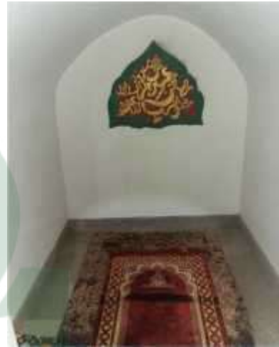
Gambar 14. Mihrab Masjid Tua Katangka