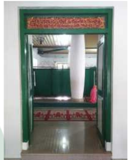
Gambar 18. Pintu Utama Bagian Selatan