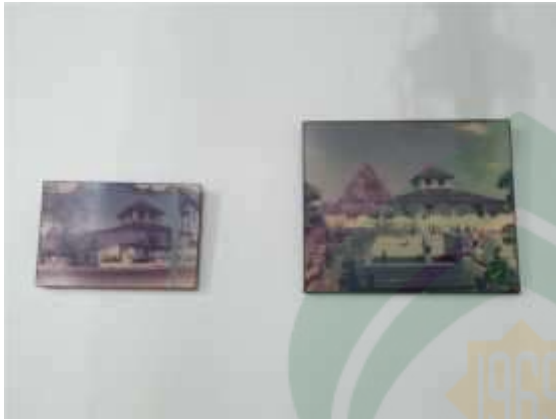
Gambar 17. Hiasan Dinding Masjid Tua Katangka