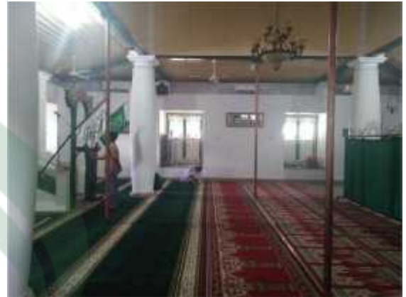
Gambar 10. Bagian Dalam Masjid Tua Al-Hilal Katangka