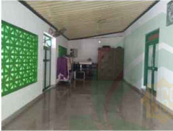
Gambar 21. Serambi Bagian Selatan