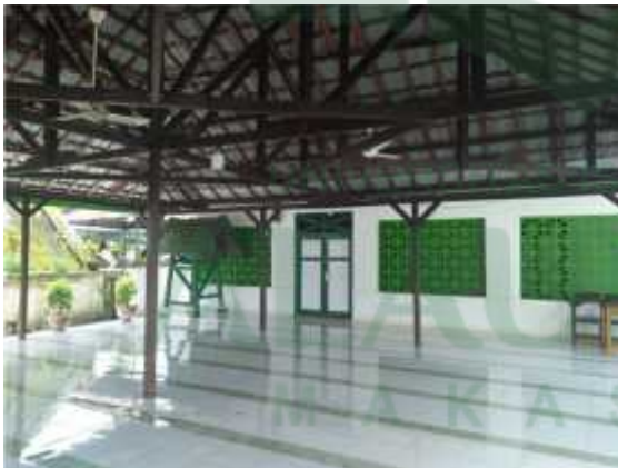
Gambar 31. Teras Bagian Timur