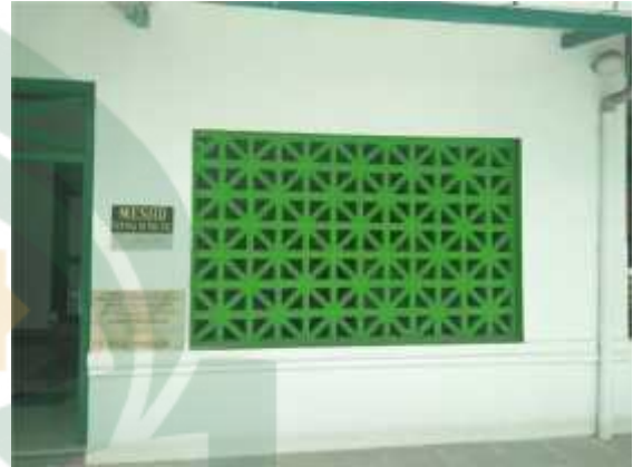
Gambar 26. Ventilasi Bagian Utara