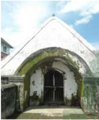
Gambar 33. Kubah Makam ke 3