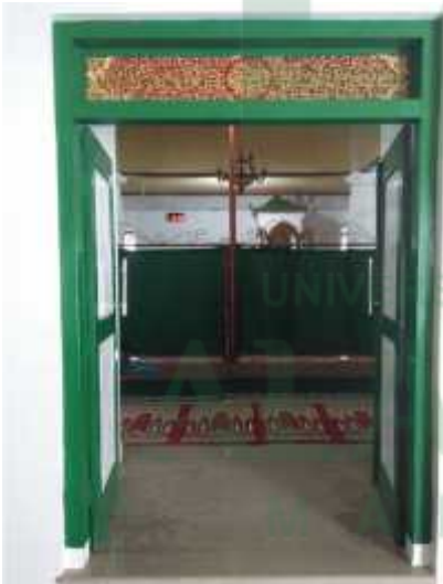
Gambar 19. Pintu Utama Bagian Tengah