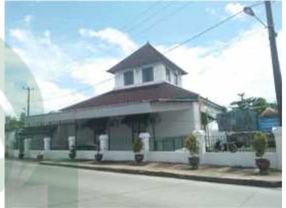
Gambar 2. Sisi Bagian Utara Masjid Tua Katangka