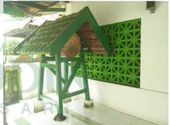
Gambar 28. Ventilasi dan Bedug Bagian Selatan