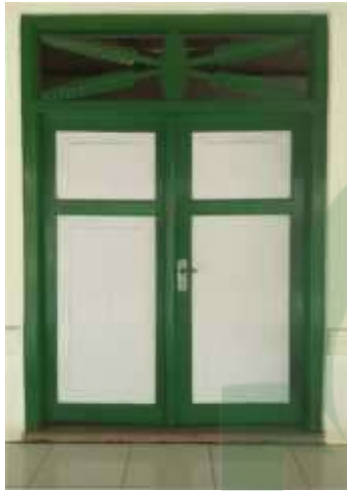
Gambar 25. Pintu Bagian Selatan Serambi