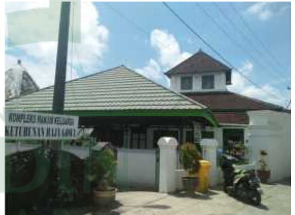
Gambar 4. Sisi Bagian Timur Masjid Tua Katangka