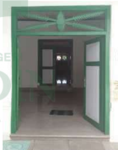
Gambar 24. Pintu Bagian Utara Serambi