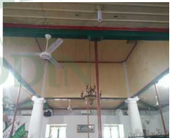
Gambar 16. Langit-langit Masjid Tua Katangka