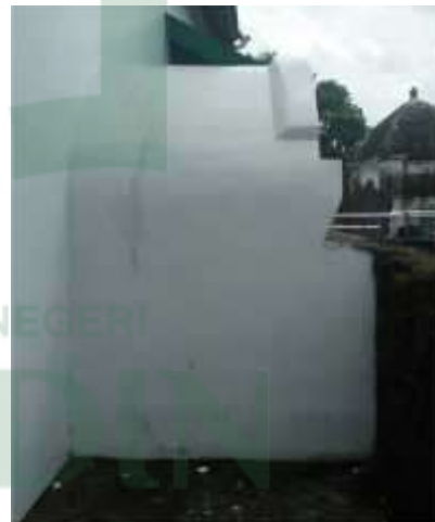
Gambar 8. Mihrab yang menjorok keluar