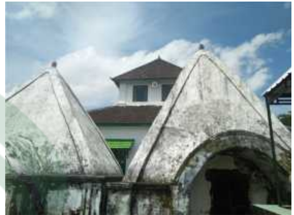
Gambar 6. Sisi Selatan Masjid Tua Katangka