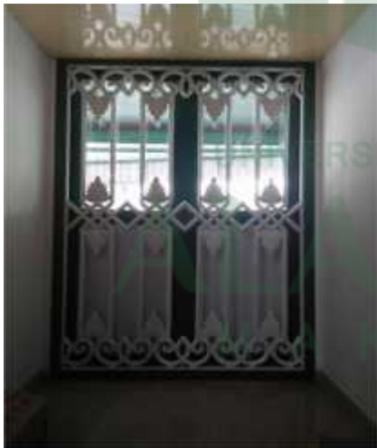
Gambar 15. Jendela Masjid Tua Katangka