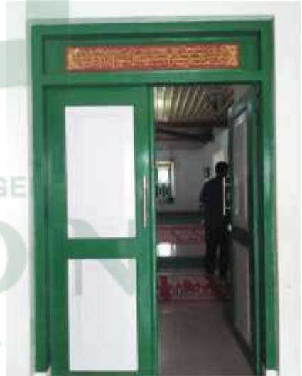
Gambar 20. Pintu Utama Bagian Utara