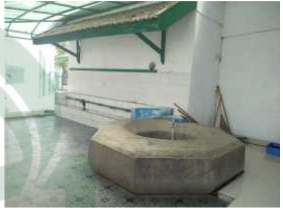
Gambar 30. Tempat Wudhu dan Sumur di Bagian Luar