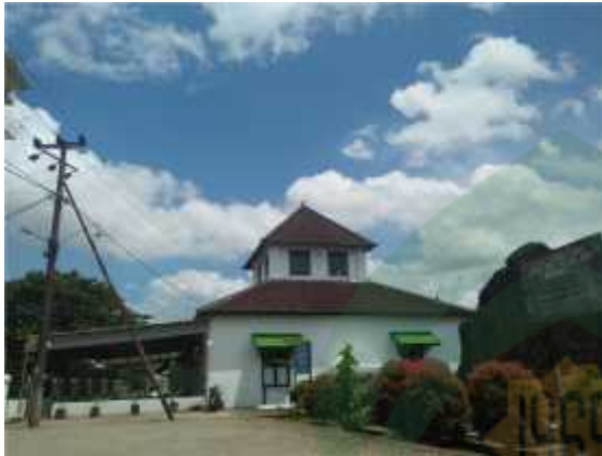
Gambar 5. Sisi Barat Masjid Tua Katangka