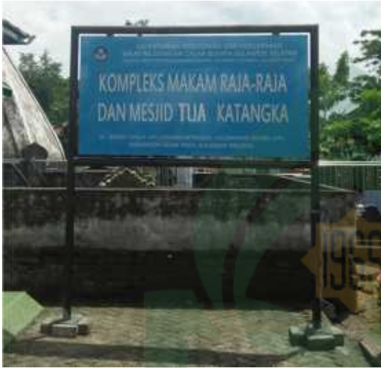
Gambar 1. Papan Informasi Masjid Tua Katangka