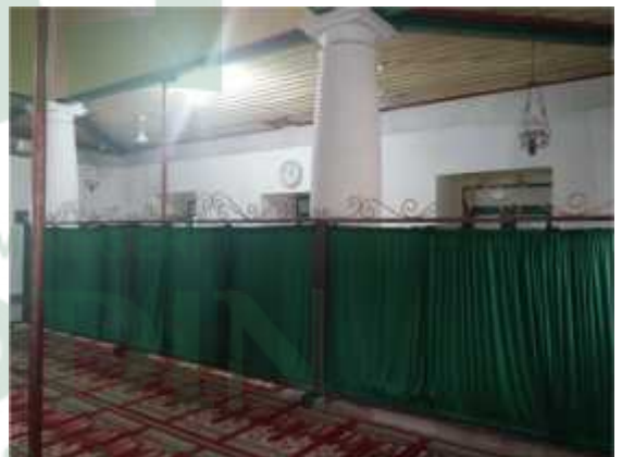
Gambar 12. Bagian Dalam Masjid Tua Al-Hilal Katangka