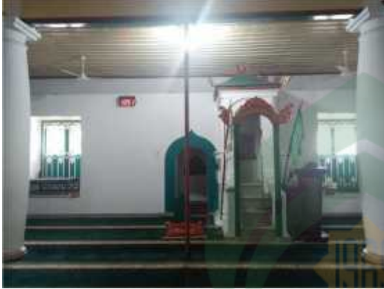
Gambar 9. Bagian Dalam Masjid Tua Al-Hilal Katangka