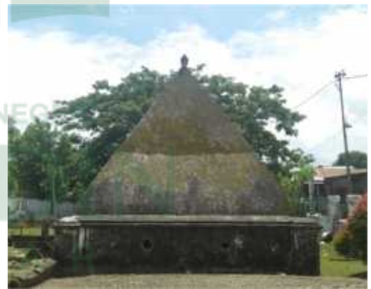
Gambar 36. Kubah Makam ke 7