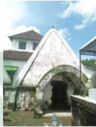
Gambar 34. Kubah Makam ke 4