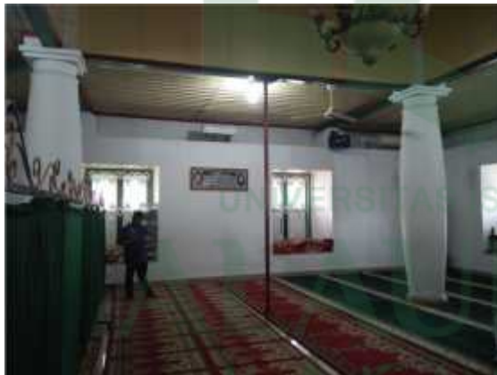
Gambar 11. Bagian Dalam Masjid Tua Al-Hilal Katangka