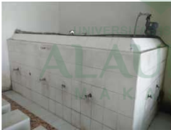
Gambar 23. Kolam Penampungan Air