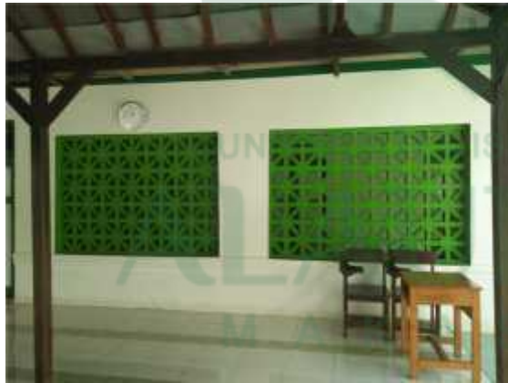
Gambar 27. Ventilasi Bagian Tengah