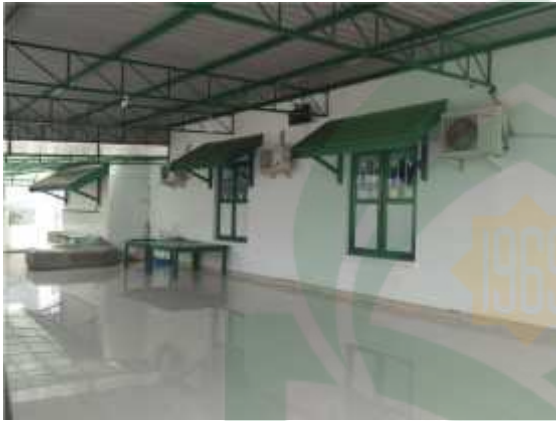
Gambar 29. Teras Bagian Utara