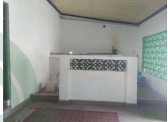
Gambar 22. Serambi Bagian Utara dan Tempat Wudhu