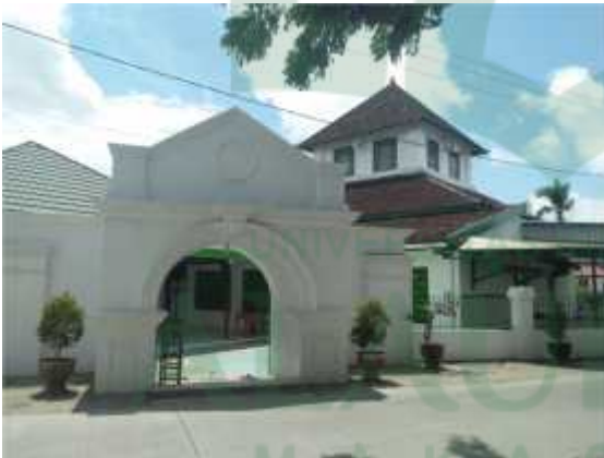
Gambar 3. Gerbang masuk Masjid Tua Katangka