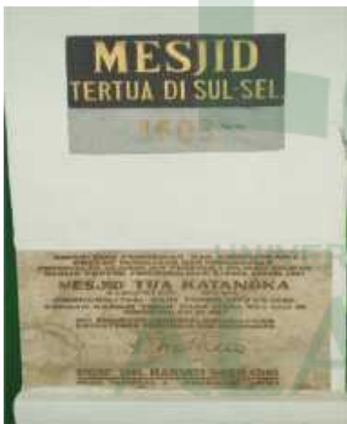
Gambar 7. Prasasti Tahun pada Tembok