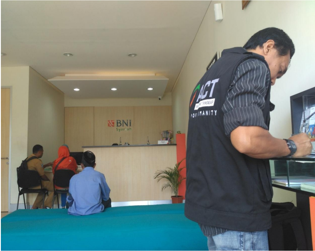
Foto Nasabah yang sedang mengisi formulir dan nomor Antrian