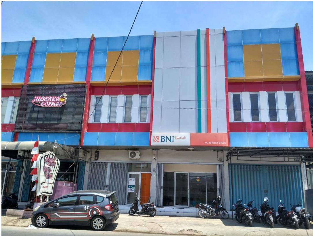
Halaman depan Bank BNI Syari'ah Kantor Cabang Mikro Bima