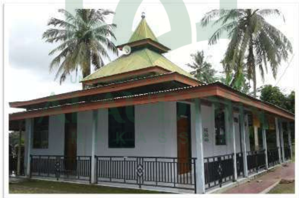
Gambar 4 : Masjid al-Mujahidin saat ini dilihat dari samping kanan.