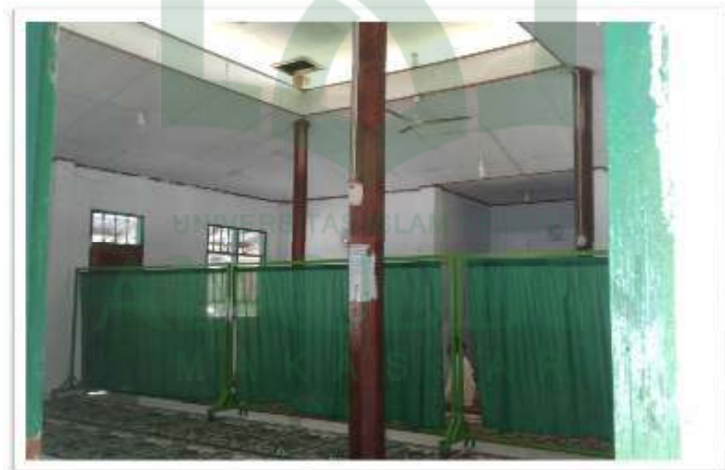
Gambar 6 : Bagian dalam Masjid al- Mujahidin saat ini.