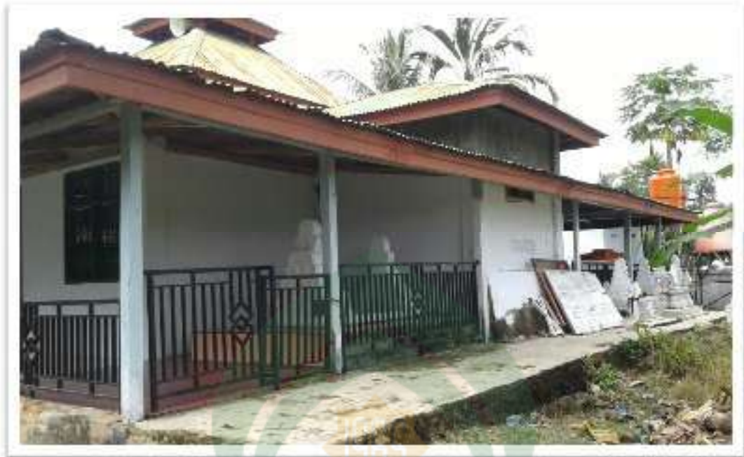
Gambar 5 : Masjid al- Mujahidin saat ini dilihat dari sisi belakang.