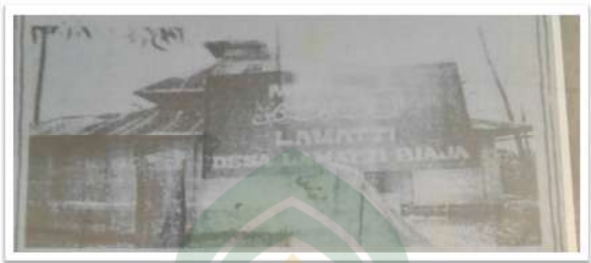
Gambar 1 : Gambar Masjid al-Mujahidin dari depan sebelum direnovasi.