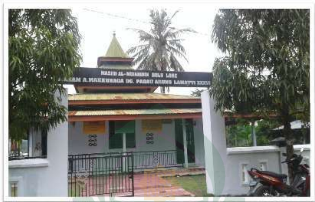
Gambar 3 : Masjid al-Mujahidin dari depan saat ini.