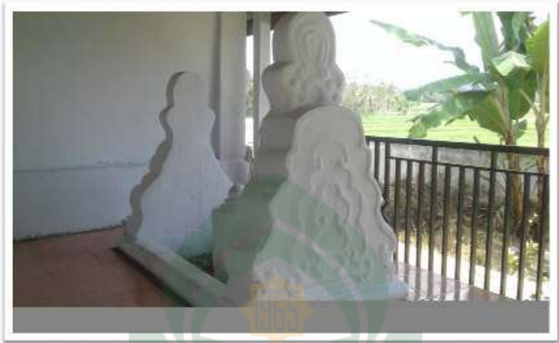
Gambar 7 : Makam Andi Makkuraga yang berada dibelakang masjid.