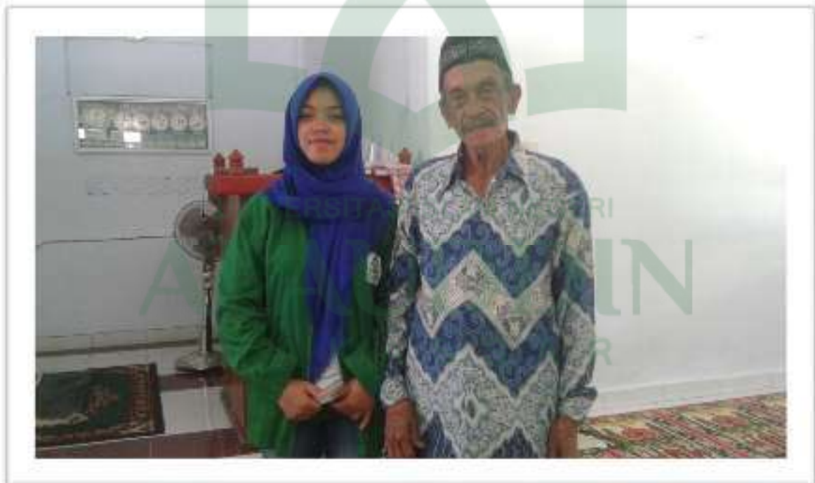
Gambar 11: Foto antara peneliti dan informan setelah melakukan wawancara ke dua.