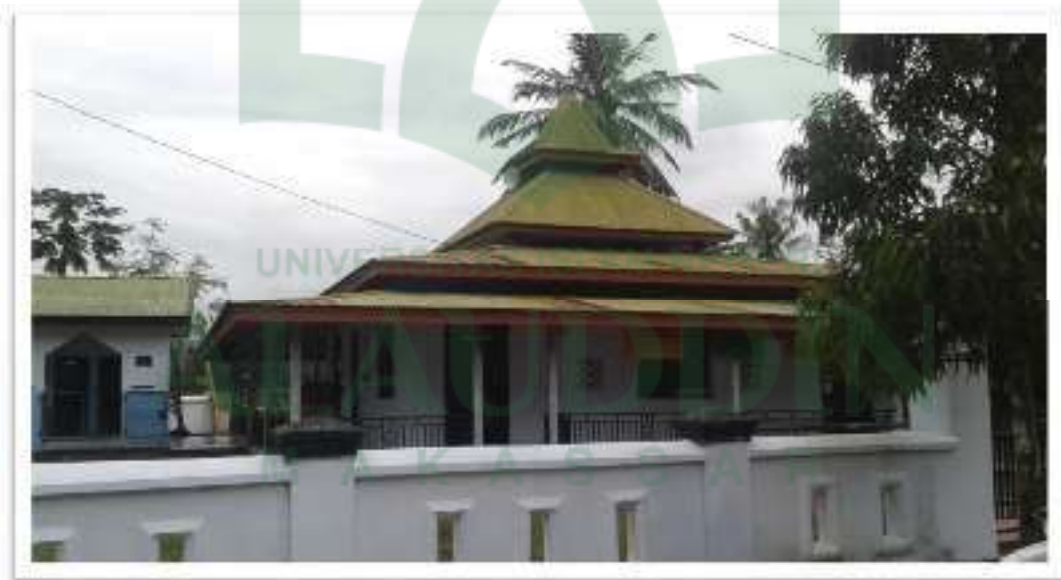
Gambar 2 : Masjid al-Mujahidin setelah dilakukan renovasi ke tiga kalinya.